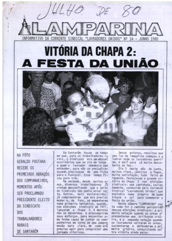
Figura 2: Informativo da Corrente Sindical Lavradores Unidos 1980.

da corrente congregava as delegacias sindicais do Una, da Transamazônica, da Morada Nova, da Baixa da Areia, do Chaves e do Jabuti (LEROY, 1991).