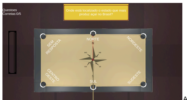
Figura 2. Bilhar geográfico

A primeira cabana apresentada no jogo armazena o minigame do “bilhar geográfico”, que utiliza a metáfora de um jogo de bilhar comum. O bilhar tem uma bola única no centro da mesa, um quadro de perguntas e caçapas nomeadas com o nome das regiões brasileiras - norte, nordeste, centro-oeste, sul e sudeste (Figura 2). Durante o jogo, perguntas são apresentadas para avaliar conhecimentos sobre essas regiões e os estados brasileiros, a criança deve então encaçapar a bola na região que corresponde à resposta correta.