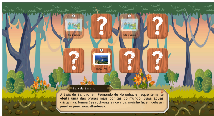
Figura 3. jogo da memória

O terceiro minigame é um jogo do tipo quiz (Figura 4) de perguntas e respostas, onde o professor pode elaborar e cadastrar as perguntas relacionadas ao conteúdo a ser avaliado. É criado um banco de questões diversificadas que pode ser organizado por conteúdo e nível de dificuldade para avaliar o nível de conhecimento das crianças.