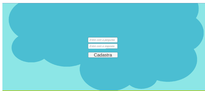
Figura 5. Tela de cadastro das perguntas

O minigame do quiz não utiliza muitos estímulos visuais ou sonoros, que podem ser altamente prejudiciais para crianças com TDAH. Tem uma interface limpa e sem distrações desnecessárias. O cadastro de perguntas do quiz ocorre por meio de uma tela que somente o professor consegue acessar (Figura 5).