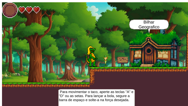
Figura 1. Instrução do minigame bilhar geográfico

A primeira cabana apresentada no jogo armazena o minigame do “bilhar geográfico”, que utiliza a metáfora de um jogo de bilhar comum. O bilhar tem uma bola única no centro da mesa, um quadro de perguntas e caçapas nomeadas com o nome das regiões brasileiras - norte, nordeste, centro-oeste, sul e sudeste (Figura 2). Durante o jogo, perguntas são apresentadas para avaliar conhecimentos sobre essas regiões e os estados brasileiros, a criança deve então encaçapar a bola na região que corresponde à resposta correta.