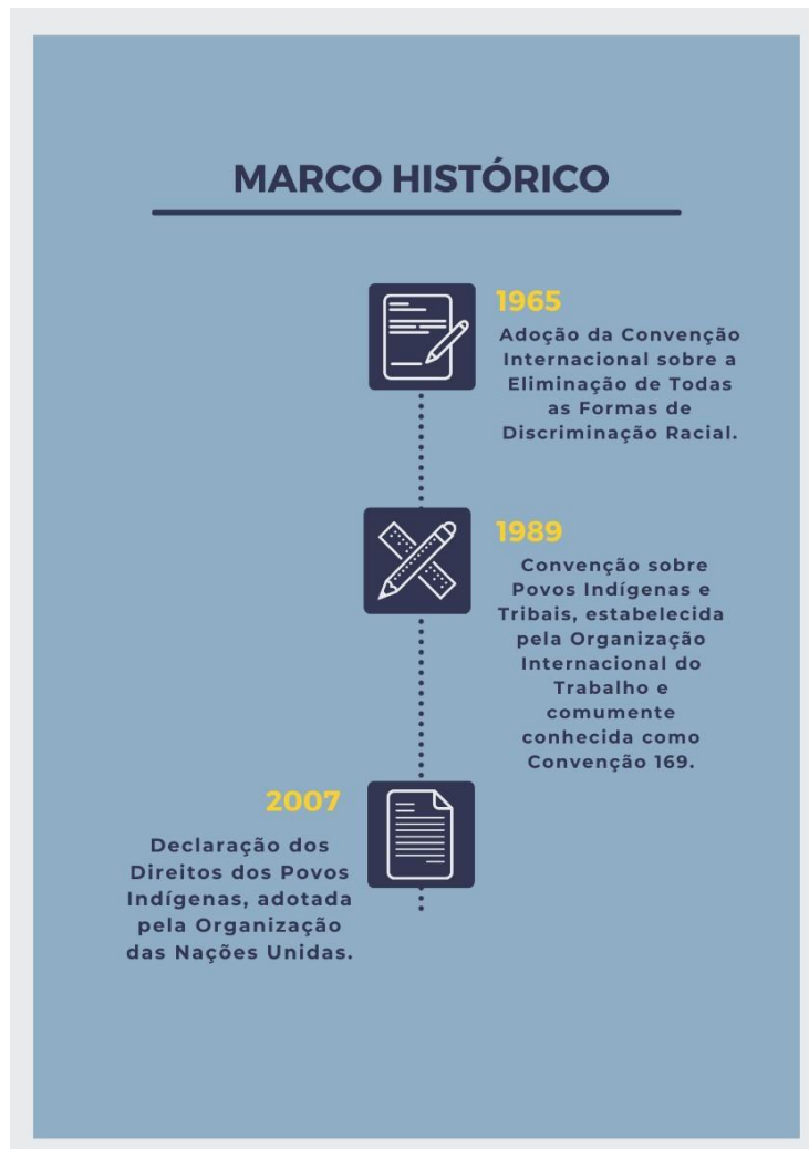
Figura 1 - Marco histórico da luta do povo indígena