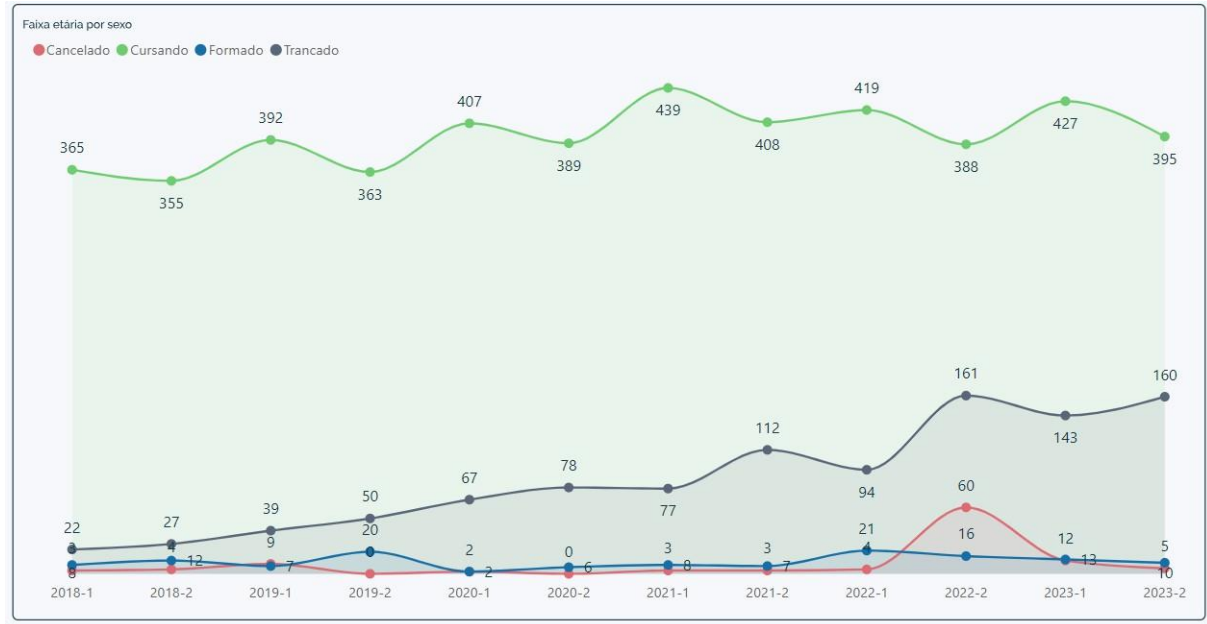
Gráfico 1 – Série histórica dos estudantes de graduação ingressantes pelo processo seletivo PSEI, de 2018 até 2023 na UFOPA