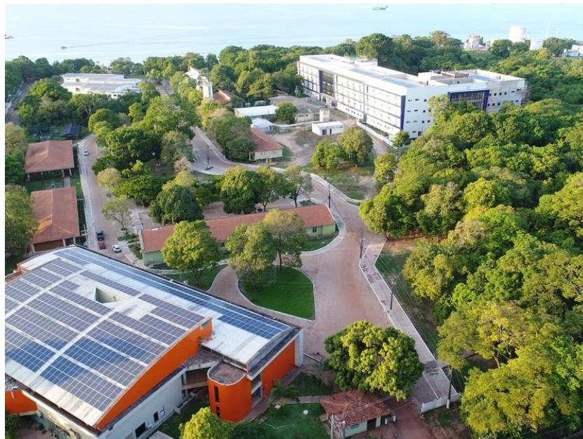
Figura 3 - A Universidade Federal Rural da Amazônia, sede no município de Santarém

A criação da UFOPA faz parte do programa de expansão das universidades federais, com o objetivo de ampliar o acesso ao ensino superior na Amazônia. A Universidade surgiu a partir da integração do Campus de Santarém da Universidade Federal do Pará (UFPA) e da Unidade Descentralizada Tapajós da Universidade Federal Rural da Amazônia (UFRA). (UFOPA, 2023) (Figura 3).