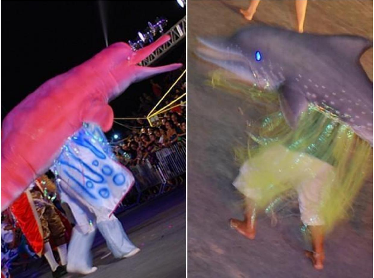
Figura 2 - O festival dos botos; animais aquáticos típicos da região, sendo o boto marrom o tucuxi e o cor de rosa, compostos de lendas amazônicas festival estabelecido pelo poder público desde 1997.