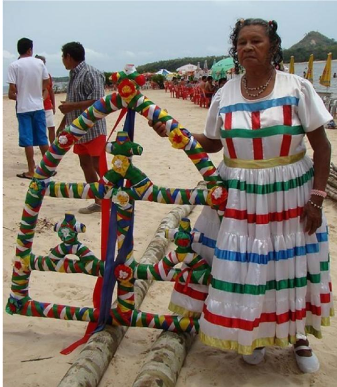
Figura 3- A Saraipora, mulher que carrega o símbolo do sairé, elemento tradicional que existe desde a origem do mesmo até a atualidade.