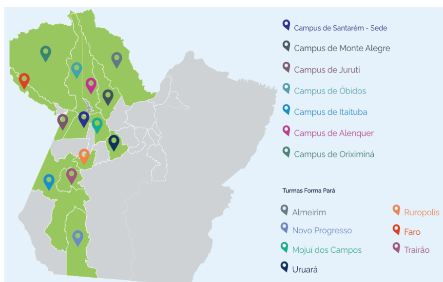
Figura 1 – Mapa dos municípios de localização dos campi e polos da Ufopa.

Após sua criação em 5 de novembro de 2009, por determinação do Ministério da Educação, a UFOPA permaneceu sendo tutorada pela UFPA por 4 anos. Atualmente, conta com 6 institutos, 44 cursos de graduação e 7.138 discentes matriculados. Além de estar presente em Câmpus regionais nas cidades de Alenquer, Juruti, Itaituba, Monte Alegre, Óbidos e Oriximiná. (Universidade Federal do Oeste do Pará, institucional, 2023).