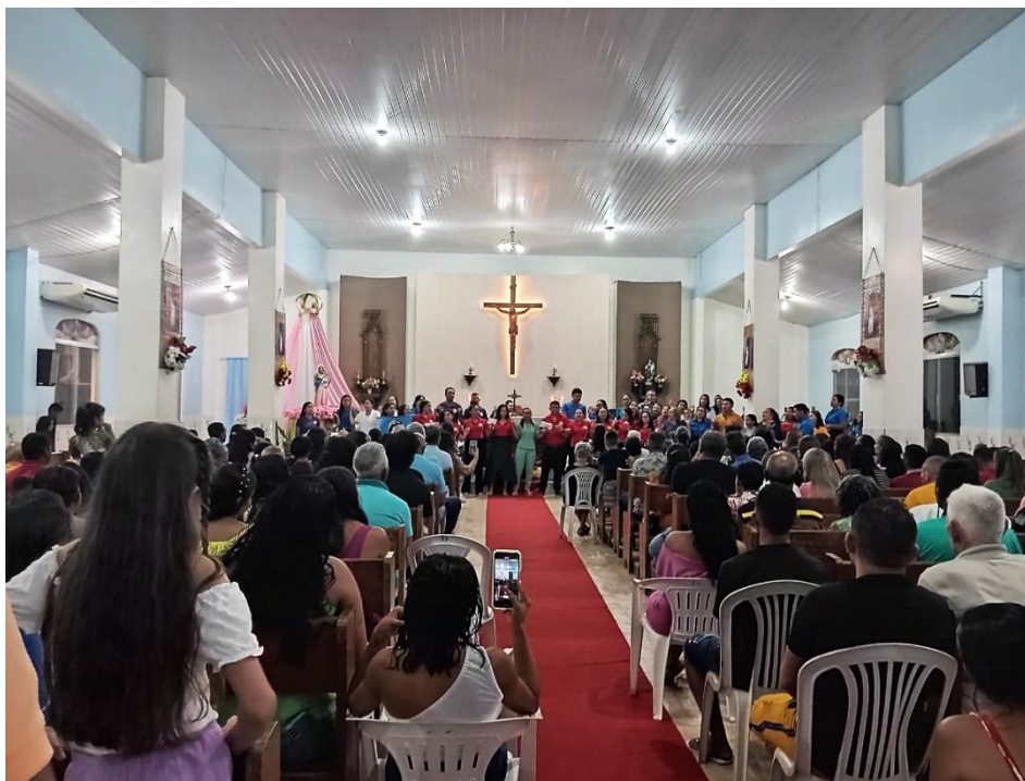
Imagem 1. Missa do último dia da Festa Religiosa

ocupados e foi preciso os organizadores da festa colocarem cadeiras para acolher as pessoas que chegavam, como pode observar na imagem 1 abaixo, a missa do último dia da festa religiosa.