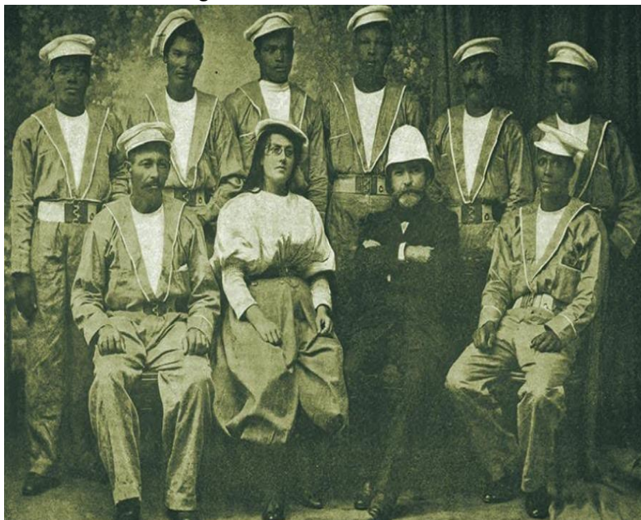
Figura 1. Marie Octavie Coudreau acompanhada de Henri Anatole Coudreau e sua tripulação em 1889, durante viagem ao rio Trombetas.