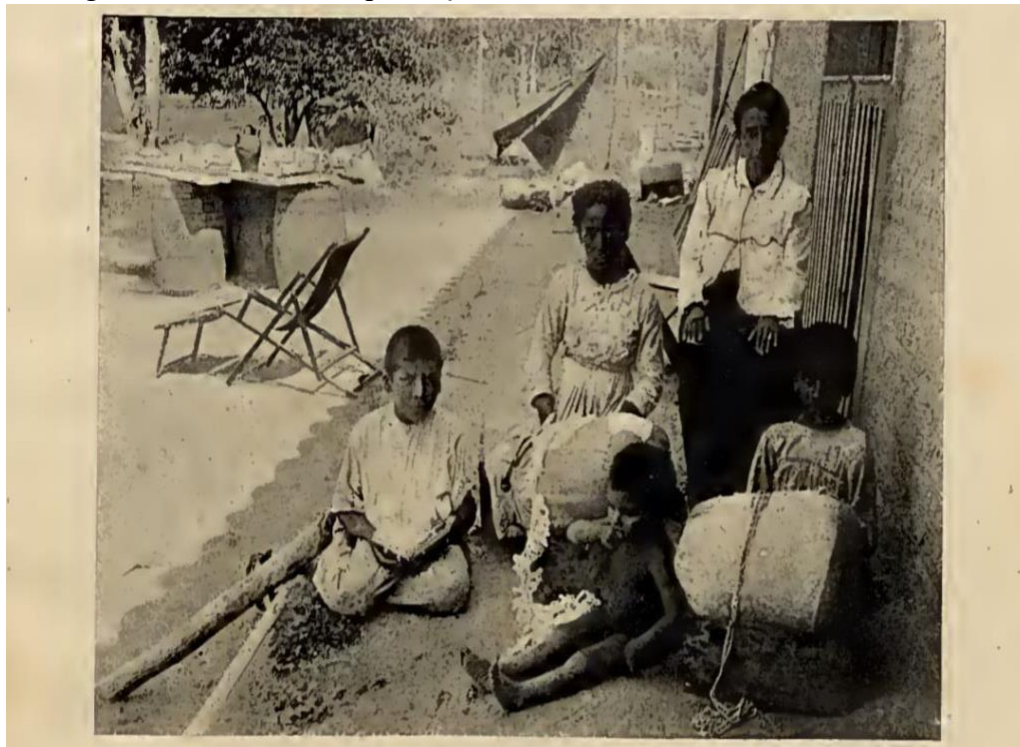
Figura 3. Moradores da povoação de Curuá em 1900.