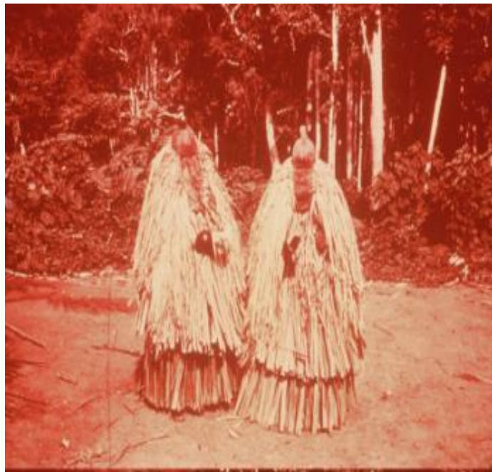
IMAGEM 5: RITUAL DO YAMO (por volta de 1950)

Antigamente os Waiwai praticavam diferentes atividades como danças, rituais, contavam mitos, faziam pinturas e pajelança. Existiam também festas principais como Yamo e Xorwiko .