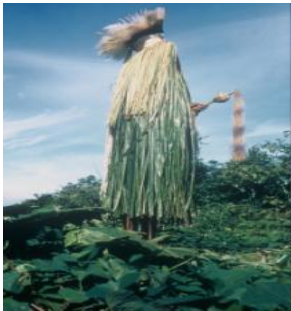
IMAGEM 6: DANÇA DOS MATADORES DE PORCO ( MANIMTOPO ) (por volta de 1950)

A cabeça recebia uma pintura e, atrás, no cabelo, era colocado um couro de ciima (um pequeno macaco). Os Waiwai dançavam com chocalho na mão ( maraca ).