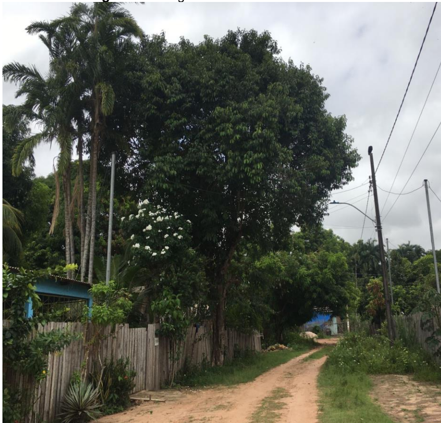
Figura 1 – Imagem do Bairro Pérola do Maicá

Santarém conta hoje com 48 bairros que dá forma a malha territorial urbana do município. O bairro Pérola do Maicá está localizado na periferia da cidade, em área de transição entre o rural e o dito urbano do município, e tem como vizinhos os bairros Jaderlândia, Maicá, Jutaí. Possui áreas de terra firme que se estendem até a Rua Santarém – limite com o bairro Maicá, que configura a parte urbana do bairro e outra área com características rurais, destacando como exemplo a área de várzea, que fica um período inundada (inverno amazônico) e outro período seco (verão amazônico).