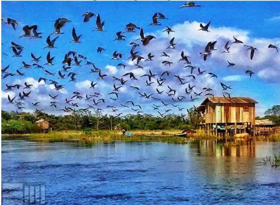
Figura 4 – Imagem do Lago Maicá

A área de várzea é considerada área de preservação permanente, o que possibilitou a implantação do projeto “Encanto do Maicá 2 ” que propicia o turismo de base comunitária para o bairro como uma alternativa de renda para as famílias participantes. O projeto enfatiza a necessidade de cuidar e divulgar as belezas existentes no lugar, além de favorecer os passeios turísticos de barco, e promove feiras agroecológicas e oficinas para valorizar e difundir os saberes locais.