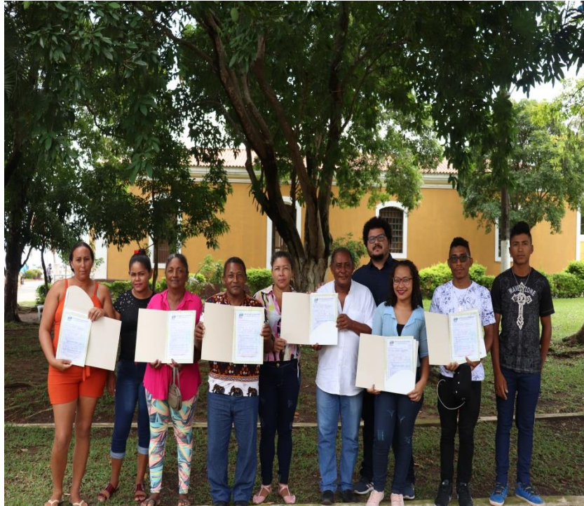
Figura 5 – Quilombolas do Maicá recebendo a titulação de parte de suas terras