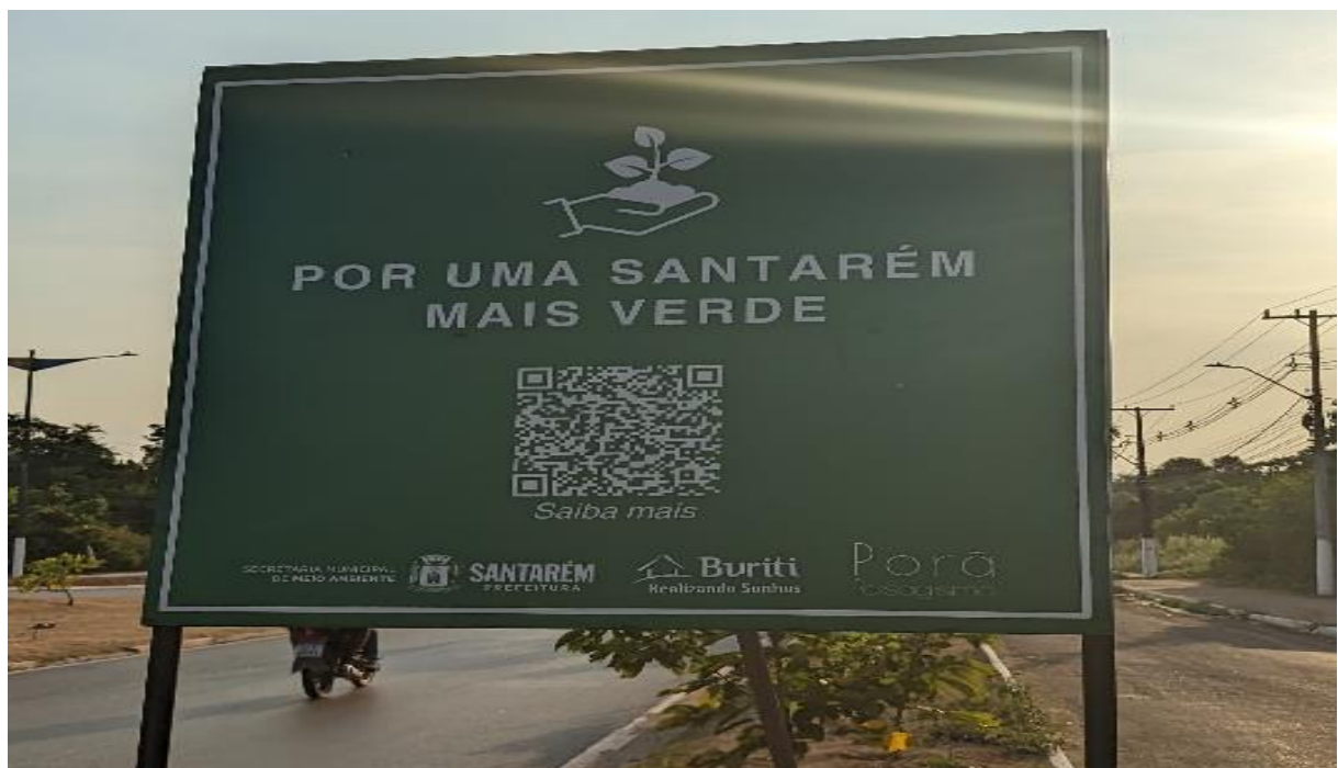
Figura 4 - Sinalização referente as mudas do projeto arborizar Santarém

Quando perguntado sobre a sinalização, foram informados que existem placas indicando o local do plantio das espécies, que chamam a atenção da população para a preservação das mudas (figura 4).