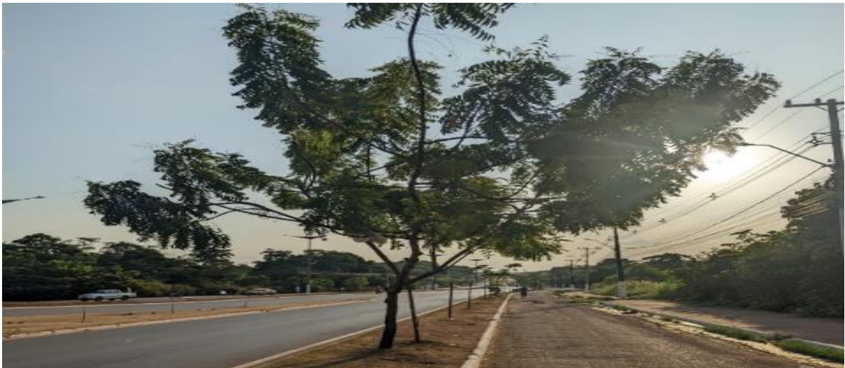
Figura 5 - Azadirachta indica

Foi plantada além das espécies nativas, ao menos uma espécie exótica, esta foi identificada pelo nome popular “Nim” ( Azadirachta indica ), bastante utilizada em diversas partes do mundo por suas propriedades medicinais e agrofloretais. Embora apresente muitos benefícios, o uso do Nim para a arborização urbana deve ser discutido com cautela, pois seu comportamento em ecossistemas fora de sua área nativa pode gerar impactos ecológicos significativos (figura 5).