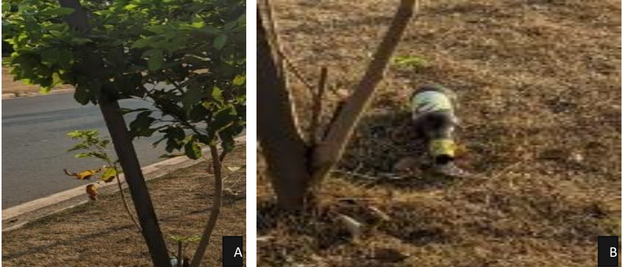
Figura 6 – (A) tutores de sustentação; (B) Garrafa de vidro encontrada próximo ao canteiro