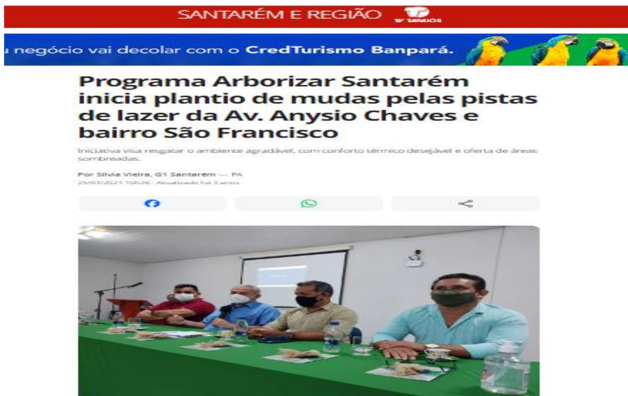
Figura 2 – Registro do início do projeto arborizar Santarém fixado no site G1.

Fonte: https://g1.globo.com/pa/santarem-regiao/noticia/2021/03/25/projeto-arborizar-santarem-inicia-plantio-de-mudas-pelas-pistas-de-lazer-da-av-anysio-chaves-e-bairro-sao-francisco . Acesso em: 25 ago. 2024