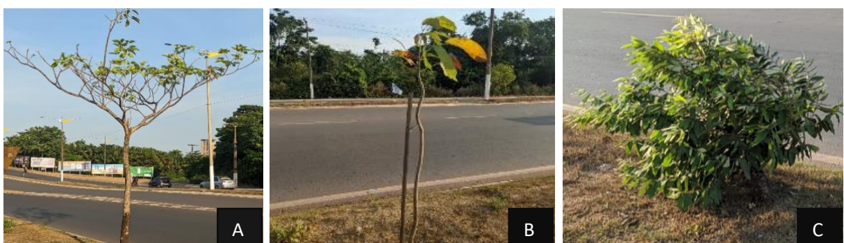
Figura 3- Mudanças em desenvolvimento usadas no projeto na Avenida Fernando Guilhon. (A) Handroanthus heptaphyllus : (B) Handroanthus albus : (C) Licania tomantosa .

Foram plantadas 188 mudas arborícolas na Avenida Engenheiro Fernando Guilhon, que engloba parte dos bairros do Santarenzinho, Maracanã. As principais espécies usadas foram o ipê rosa ( Handroanthus heptaphyllus ), ipê amarelo ( Handroanthus albus ), Oiti ( Licania tomantosa ), e uma espécie de nim ( Azadirachta indica ) (figura 3). Os ipês são caracterizados por serem árvores ornamentais de médio porte, valorizadas pela beleza de suas flores coloridas, já o Oiti é uma árvore de porte maior, ideal para áreas urbanas devido à sua resistência e à capacidade de fornecer sombra densa, o que aumenta o conforto térmico.