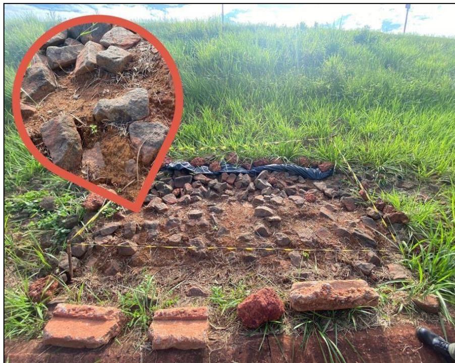
Figura 3- Rebrotas da vegetação daninha controlada por solarização.