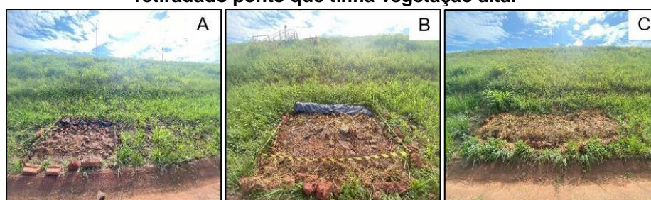
Figura 2- Vegetação após o período de solarização, a saber: A) lona retirada do ponto que tinha vegetação baixa; B) lona retirada do ponto que tinha vegetação média; C) lona retirada do ponto que tinha vegetação alta.

Na Figura 2, são apresentados os resultados obtidos com a solarização no dia da retirada da lona. No dia 16 de maio foi realizada a retirada da lona da vegetação baixa (Fig. 2A) e da vegetação média (Fig. 2B) e no dia 02 de junho retirou-se a lona da vegetação alta (Fig. 2C). Apesar da solarização ter duração diferentes entre os pontos, não houve influência na eficácia do método, alcançando resultados eficientes no controle vegetativo.