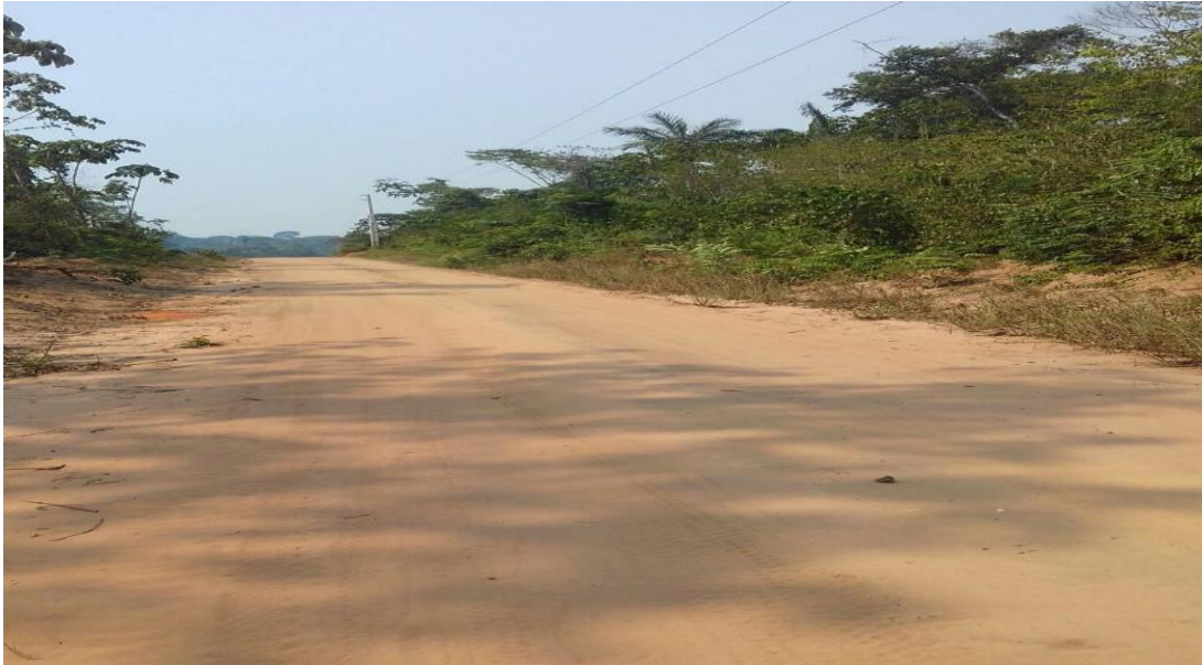
Figura 5: Fotografia da estrada de acesso à área do projeto e comunidades.

Para o entrevistado 3, os benefícios são muitos para aquela população, como por exemplo, o surgimento de postos de trabalho para alguns comunitários, a melhoria de suas moradias e a abertura da estrada. Antes o acesso era só por meio do rio, sendo a viagem para Santarém bastante cansativa, demorando cerca de doze horas. Hoje é de três horas, com disponibilidade de ônibus todos os dias da semana.