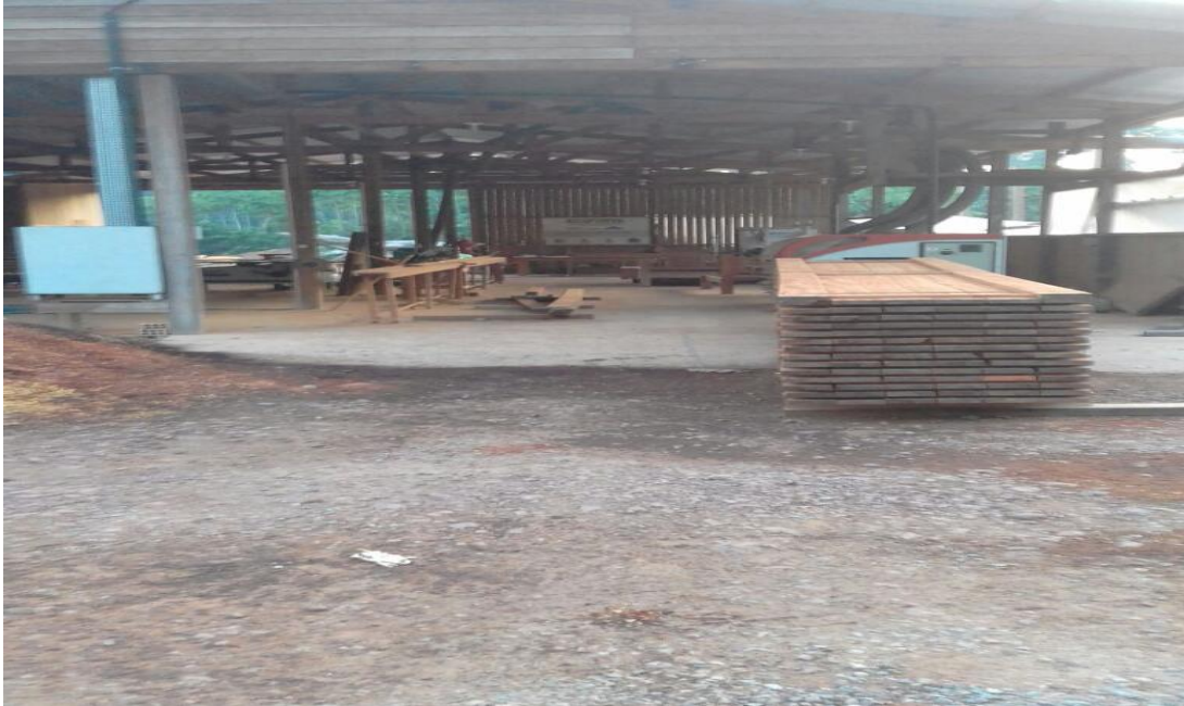
Figura 4: Fotografia da movelaria do Projeto Ambé.