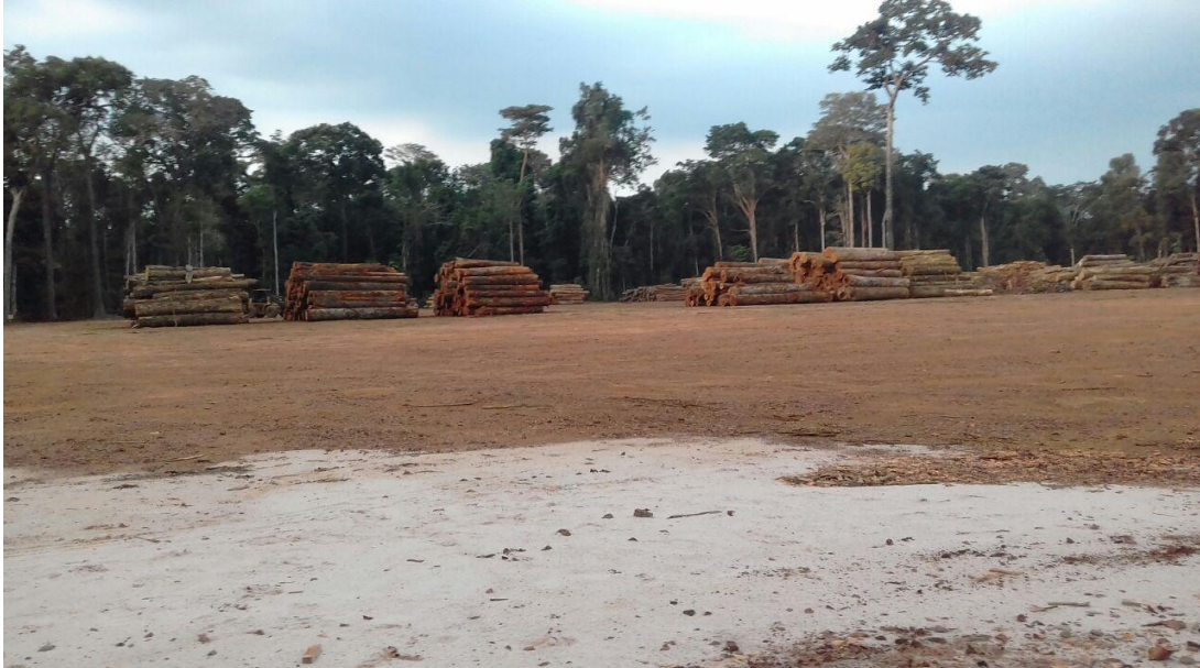
Figura 6: Fotografia da área do pátio do projeto com as toras de madeira.

Fonte: Maik de Lima Ribeiro (21/11/2017)