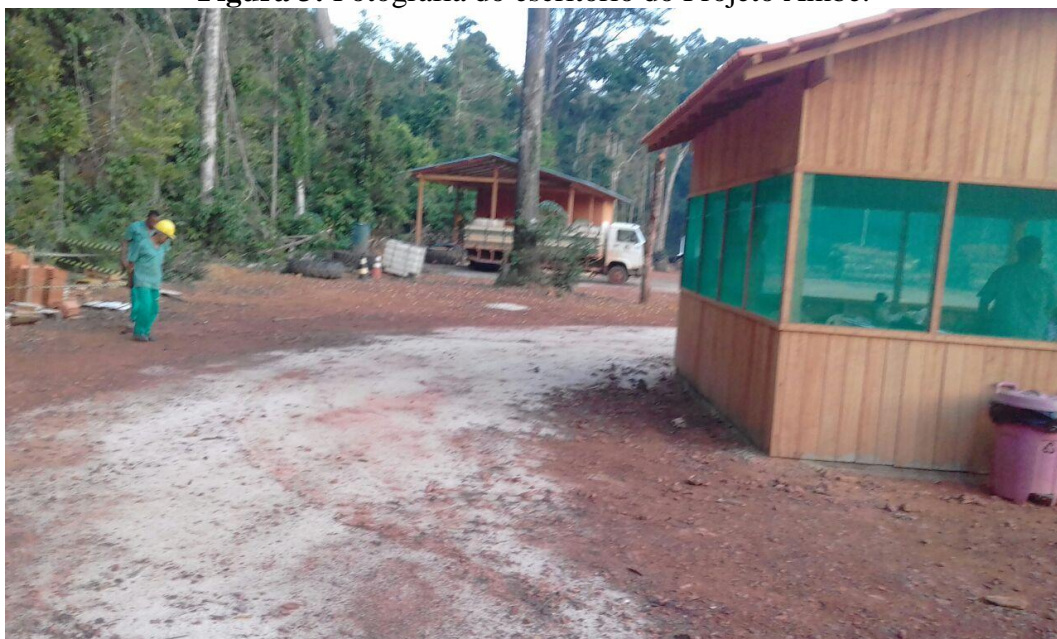
Figura 3: Fotografia do escritório do Projeto Ambé.