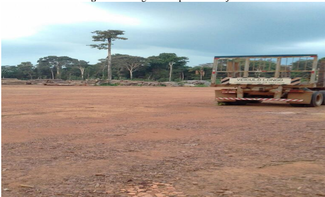
Figura 2: Fotografia do pátio do Projeto.

Nesta reserva florestal, considerada uma das mais importantes da região do Oeste do Pará, foi implementado um projeto chamado “Projeto Ambé”, criado pelos comunitários das comunidades que compõem a Flona, aprovado no ano de 2005, pelo IBAMA. O projeto utiliza como infraestrutura de campo, parte das instalações da base da FLONA-TAPAJÓS/IBAMA, localizada no Km 83, da BR 163, Santarém-Cuiabá. O projeto AMBÉ, é um projeto piloto de manejo florestal, desde 1999, que o Projeto de Apoio ao Manejo Florestal (PROMANEJO)/PP G7, executado pelo IBAMA e ICMBIO, o qual vem apoiando iniciativas comunitárias de manejo florestal na Flona do tapajós, e que envolve pequenas áreas de uso comunitário. Possui uma área total destinada ao manejo florestal madeireiro de 32.586.560 hectares, subdividida em duas áreas denominadas de Samambaias, com 13.559,69 hectares, e Amambé, com 18.994,87 hectares.