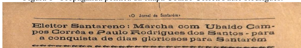
Figura 1 - Propaganda política da chapa Ubaldo Corrêa/Paulo Rodrigues.