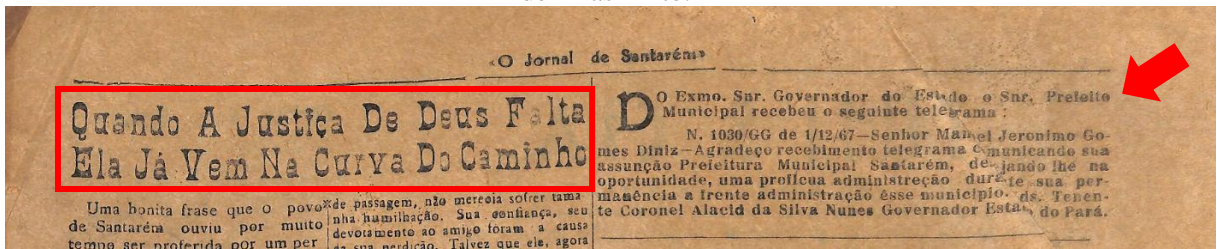
Figura 4 - Figura 4: Propaganda de cunho religioso e político no Jornal de Santarém sobre a cassação de Elias Pinto.