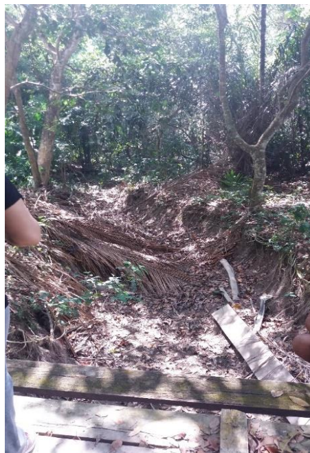
Figura 12: Assoreamento de igarapé dentro da APA Serra do Saubal