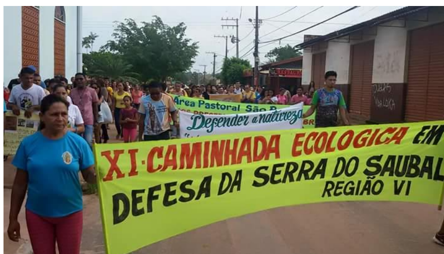
Figura 8: Caminhada ecológica promovida pela Comunidade Eclesial Nossa Senhora de Guadalupe para a Serra do Saubal

Continuando a análise, neste capítulo são definidas ações estratégicas que visam um bom ordenamento ambiental, sendo um deles, e talvez o principal, pois também é uma das diretrizes preconizadas na Política Nacional de Meio Ambiente, a educação ambiental. No PDPS, a educação ambiental é o caminho a ser percorrido com vistas a promoção de práticas socioeconômicas, tendo como intuito, proteger, conservar e recuperar o meio ambiente. Na APA Serra do Saubal, a educação ambiental se resume a “ações ambientais” promovidas pela Comunidade Eclesial Nossa Senhora de Guadalupe (figura 8), que de uma a duas vezes ao ano, promovem caminhadas ecológicas com objetivo de chamar a atenção dos moradores e comunidades vizinhas para luta em proteção dos atributos naturais da região.