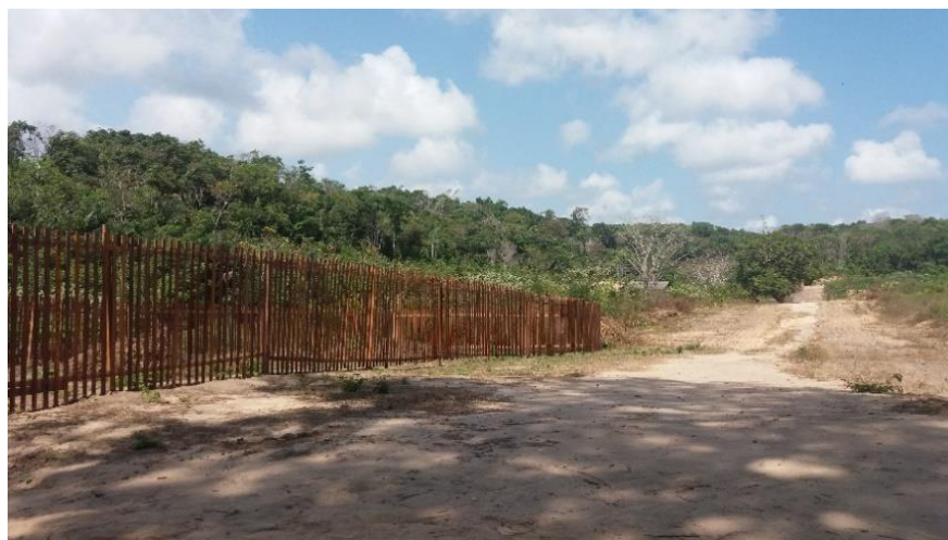
Figura 7: Desmatamento para futuras residências no entorno da APA Serra do Saubal

O PDPS dedicou uma subseção relacionada as unidades de conservação (subseção II), no Título II; capítulo III que trata da Organização do Meio Ambiente, Seção I da Política Ambiental. São artigos que contém instruções gerais, que falam apenas da necessidade de criar as UCs baseados em estudos de viabilidade, e que estejam em consonância com os termos do Sistema Nacional de Unidades de Conservação da Natureza, buscando se articular nas esferas federal e estadual, para o envolvimento na gestão destas unidades de conservação.