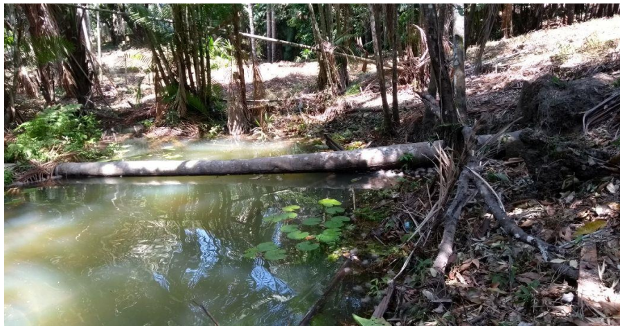
Figura 11: Retirada da mata ciliar no entorno do igarapé que fica localizado dentro da APA Saubal, bairro Vigia