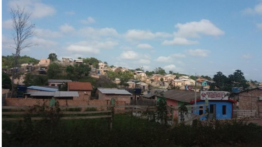
Figura 4: Ocupação “Bairro” Bela Vista 2 no entorno da APA Saubal

Organização do Território, e prevê que sejam removidos pessoas e equipamentos de áreas de risco e habitabilidade ambiental, coibindo seu repovoamento, mas que, no entanto, na prática isso ainda não ocorreu.