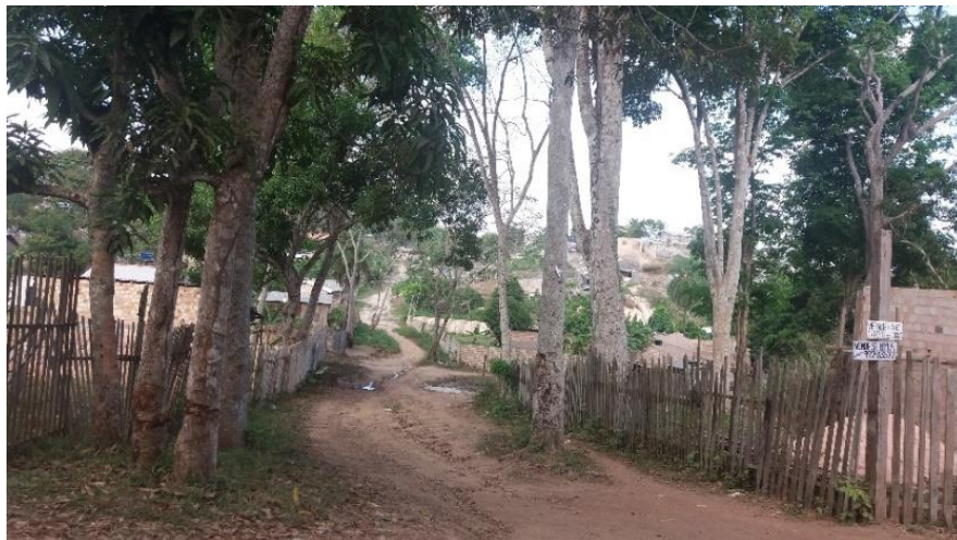
Figura 6: Desmatamento para a consolidação da infraestrutura do bairro, com abertura de ruas