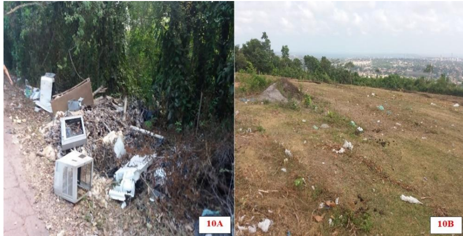
Figura 10:(10A) despejo inadequado de resíduos sólidos na estrada que sobe para a Serra APA do Saubal;(10B) Topo da Serra com resíduos em toda a sua extensão