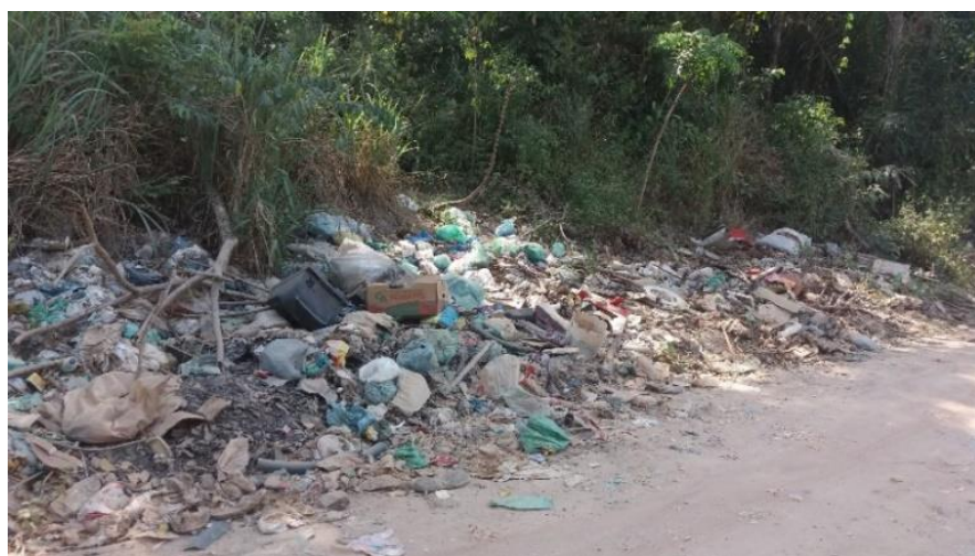
Figura 9: Despejo de resíduos sólidos no entorno da APA Serra do Saubal

No início de implantação da APA Serra do Saubal, havia a participação do órgão ambiental municipal nesse processo de fiscalização. A SEMMA disponibilizava um fiscal que se dirigia ao local uma vez por semana em horários diferenciados e que coibia a entrada de lixo em seu interior, bem como a captura de aves, plantas e caça de animais, mas que depois de certo período esse trabalho foi deixado de lado, essa ausência pode ter potencializado a ampliação dos danos ambientais. Hoje a área sofre as agressões decorrentes do intenso processo de urbanização em seu entorno, o que leva ao despejo inadequado de lixo no entorno da serra, (figura 9), e em seu interior (figura 10A, 10B), e desmatamento da mata ciliar dos igarapés que cortam a APA, (figura 11), e assoreamento desses igarapés, (figura 12).