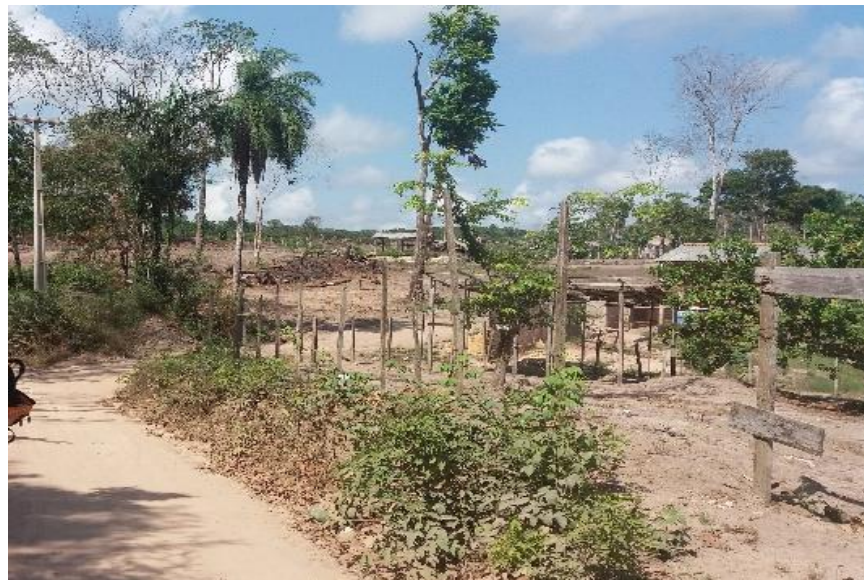
Figura 5: Desmatamento e novas residências