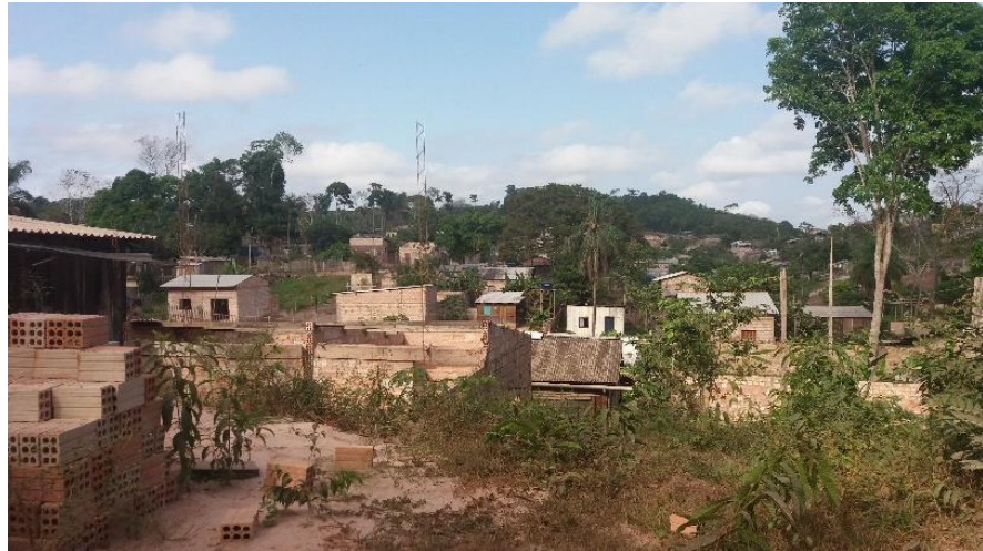
Figura 2: Novas residências no entorno da APA Serra do Saubal

fazendo com que haja um parcelamento inadequado do mesmo em relação a infraestrutura urbana, causando degradação ambiental da pouca área de mata que ainda resta.