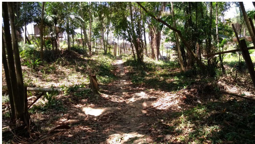
Figura 3: Desmatamento e surgimento de novas residências dentro da APA Saubal e próxima a margem do igarapé do Mutunuy, no bairro Vigia.

É importante ressaltar também, que a região no entorno, principalmente a ocupação Bela vista II, apresenta um relevo muito acidentado, e a urbanização que ali se consolida, sob um olhar mais genérico, pode-se classificar como uma urbanização de risco (figura 4). Toda a vegetação foi e está sendo retirada (figura 5) para a construção das residências e consolidação da infraestrutura do bairro (figura 6 e 7), deixando sua estrutura frágil sem cobertura vegetal. Isso se contrapõe a uma das medidas prevista no Plano Diretor de Santarém, no título II, que trata das Políticas Setoriais de Desenvolvimento do Município; no capítulo I, que trata da