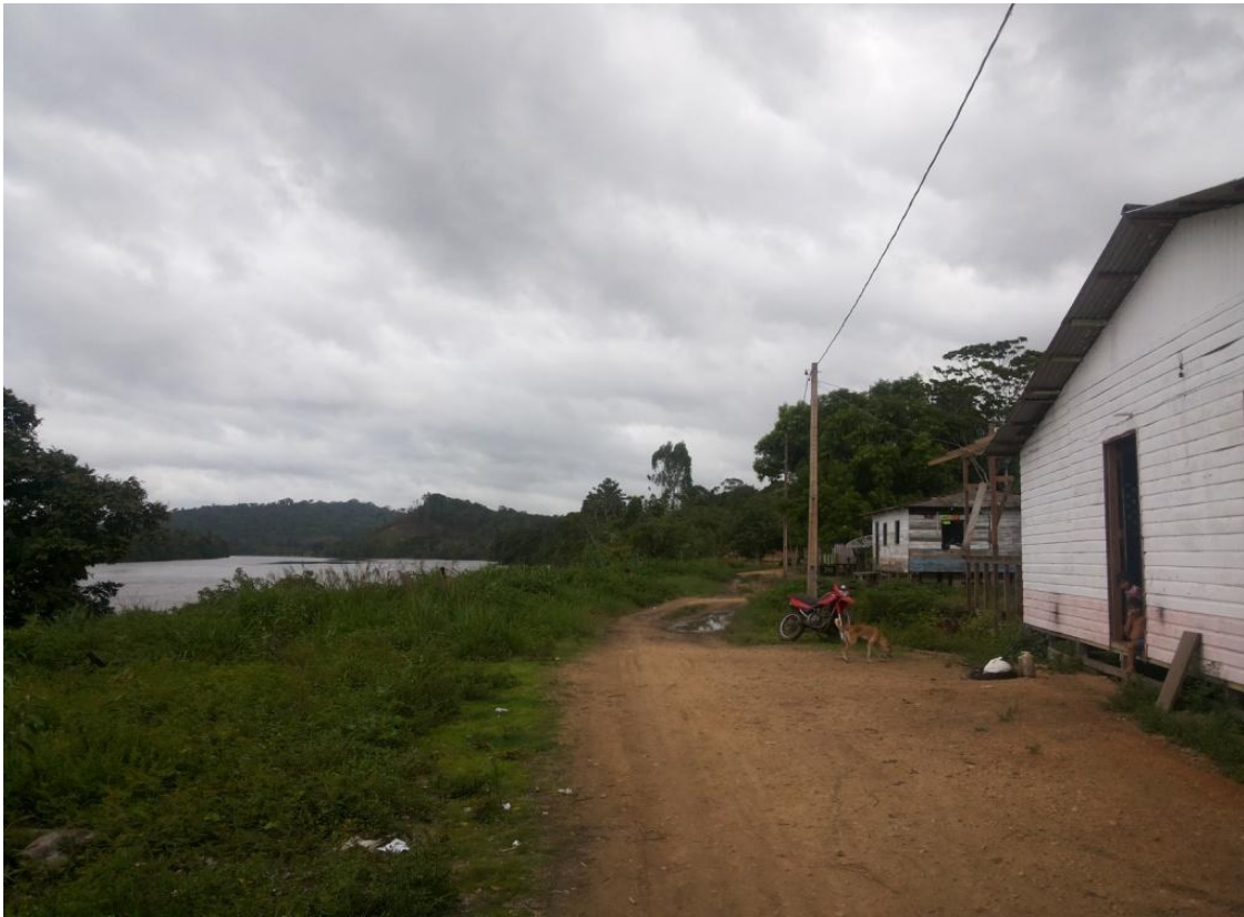
Figura 3. Comunidade do Recreio, rio Paru.

O rio Jari nasce nos limites do Pará com o Suriname e desce paralelo ao Paru, desaguando também no rio Amazonas, após atravessar cachoeiras. Ele é a fronteira natural entre os estados do Pará e do Amapá, e apenas seus afluentes da margem direita (igarapés Paruzinho, Ipitinga e Carecaru) pertencem ao município de Almeirim (SEPOF, 2008).