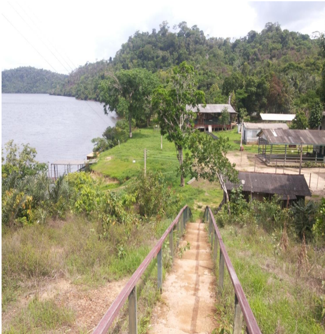
Figura 2: Comunidade de Cafezal, rio Paru.

Através do Paru e de seus afluentes (Citaré, Itapecurú, Tucurunã e Uricurituba, entre outros), ao longo dos séculos, povos indígenas, caboclos e migrantes percorreram as florestas de Almeirim, sendo ele imprescindível para a economia e a história da região.