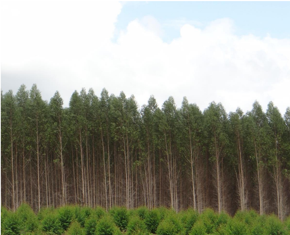
Figura 6: Floresta de eucalipto no ramal Monte Dourado-Recreio.

O empreendimento do norte-americano se encaixava perfeitamente nos planos governamentais para crescimento econômico da Amazônia, os quais previam: a intensificação da ocupação da região, a proteção das fronteiras e a implantação de grandes projetos desenvolvimentistas. Sob o lema “terras sem homens para homens sem terra”, o governo brasileiro favoreceu o loteamento e a destinação de grandes áreas para empresas multinacionais, bancos nacionais e estrangeiros a fim de também fomentar na região outra lógica econômica, integrando-a definitivamente no mercado internacional (VELHO, 2013).