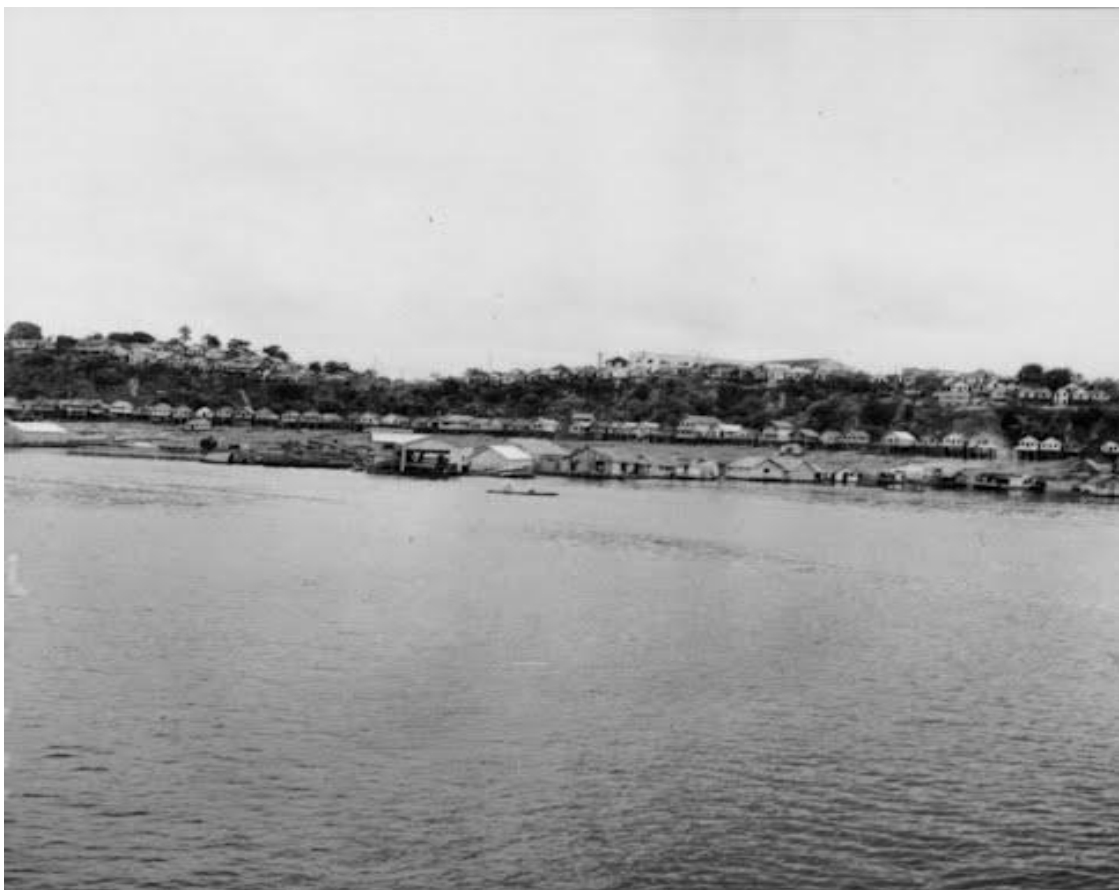
Figura 5: Vista de Almeirim em 1960.

A origem de Almeirim é contada de duas maneiras na maior parte das referências pesquisadas. De acordo com a primeira versão, a cidade se originou de uma fortificação holandesa instalada próxima a uma aldeia indígena chamada Paru. Na outra narrativa, atribui-se a origem de Almeirim aos frades capuchinhos da ordem católica de Santo Antônio, que, no processo de catequese dos povos indígenas na região, teriam construído na aldeia Paru um centro de atração para esses povos.