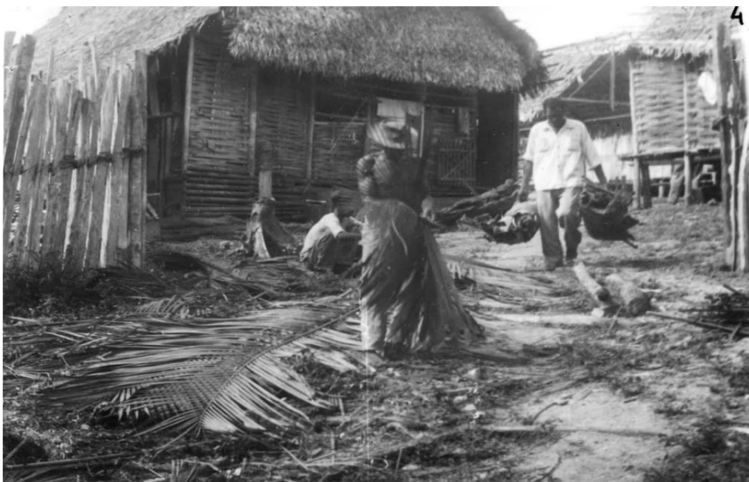
Figura 10: Almeirim na década de 1950/1960.

Porém, passado o ápice da exploração da borracha após a Segunda Guerra Mundial, e quando o valor de mercado da balata decaiu, nos anos 1960/70, em função de sua substituição por produtos sintéticos (CARVALHO, 2013), muitos extrativistas de Almeirim perderam suas fontes de renda. O que se seguiu foi um período de estagnação econômica em que a subsistência das famílias que dependiam do extrativismo ficou comprometida.