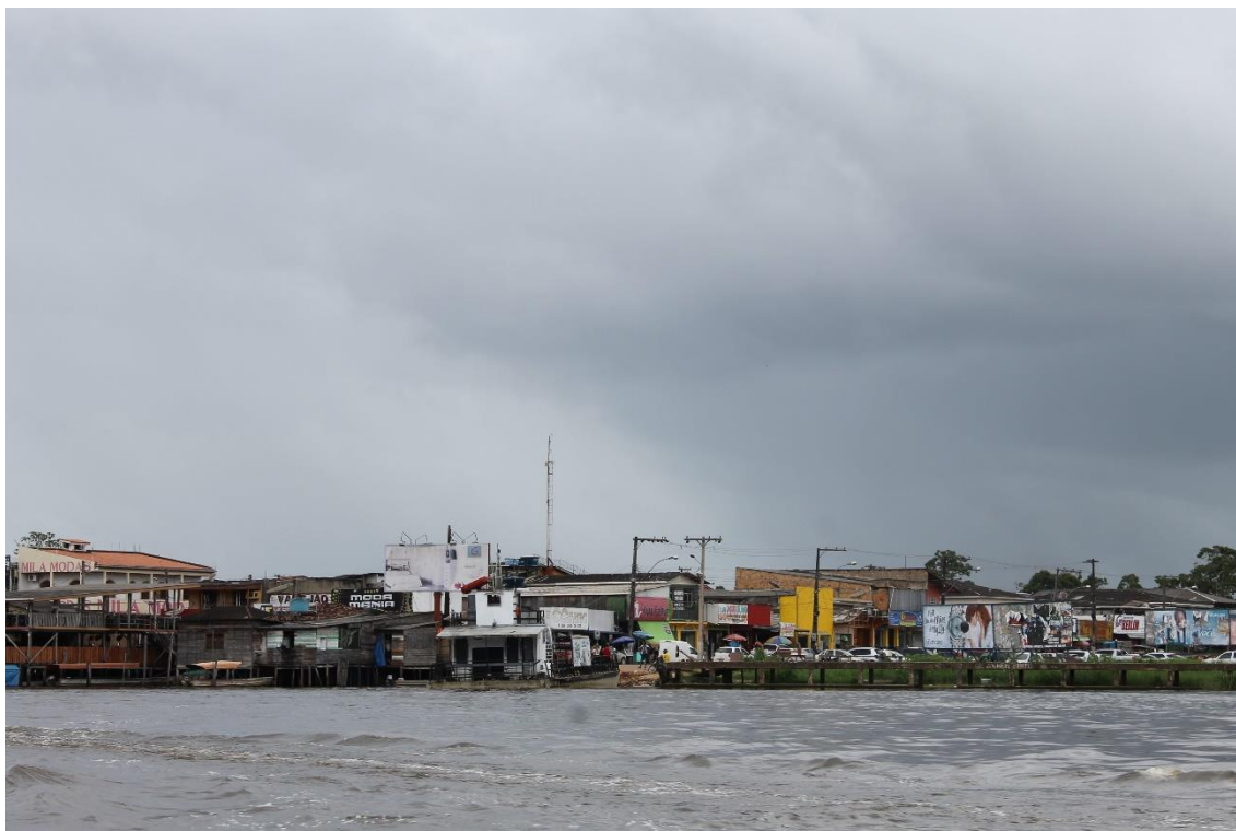
Figura 4: Vista de Laranjal do Jari, rio Jari.

formou a cidade de Laranjal do Jari, vulgarmente referida como o “beiradão” onde vivem trabalhadores do projeto Jari.