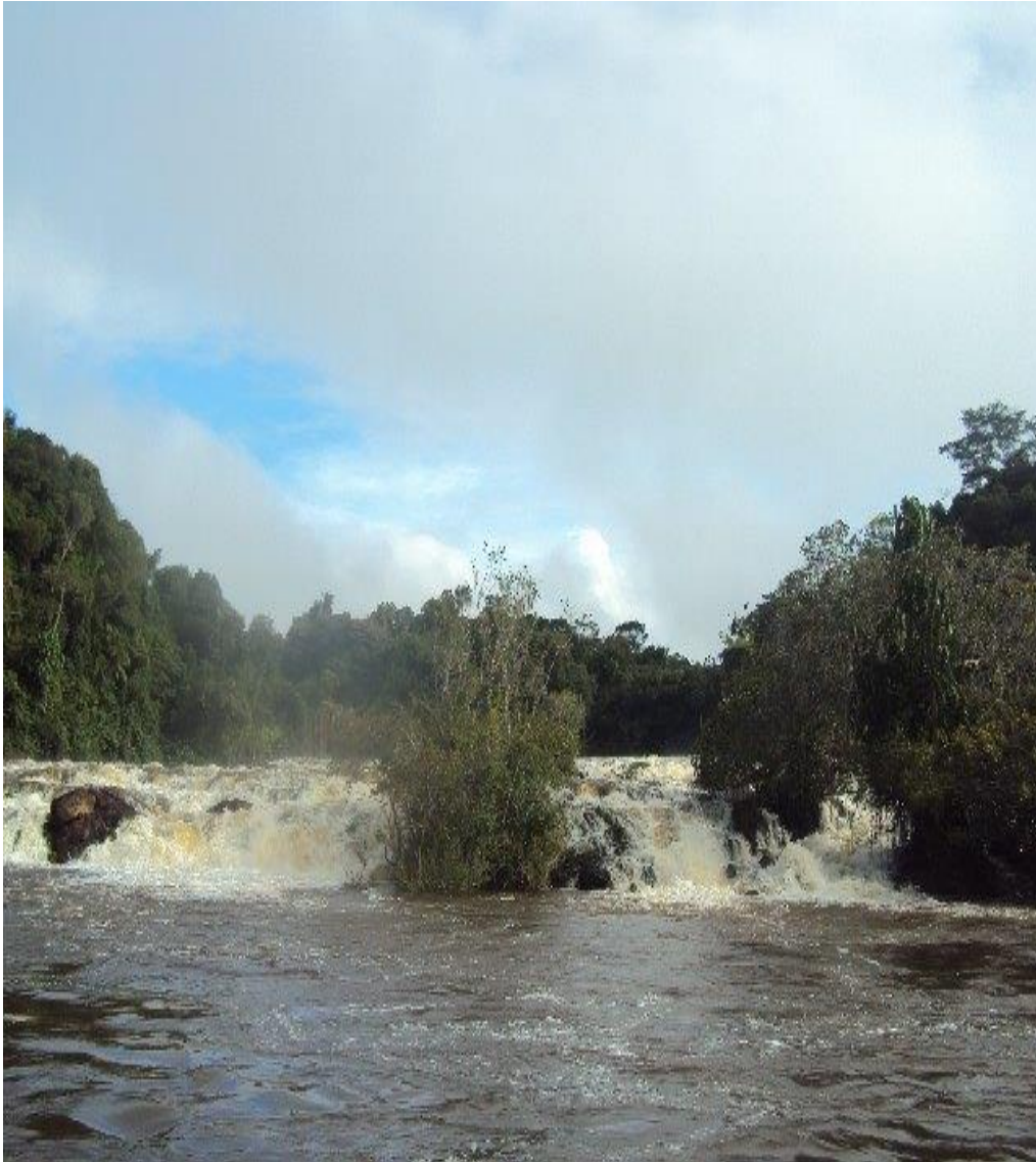
Figura 11: Cachoeira do Panãma.