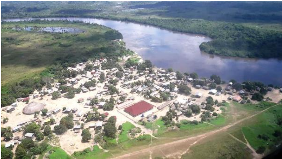
Fig. 01 – Vista aérea da aldeia Mapuera, da etnia Wai Wai, na Terra Indígena Trombetas-Mapuera, município de Oriximiná - PA.

A Terra Indígena Trombetas-Nhamundá tem uma população de aproximadamente duas mil pessoas e a Trombetas-Mapuera em torno de duas mil e seiscentos pessoas, somando um total de 12 etnias. A aldeia Mapuera (Fig. 01) concentra a maior densidade demográfica, algo em torno de dois mil e duzentos habitantes. A maior parte das aldeias fica às margens do rio Mapuera e o acesso ocorre por esta drenagem, afluente do rio Trombetas.