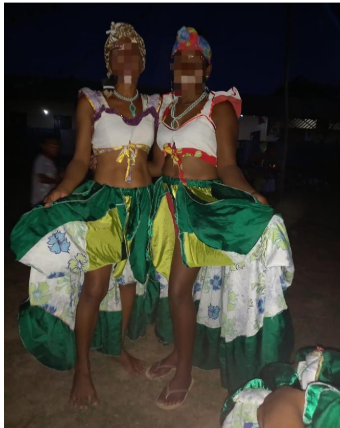
Imagem 7. Apresentação do festival folclórico em 28 de agosto de 2023.