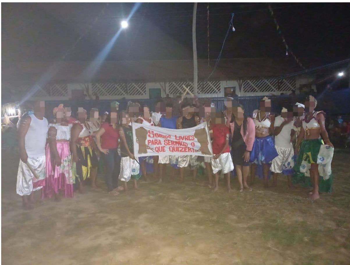
Imagem 9. Imagem do festival folclórico de 28 de agosto de 2023.