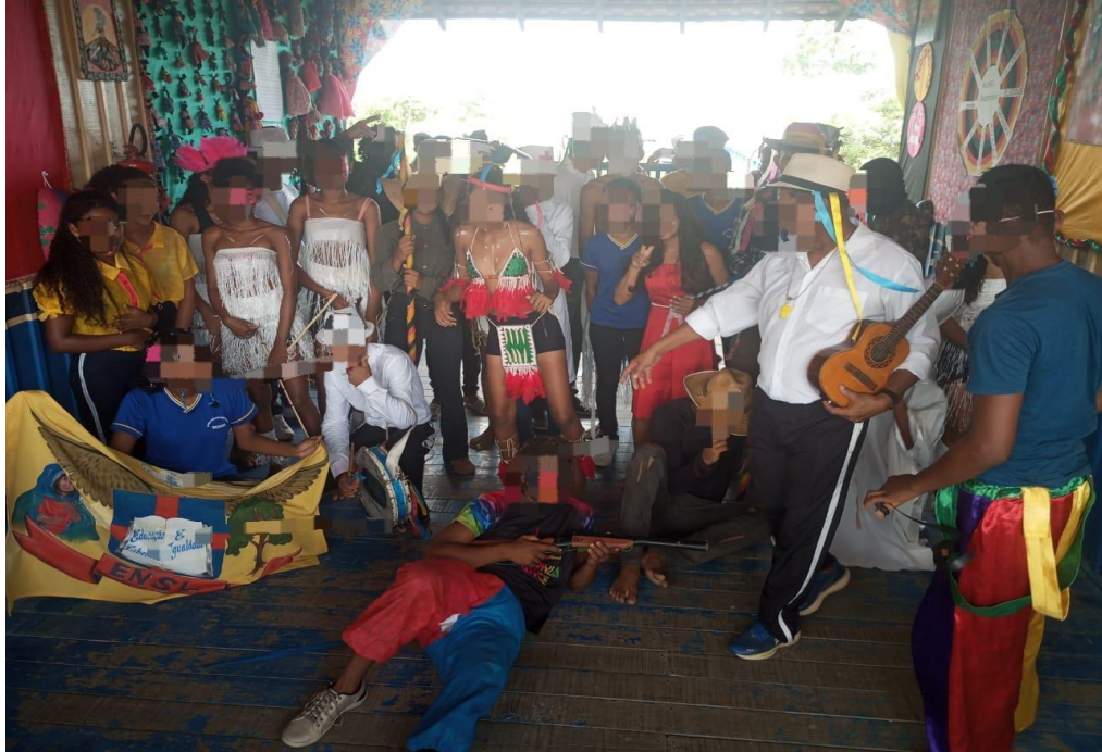
Imagem 10. Produção teatral na escola realizado pelos alunos do Ensino médio.