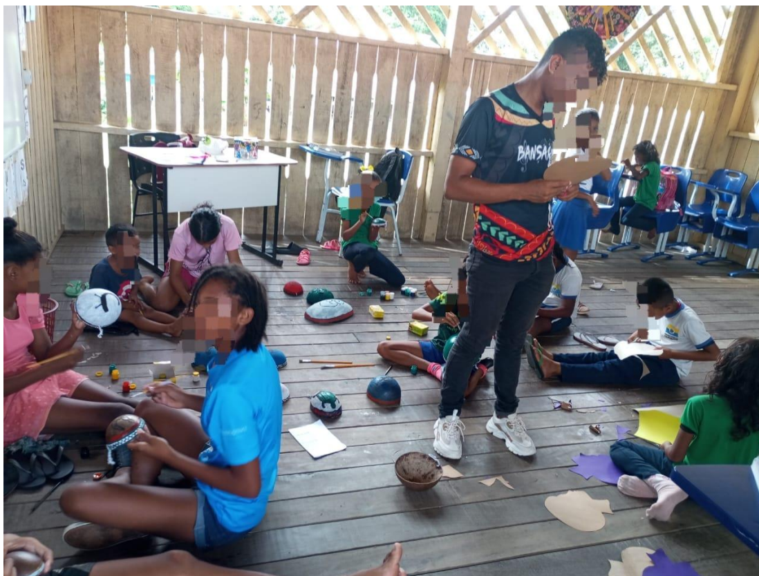
Imagem 8. Oficina de pinturas de cuias que estão logo na entrada da escola Nossa Senhora do Livramento.