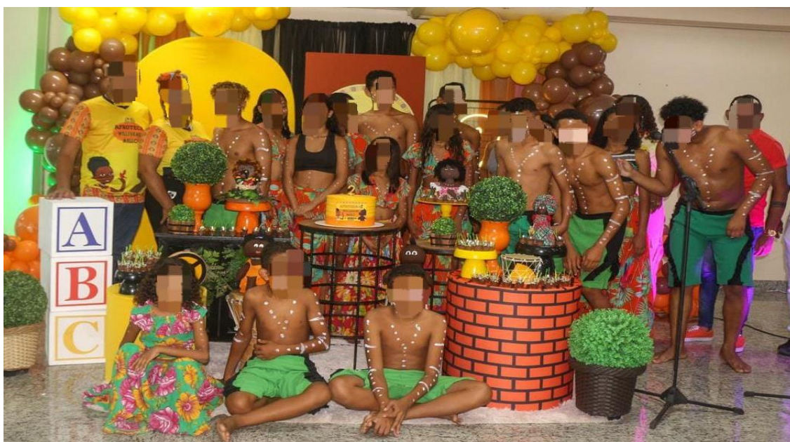
Imagem 03. Apresentação de dança do grupo Pérolas Negras da com de Saracura.