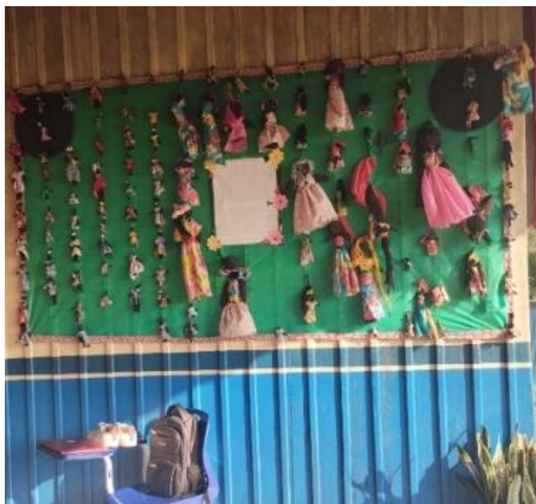
Imagem 5. Imagem da entrada da Escola Nossa Senhora do Livramento destaca o mural de cabelos de lelê, confeccionados pelos alunos da escola.

A Imagem 4, apresenta a elaboração da oficina de confecção de bonecas abayomis na turma do fundamental I, atividade desenvolvida para o fortalecimento da identidade racial na escola, essa oficina faz parte do projeto de metas do PPP da escola, pois, essa oficina fortifica o ensino da cultura afro na escola.