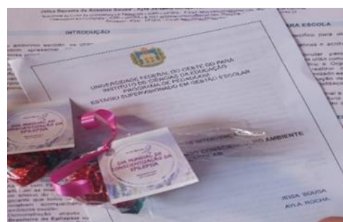
Figura 2- Folder - Guia de bolso para educadores e comunidade escolar.