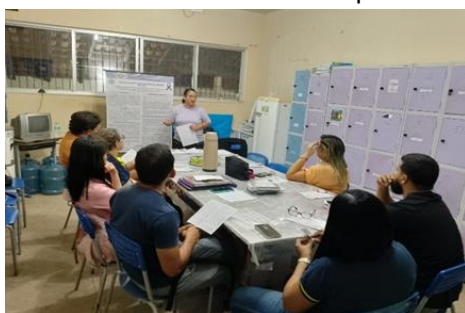
Figura 1- Ação educativa para professores, gestores, técnicos administrativo e apoio educacional da E.E.Madre Zeinep.

A instrução principal das diretrizes, inicia a partir da matrícula na escola do aluno com esse diagnóstico, no qual esta deve criar um registro de dados a fim de possibilitar a promoção de atitudes receptivas, empáticas e acolhedora com esse aluno, em seguida promover o desenvolvimento de ações voltadas à valorização da autoestima do aluno e a capacitação de toda a comunidade escolar para no caso de presenciar uma crise convulsiva realizar os primeiros socorros.