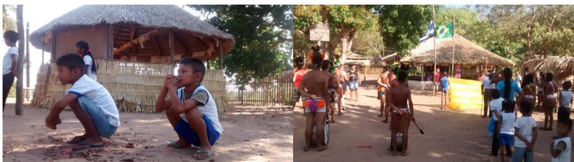
Alunos durante o desfile escolar na área Maloca.