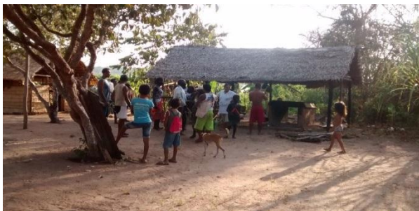
Pretinhos se preparando para a brincadeira dos pretos. Área da casa de farinha.