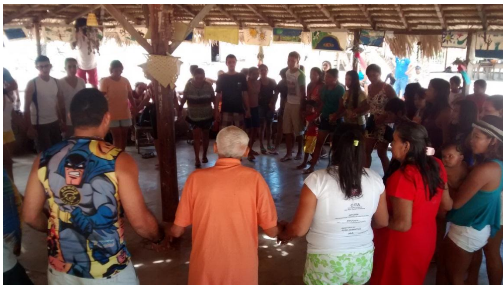
Reunião na maloca.