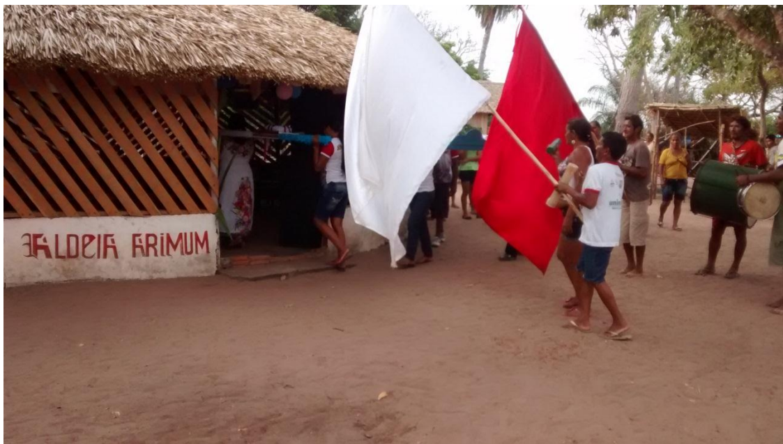
Foliões e festeiros. Festa de Nossa Senhora Aparecida. Área Maloca.