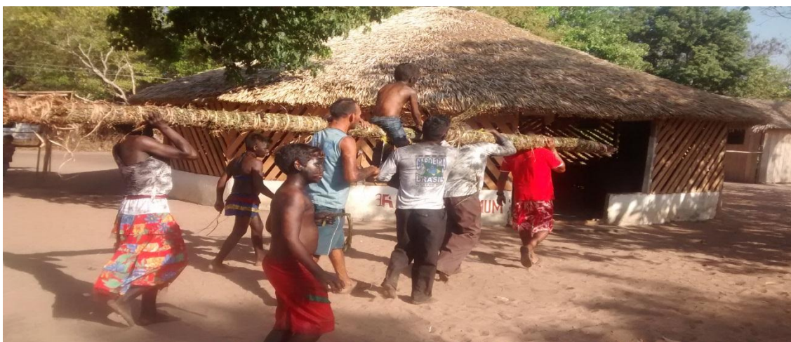
A brincadeira dos preto e a derruba do mastros. Área da maloca.