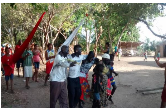
Pretinhos chegando ao local do mastro.