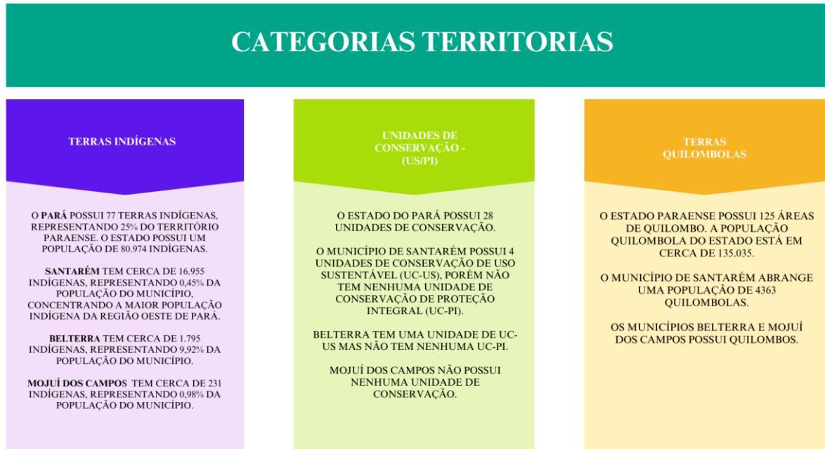
Figura 2: Categoria das populações territoriais