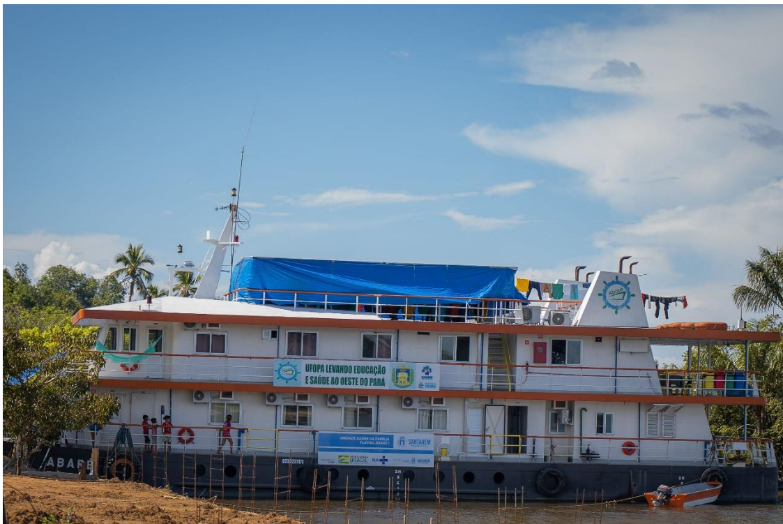
Figura 2 – Unidade Básica de Saúde Fluvial Abaré na expedição de 2023