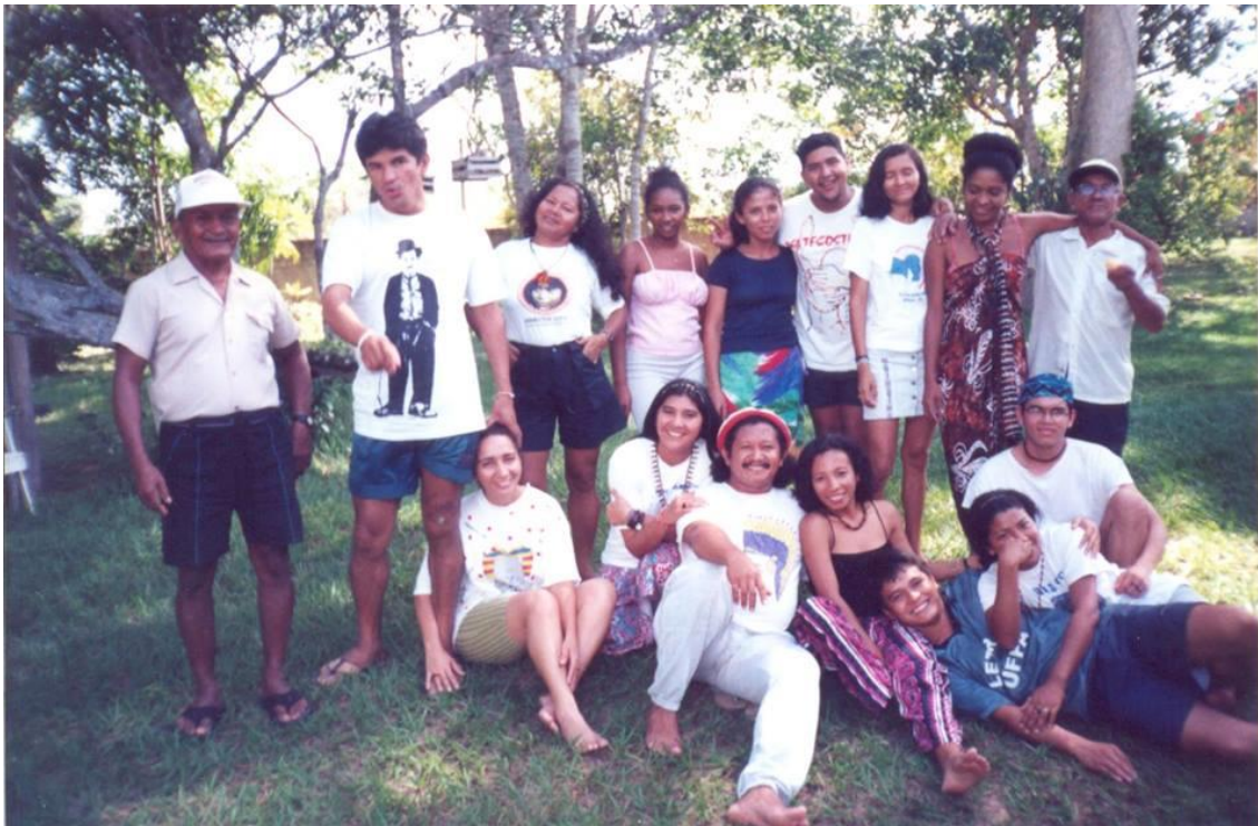
Figura 4 - Reunião do GRENI, por volta de 1997, em Santarém-PA.

Desde o início dos anos 1990, o Grupo de Reflexão de Religiosos Negros e Indígenas (GRENI), formado por seminaristas e religiosos da Igreja Católica, reunia para fazer reflexões e buscar entendimentos sobre a história e as identidades afro e indígena, valorizando os costumes e as culturas supostamente associados a estes grupos. O GCI foi criado, em 1997, por parte dos membros do GRENI em Santarém. Segundo Vaz Filho (2010, p. 309), com a criação do GCI “o objetivo era compor um grupo que se voltasse, especificamente, aos indígenas, sua história, cultura e identidade.”