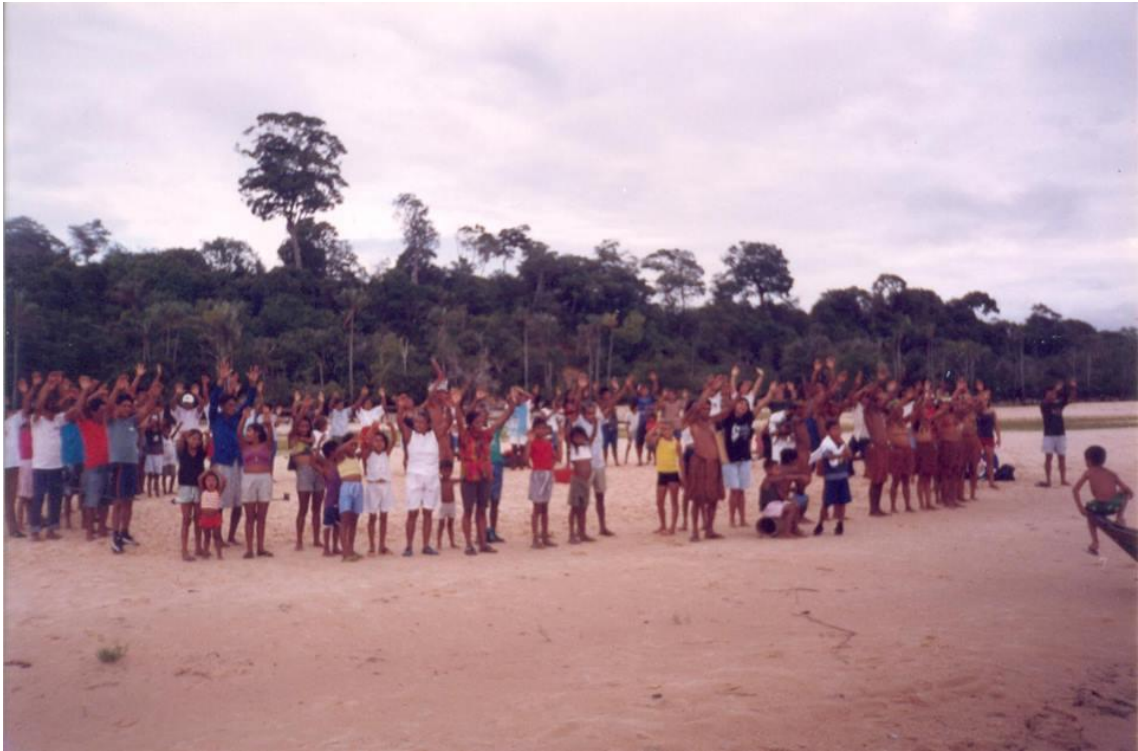
Figura 2: Ritual indígena em frente à praia de Jauarituba, Santarém-PA, 01 de janeiro de 2000.

Nesse processo, entidades e órgãos foram fundamentais no apoio político para o fortalecimento do movimento indígena, como o Conselho Nacional dos Seringueiros (CNS), a Associação Tapajoara da Resex, o Sindicato das Trabalhadoras e Trabalhadores Rurais de Santarém (STTR), líderes do Instituto Brasileiro do Meio Ambiente e dos Recursos Renováveis (IBAMA), Ministério Público Federal (MPF) entre outros. Mas a partir do momento que os interesses começaram a conflitar, houve o que Florêncio Vaz (2010) denominou de o “ grande racha ”.