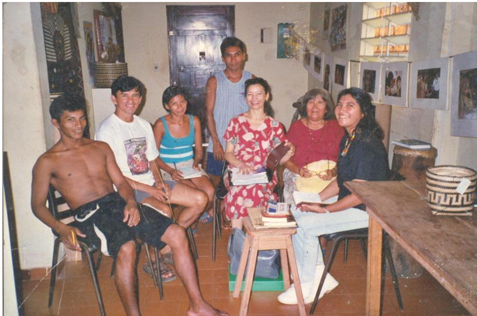
Figura 3 - Escritório do GCI em Santarém-PA, por volta dos anos 2001.

O processo de reorganização política e social dos grupos indígenas no baixo Tapajós envolveu inúmeros atores sociais. Além dos povos indígenas e populações tradicionais, houve agentes externos e entidades engajadas na valorização da cultura, no (re)conhecimento da história, bem como, na mobilização pelos direitos dos povos dessa região.