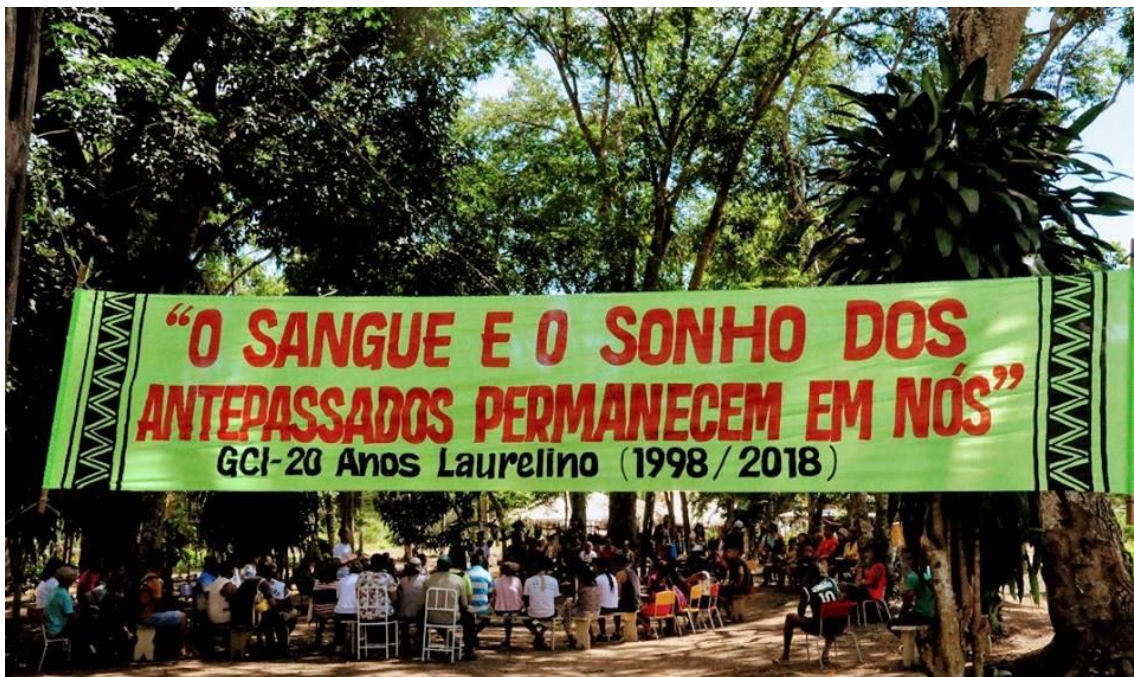
Figura 9 - Assembleia CITA, 2018.