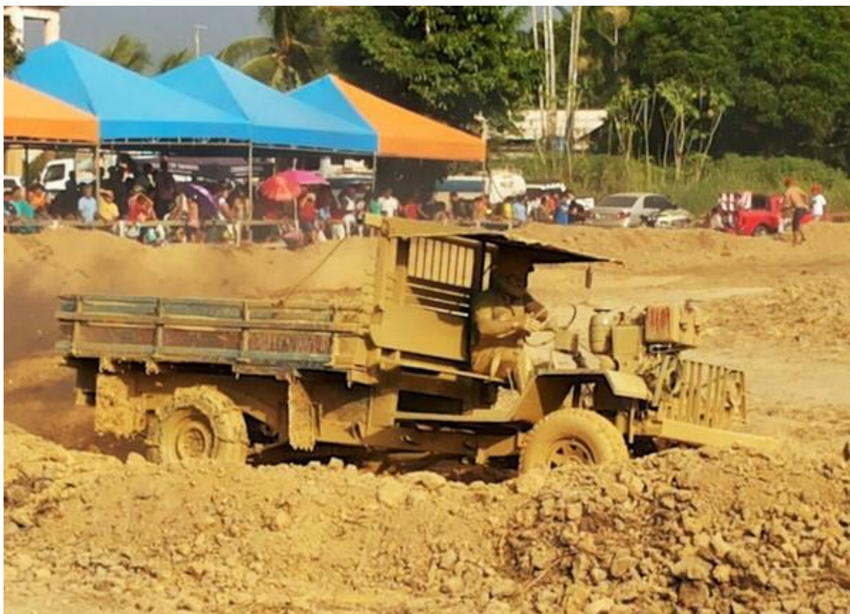
Figura 12: Corrida de fubica no Festival da Tapioca