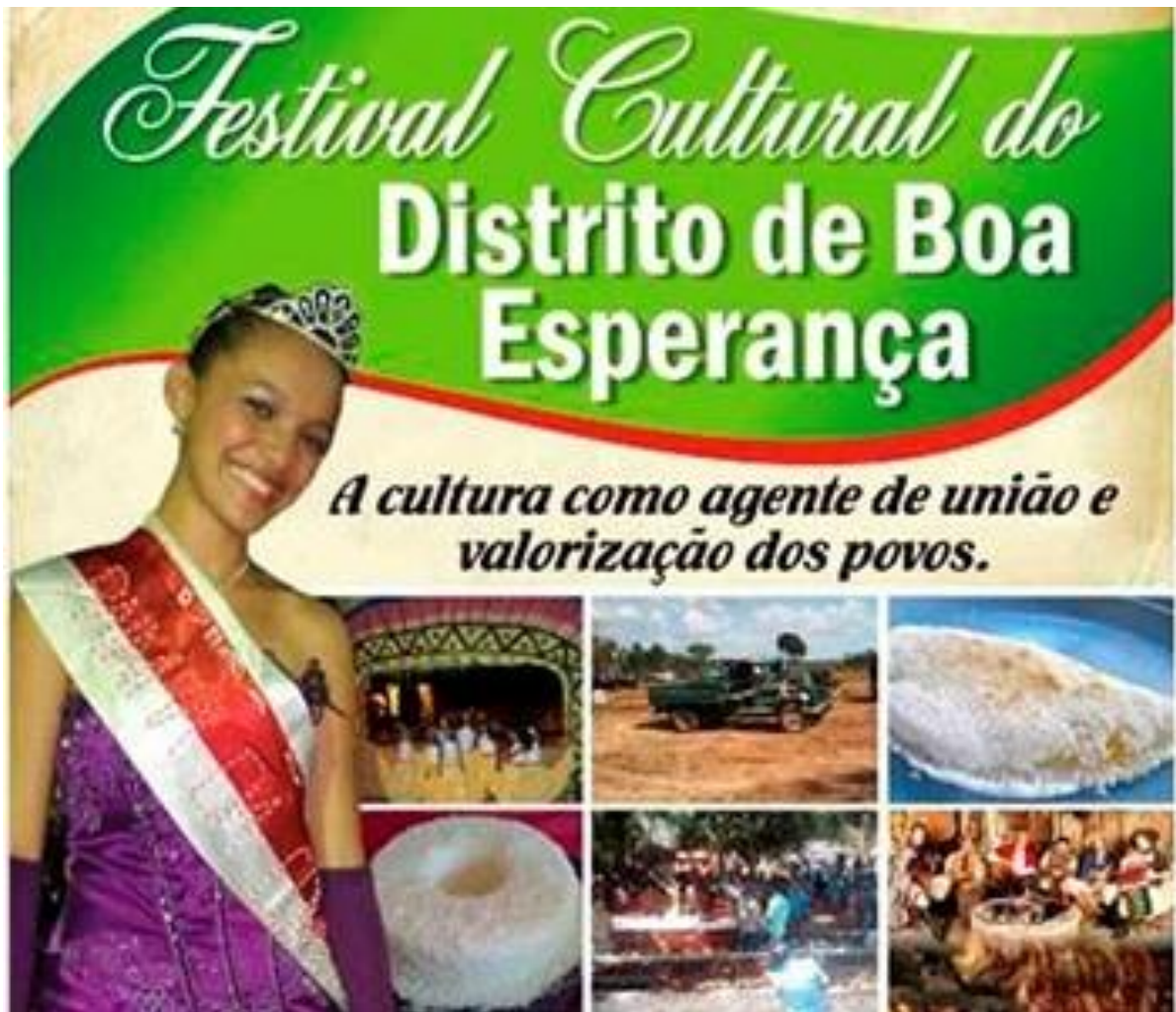
Figura 10: Cartaz de anúncio do 14º Festival da Tapioca

O evento passou a atrair pessoas das comunidades vizinhas, cidade próximas, e conta com diversificada programação envolvendo homens e mulheres. São feitos trajes artesanalmente para o desfile, shows, venda de churrasco, vendas de variedades de comidas típicas produzidas a partir da tapioca, venda de galinha caipira, farinha amarela e a tradicional corrida de fubica (figura 12).