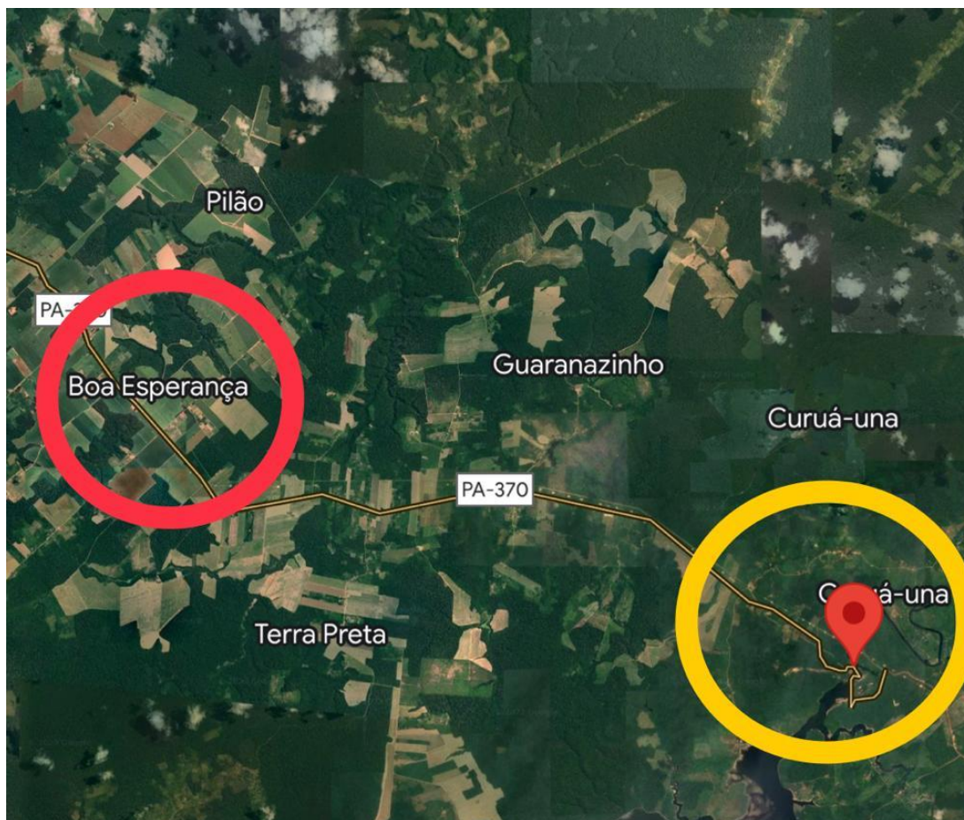
Figura 2: Em destaque a comunidade Boa Esperança a margem da rodovia PA-370