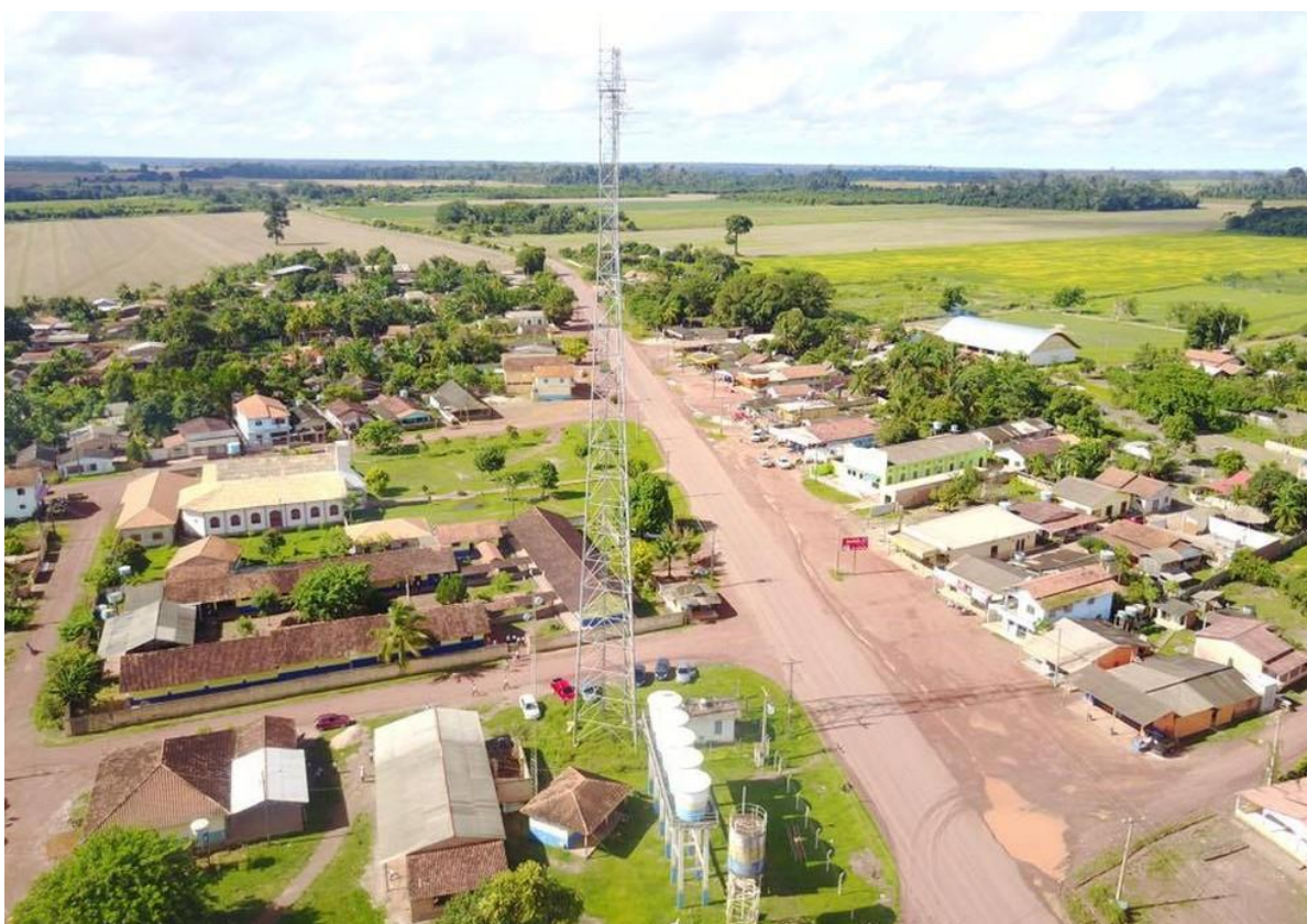
Figura 16: Vista aérea da comunidade Boa Esperança