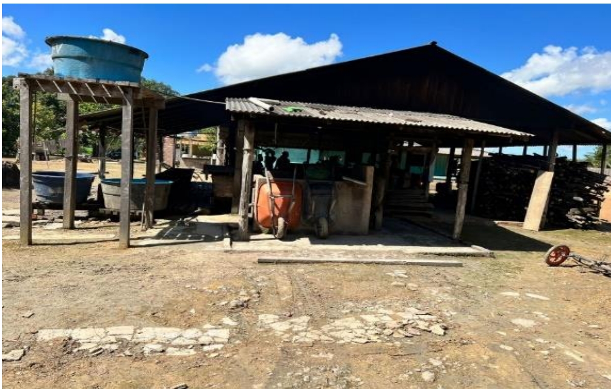
Figura 13: Casa de farinha