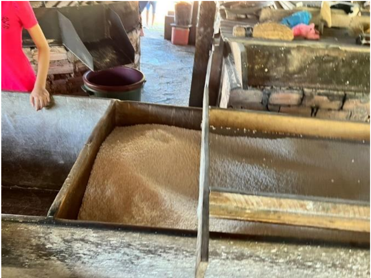
Figura 7: Farinha de tapioca peneirada