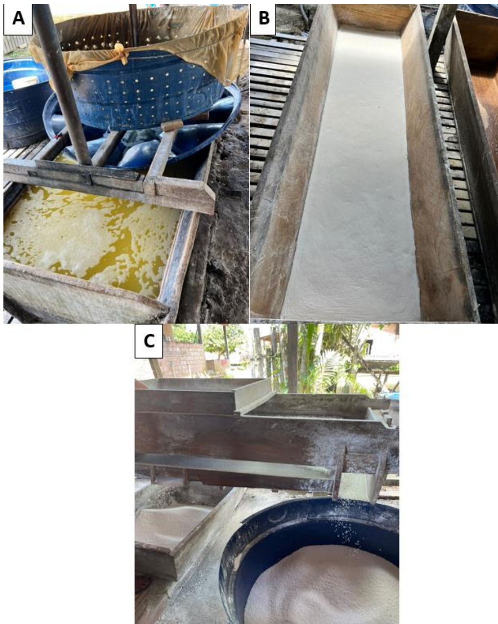
Figura 5: Lavagem da massa para extração do amido