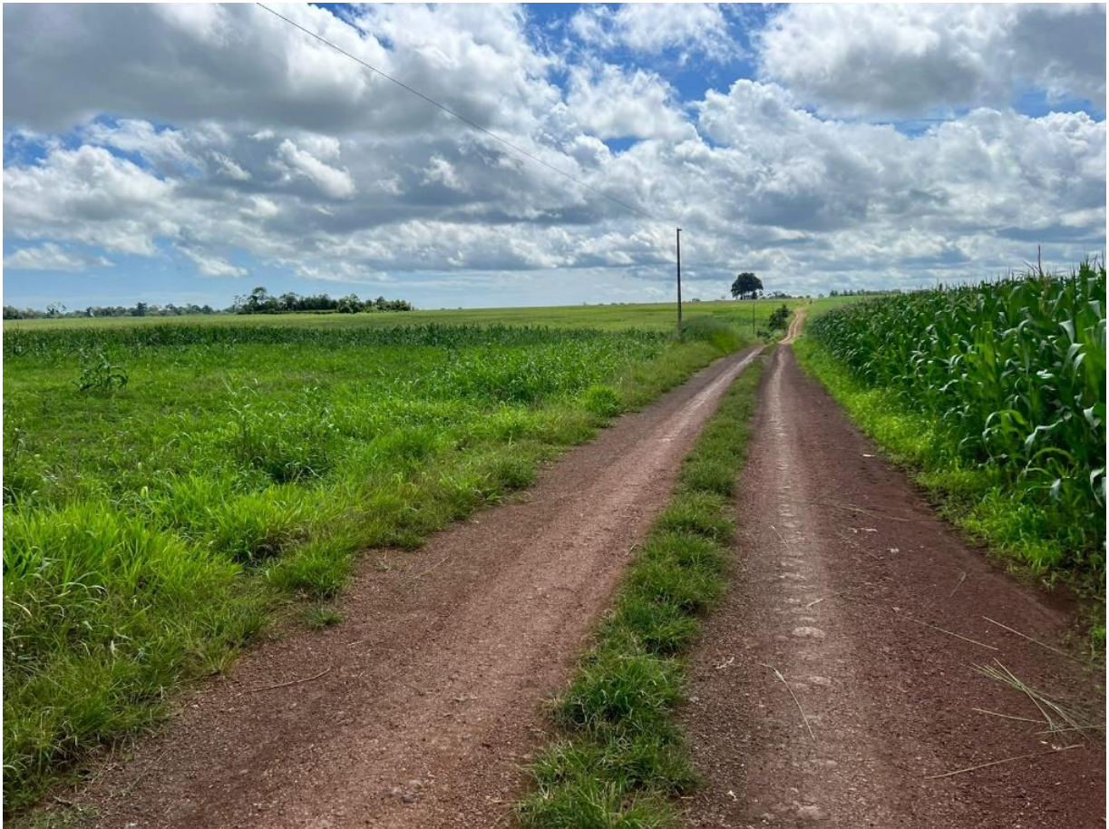
Figura 15: Plantações de soja e milho nos arredores da comunidade Boa Esperança