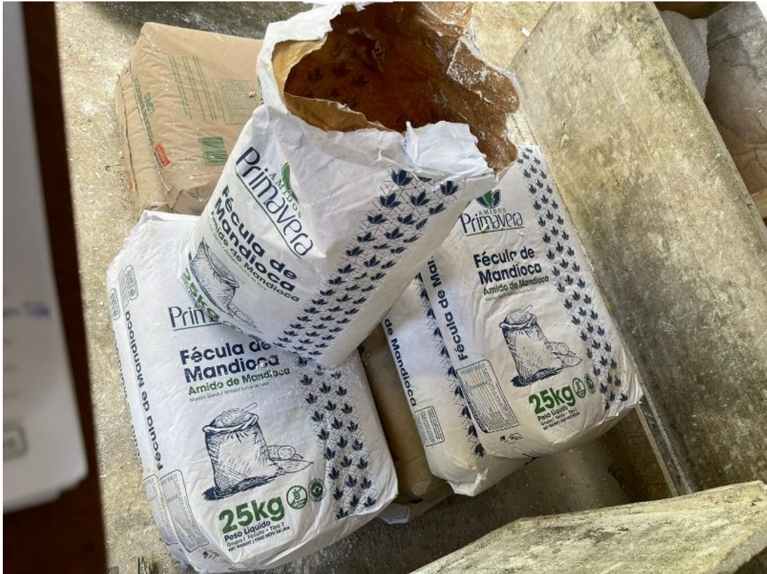
Figura 8: Pacotes de fécula