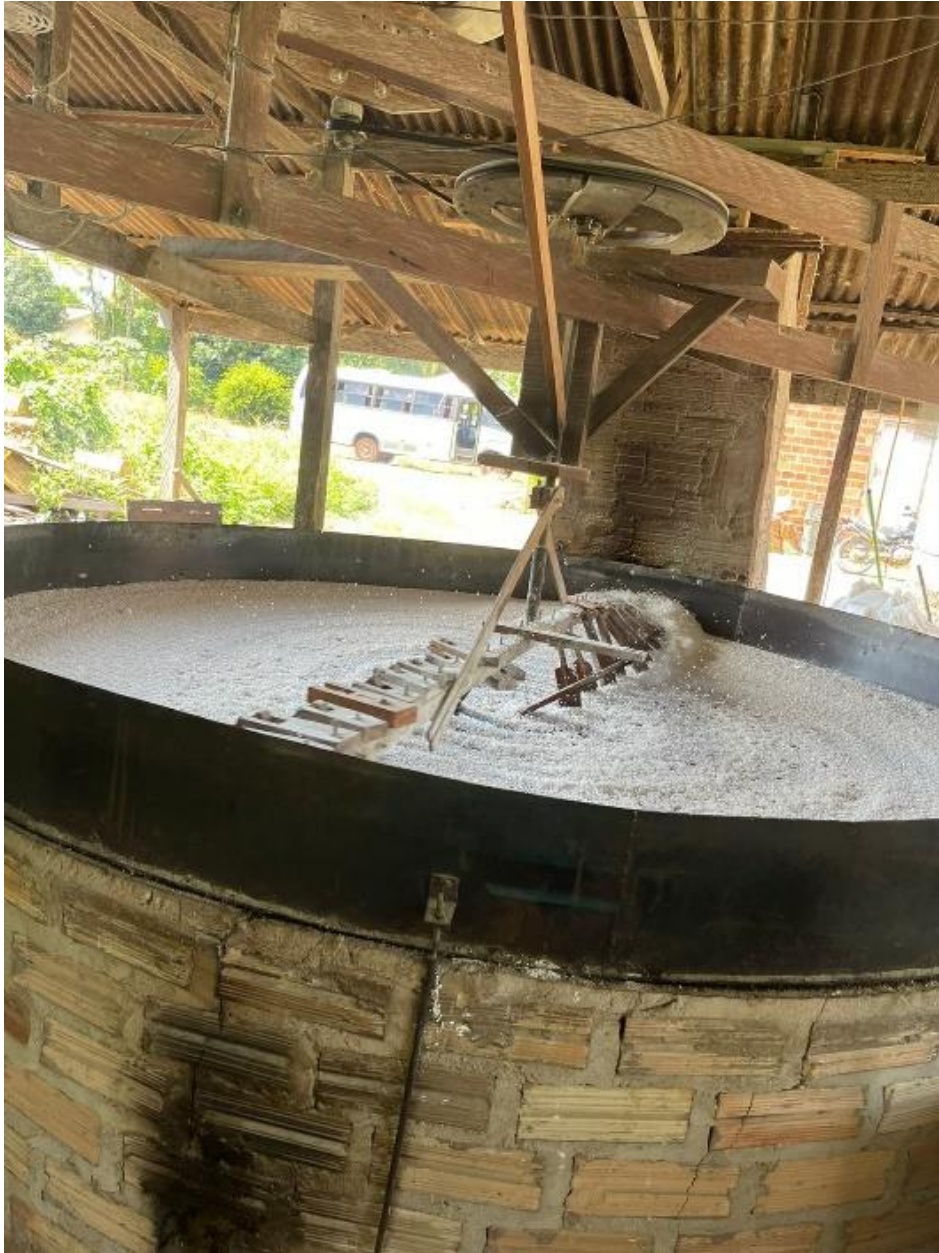
Figura 6: Forno de torrar a tapioca