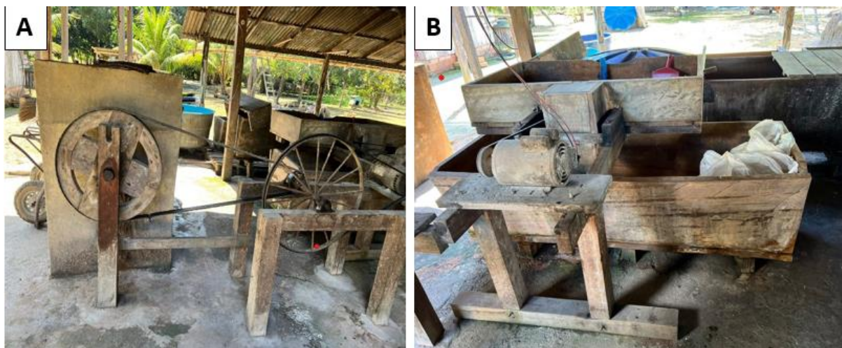
Figura 4: Lavador e triturador de mandioca