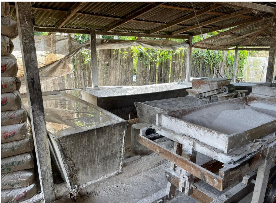
Figura 9: Produção de farinha a partir da fécula