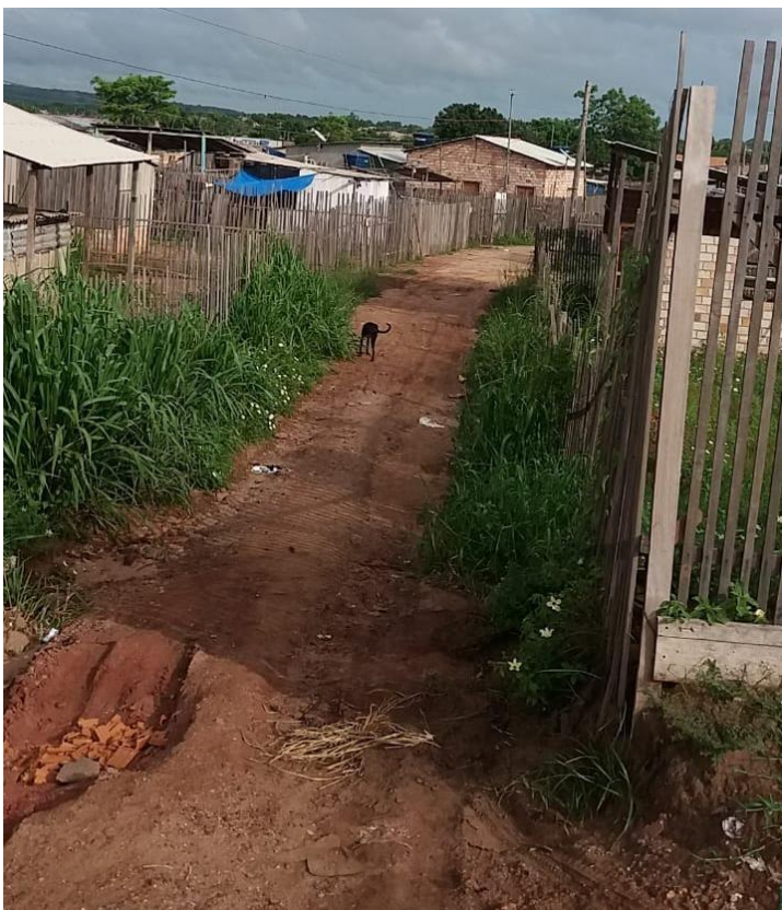
Figura 5: Via acessada por moradores do ocupação do Juá

Ainda segundo Reis (2018), essa área abriga cerca de três mil famílias, com uma constante disputa pelo capital imobiliário e por isso enfrentam dificuldades em consolidar o direito à moradia e minimizar os conflitos fundiários naquela área (figura 5).