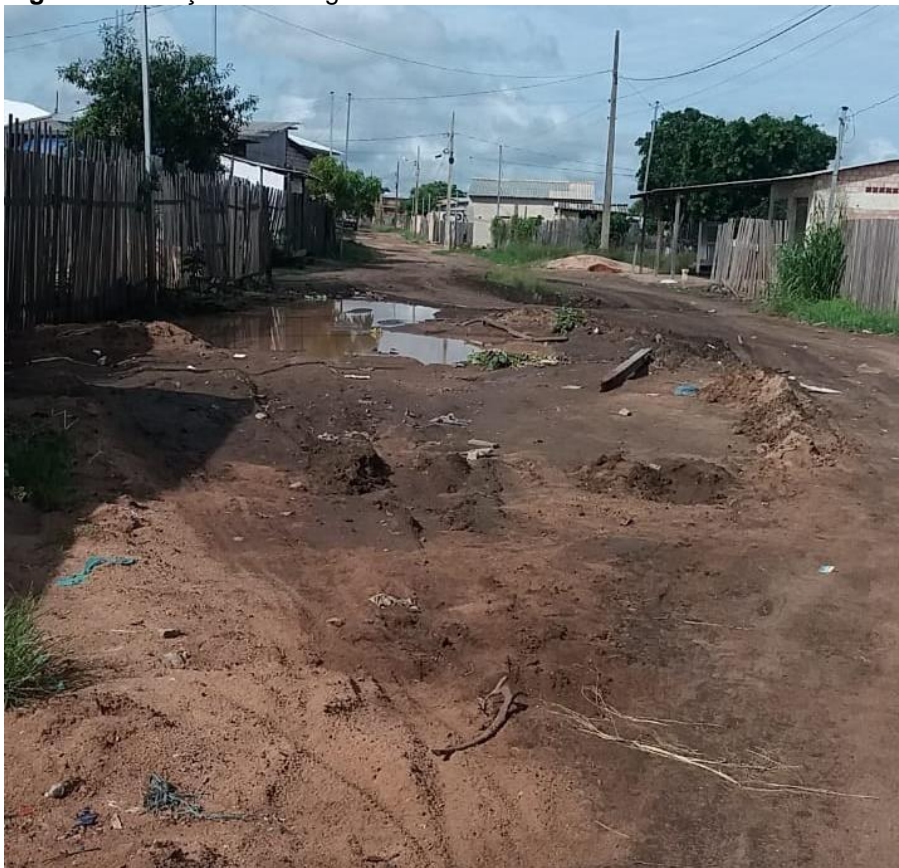
Figura 2: Situação da trafegabilidade de muitas vias da cidade de Santarém/PA

Penha (2018) afirma que no trato dos serviços públicos, Santarém enfrenta inúmeros problemas, principalmente no que tange as demandas de saneamento básico, vias intrafegáveis (figura 2), serviços de saúde, abastecimento de água, esgotamento, lixões a céu aberto entre outros.