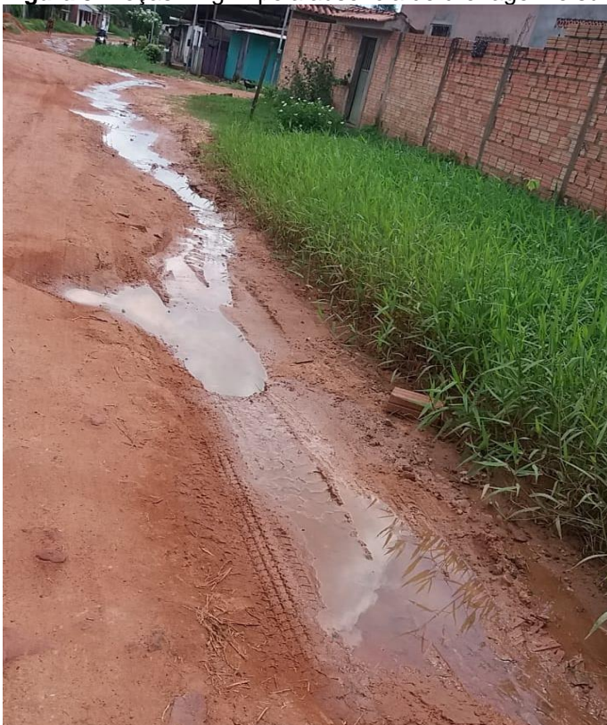
Figura 3: Poças d'água pela ausência de drenagem e sumidouros.

Furtado (2017) destaca ainda um grande efeito do desmatamento, que com a retirada da vegetação o processo de drenagem natural não ocorre devidamente, desencadeando outros problemas como, aumento o processo erosivo das áreas e a incidência de inundações, o que promove a na necessidade da oferta de serviços de saneamento como drenagem e manejo de águas pluviais (Figura 3).