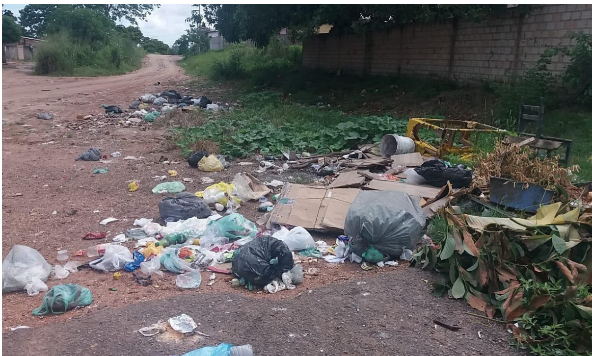
Figura 4: Resíduos sólidos lançados a céu aberto nas ruas

Um outro grande problema de impactos socioambientais é o lixo produzido pela sociedade, esse lixo trata-se do que é armazenado de forma inadequada ou colocado fora do horário do carro de coleta (figura 4), pois quando ocorre uma ação de um fenômeno da natureza que como as chuvas, esse lixo é levado até os esgotos onde a maioria das vezes entope e causa danos ainda maiores para a sociedade, a exemplo da contaminação das águas e dos rios, igarapés e dos animais e peixes.