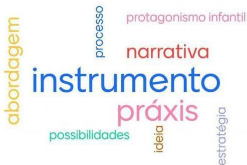
Figura 1 - Conceito de Documentação Pedagógica

A nuvem de palavras a seguir evidencia os termos de maior repetição.