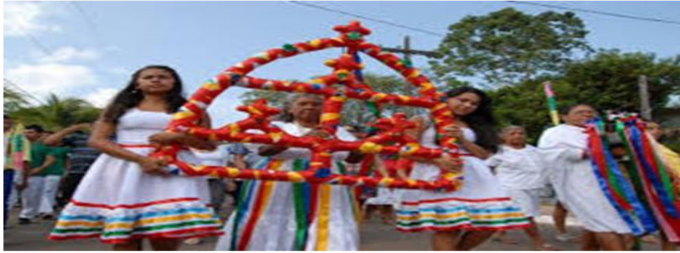
Figura 07 - Símbolo do Sairé – Festa do Sairé 2017

Conforme vemos na foto, o Sairé é um escudo, em forma de semi-círculo, confeccionado de cipó, a que primitivamente chamava-se também de “Turyua”. Sua composição e decoração multicolorida variam de lugar para lugar, porém a forma básica é encontrada em todos os locais onde foi introduzida a dança característica, claramente uma mistura dos valores culturais indígenas com as exigências do colonizador luso, cristão.