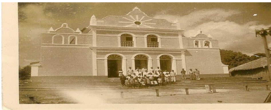
Figura 02 – 3ª Igreja de Nossa Senhora da Saúde, 1896.

A herança que os colonizadores religiosos deixaram para a Vila de Alter do Chão foram muitas, a partir da arquitetura provinciana com a construção da igreja de Nossa Senhora da Saúde, algumas casas e a Praça do Coreto. Assim como alguns costumes na culinária e no vestuário.