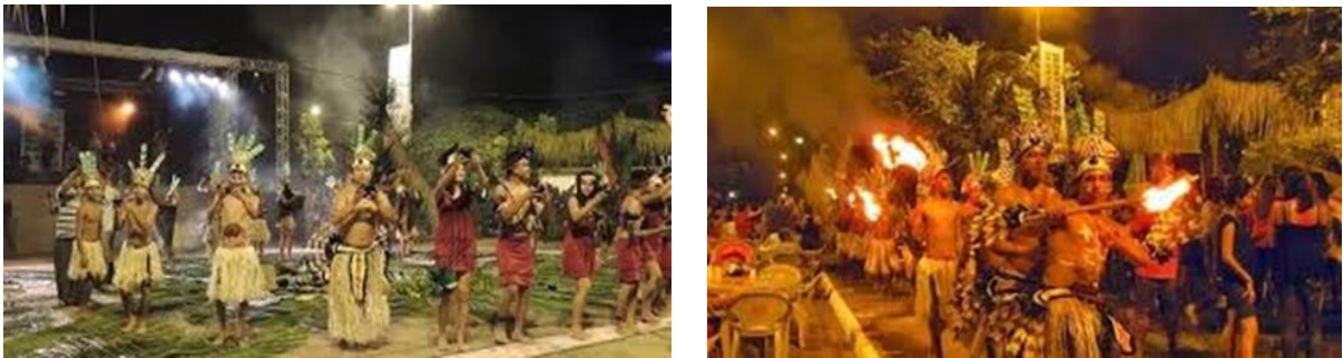
Figura 04 e 05 – Ritual Indígena em Alter do Chão -Sairé 2017 – Fonte:folhadoprogresso.com.br

No ritual os indígenas deixaram claro que eles não estão procurando conflitos, mas sim, respeito a sua etnia e aos seus direitos como donos das terras de Alter do Chão e tentaram chamar a atenção de todos para que as autoridades presentes se sensibilizassem sobre a necessidade de preservação de uma história e cultura que fazem parte da história de todos os que habitam essas terras.