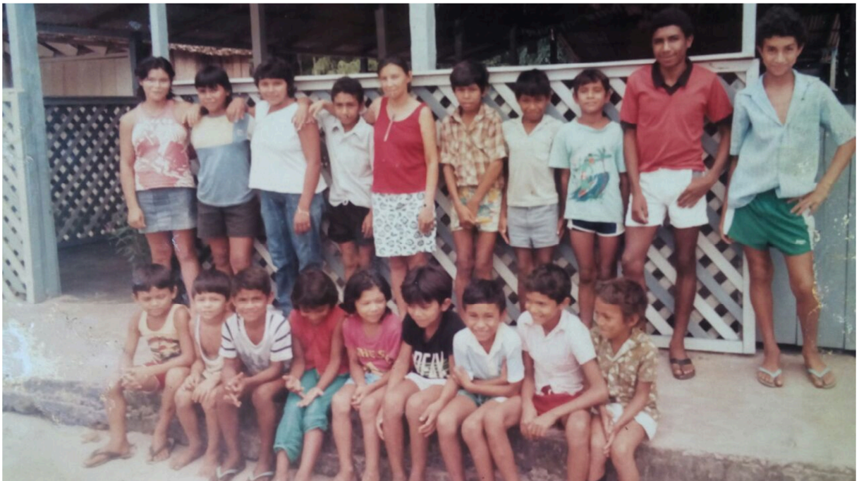
Primeiras famílias

A história da comunidade de Santa Maria tem seu início no ano de 1974, quando quatro famílias oriundas de várzea, mais precisamente da comunidade de Urucurituba, depois de muito sofrimento com as enchentes do rio resolvem procurar um lugar para terem melhores dias de vida. Sua origem é resultado de um processo de ocupação iniciado por ribeirinhos que