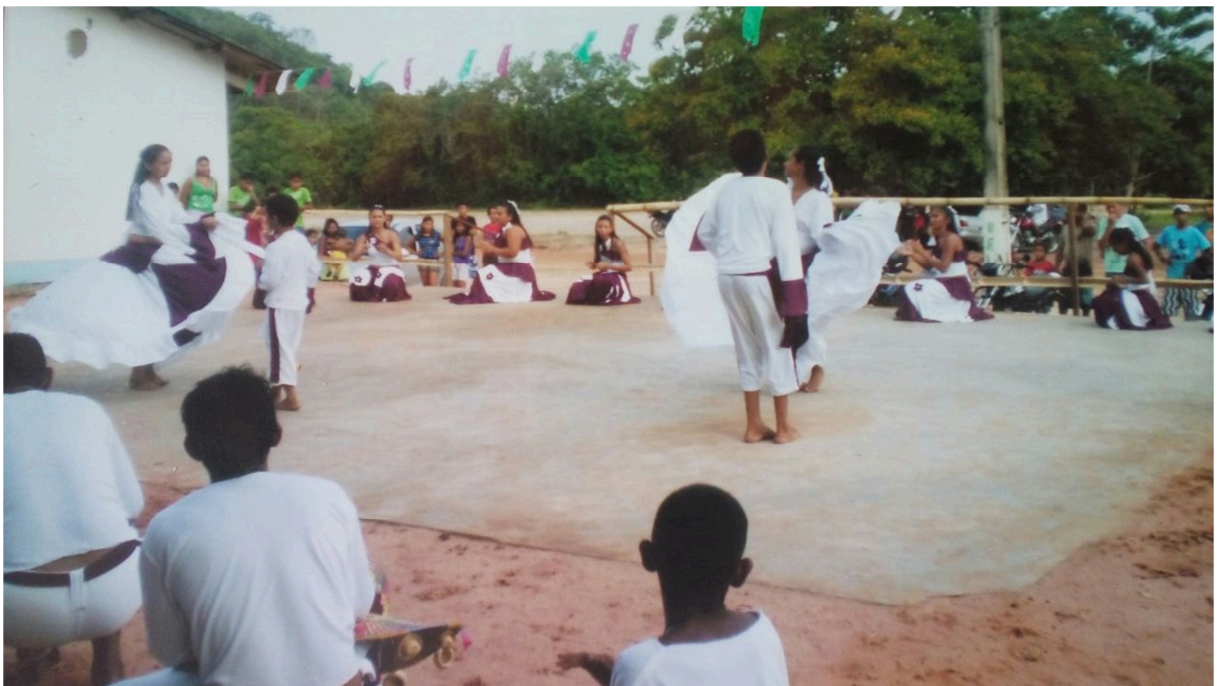
Festival Cupuçai 2009.