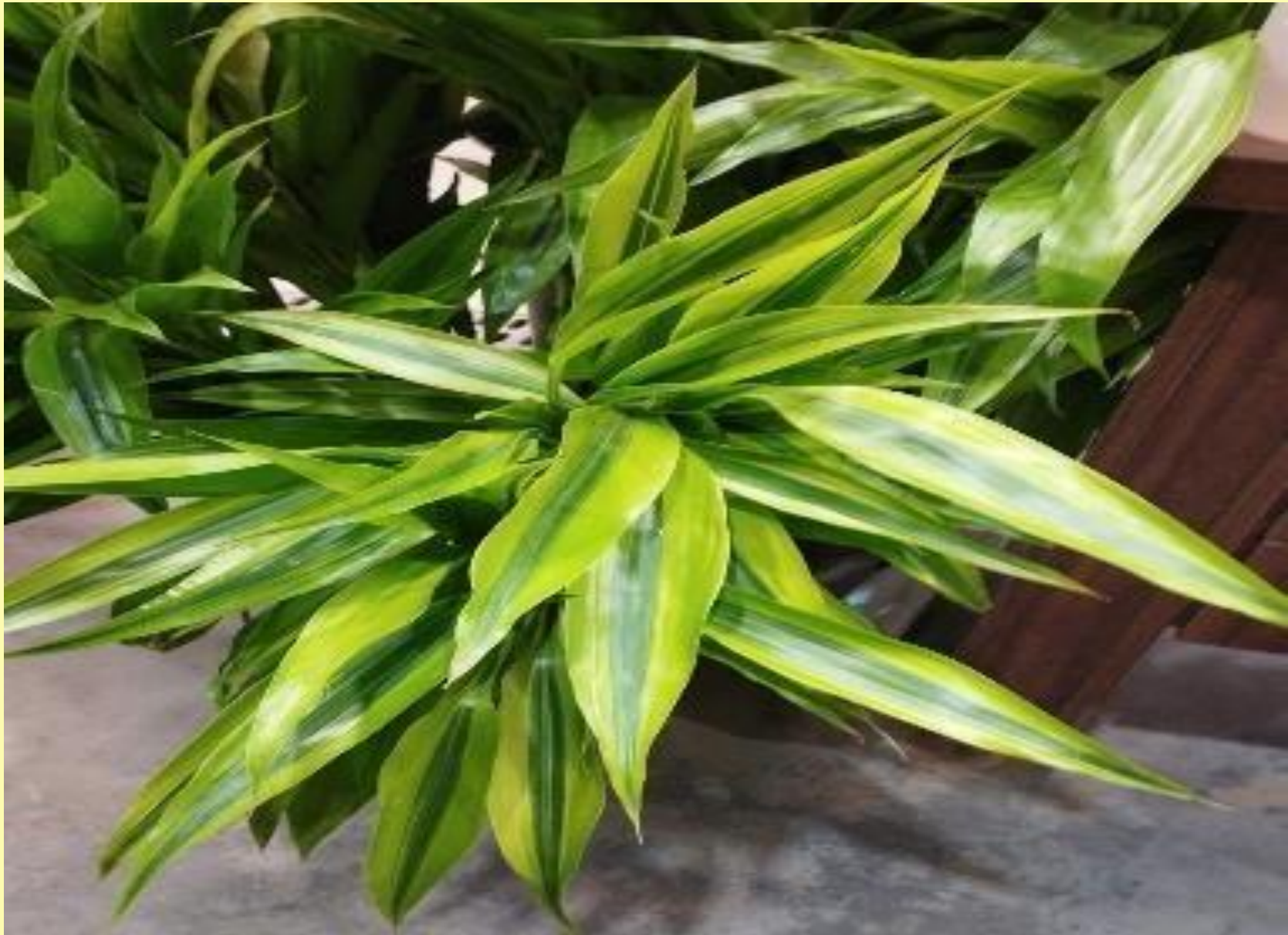
Bambu da Sorte Dracaena sanderiana Sander