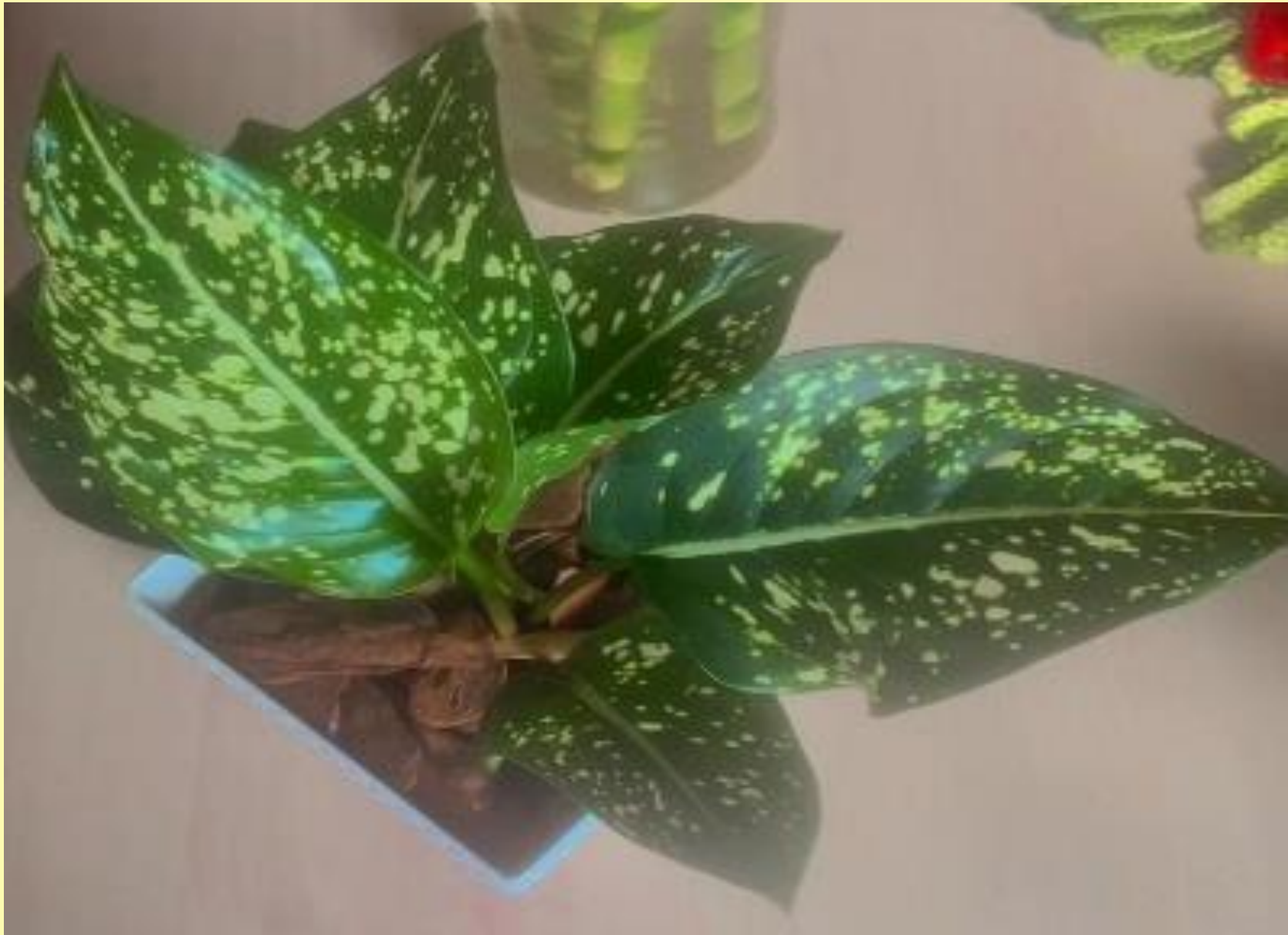
Aglaonema Pintada Aglaonema commutatum Schott