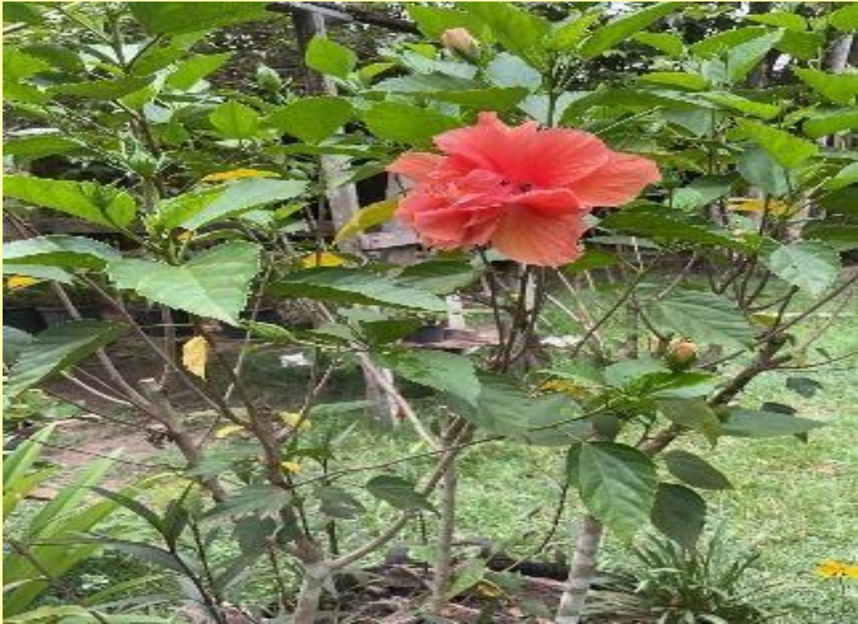
Hibisco Laranja Hibiscus rosa-sinensis L.