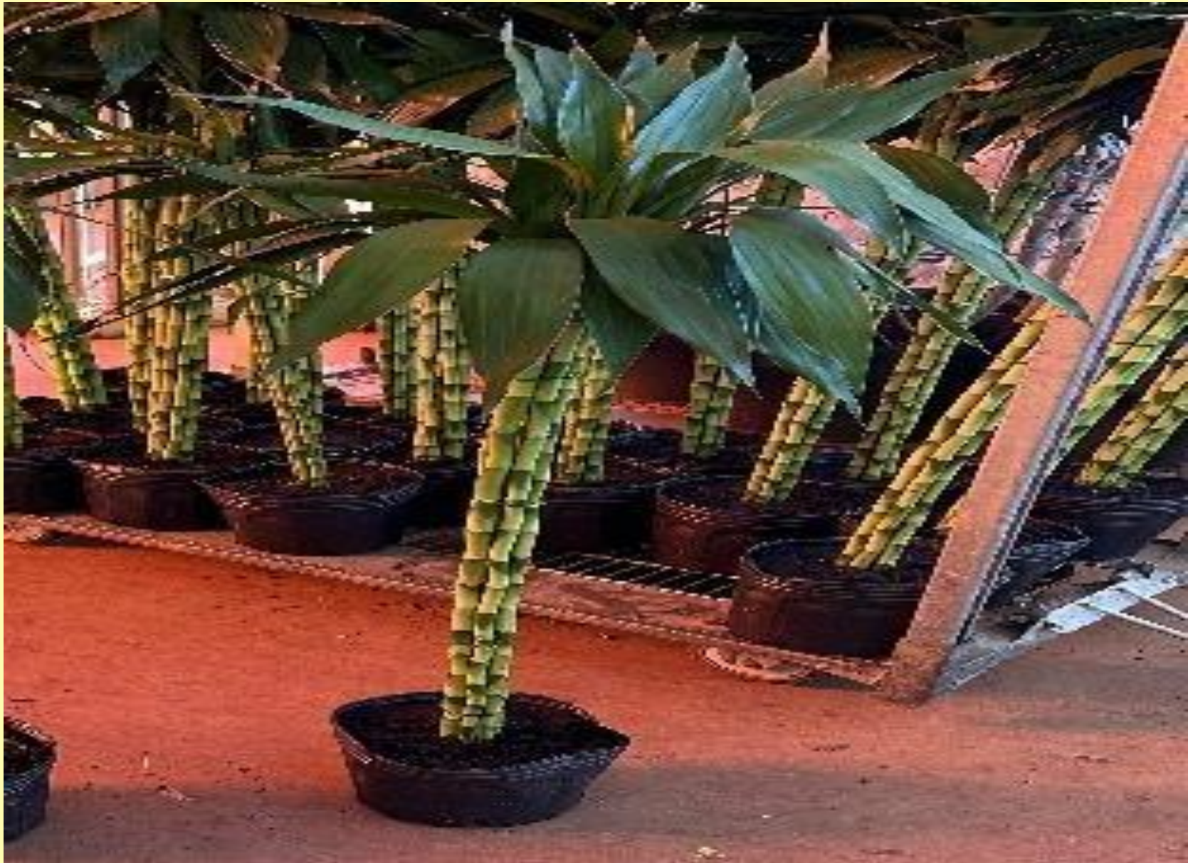
Bambu Canela Dracaena fragrans (L.) Ker Gawl.