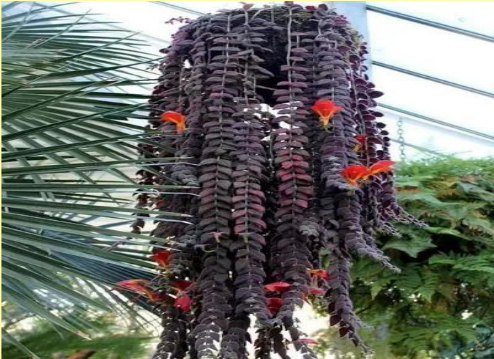
Columéia Batom Columnea microcalyx Hanst.