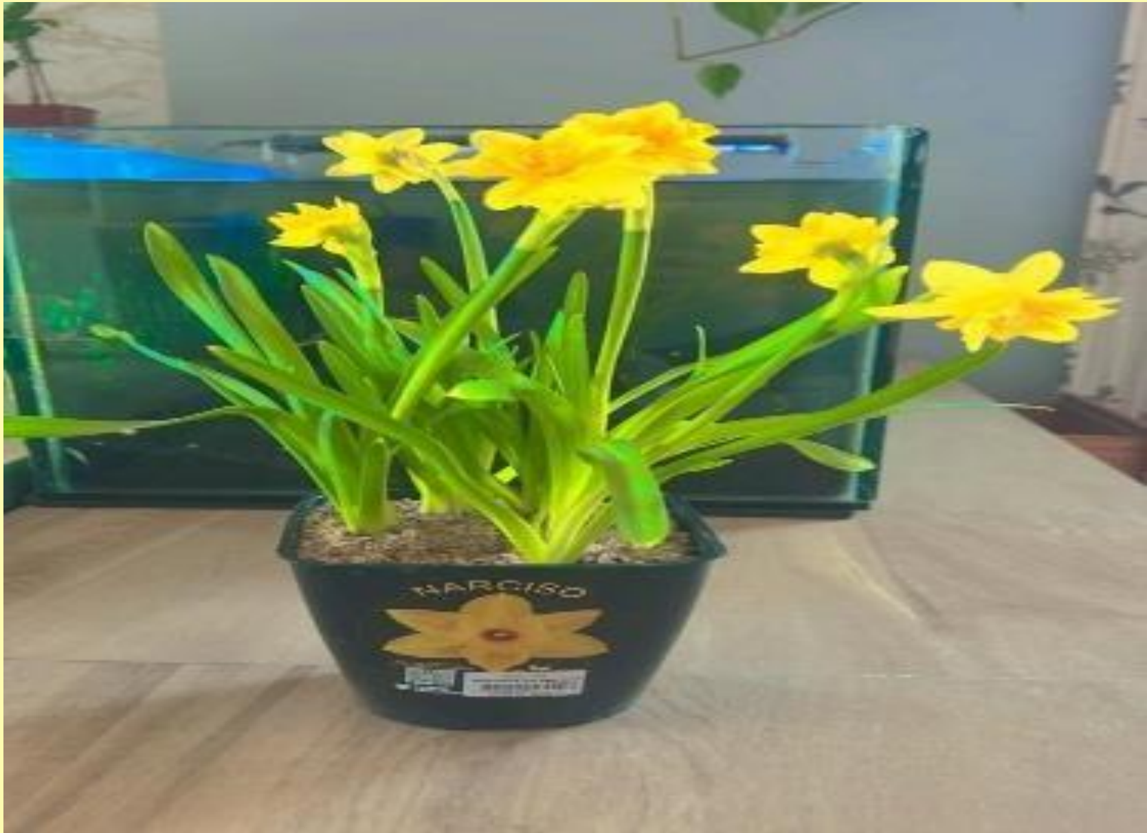
Narciso Narcissus spp.