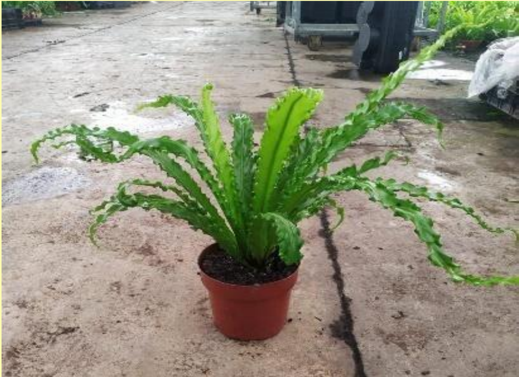
Asplênio Asplenium nidus L.