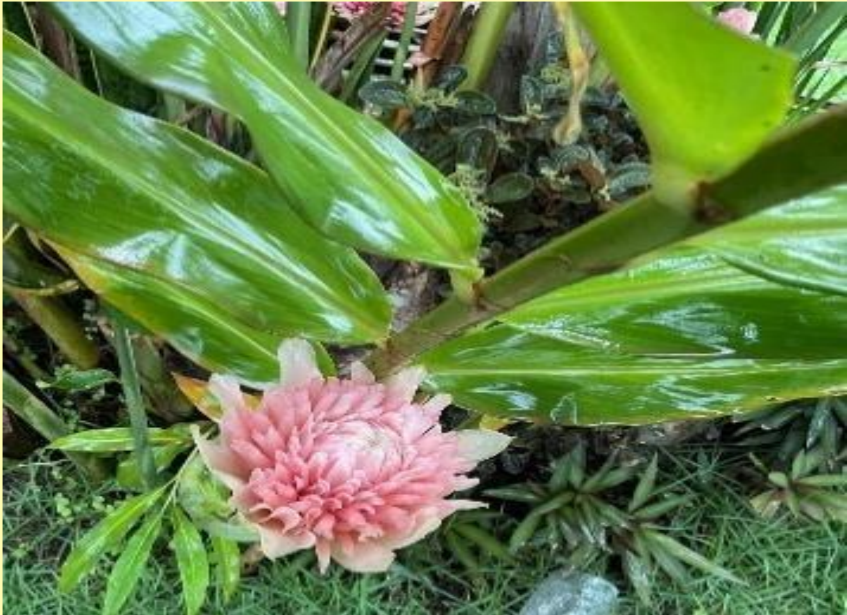
Bastão do Imperador Etilingera elatior (Jack) R.M.Sm.