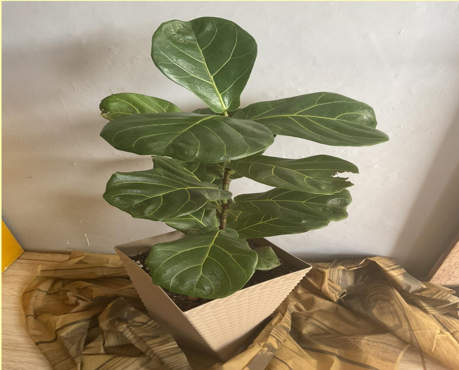
Ficus Lyrata Ficus lyrata Warb.