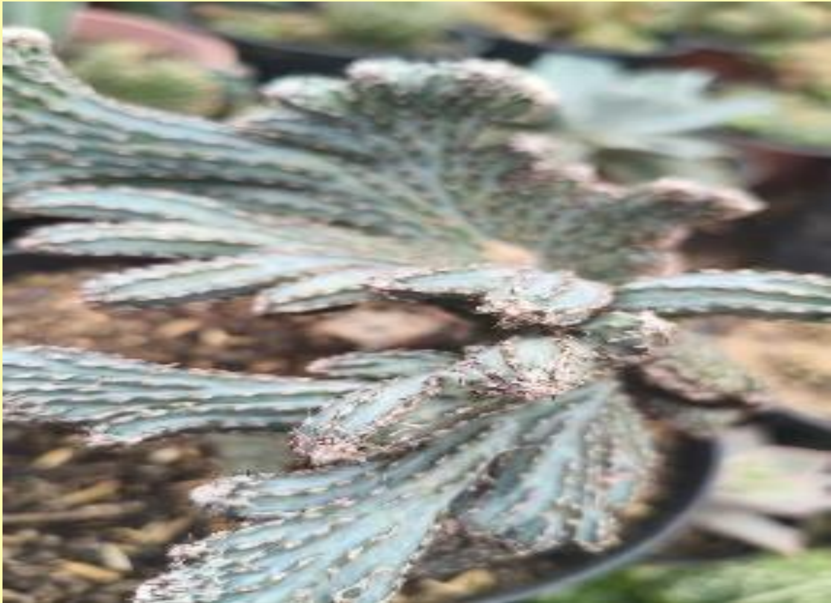
Cacto Rabo de Sereia Epiphyllum anguliger (Lem.) G. Don