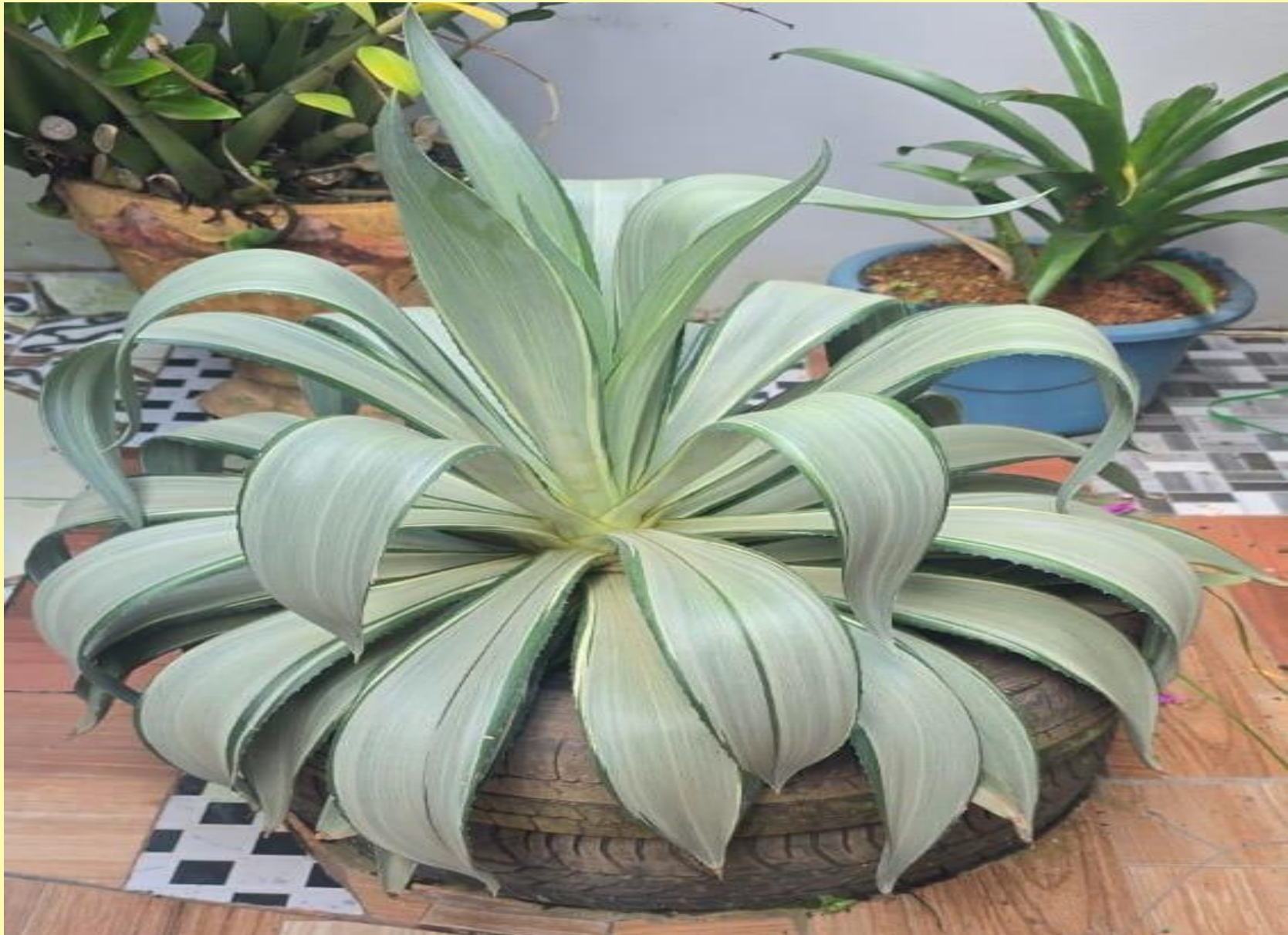
Agave Dragão Agave attenuata Salm-Dyck