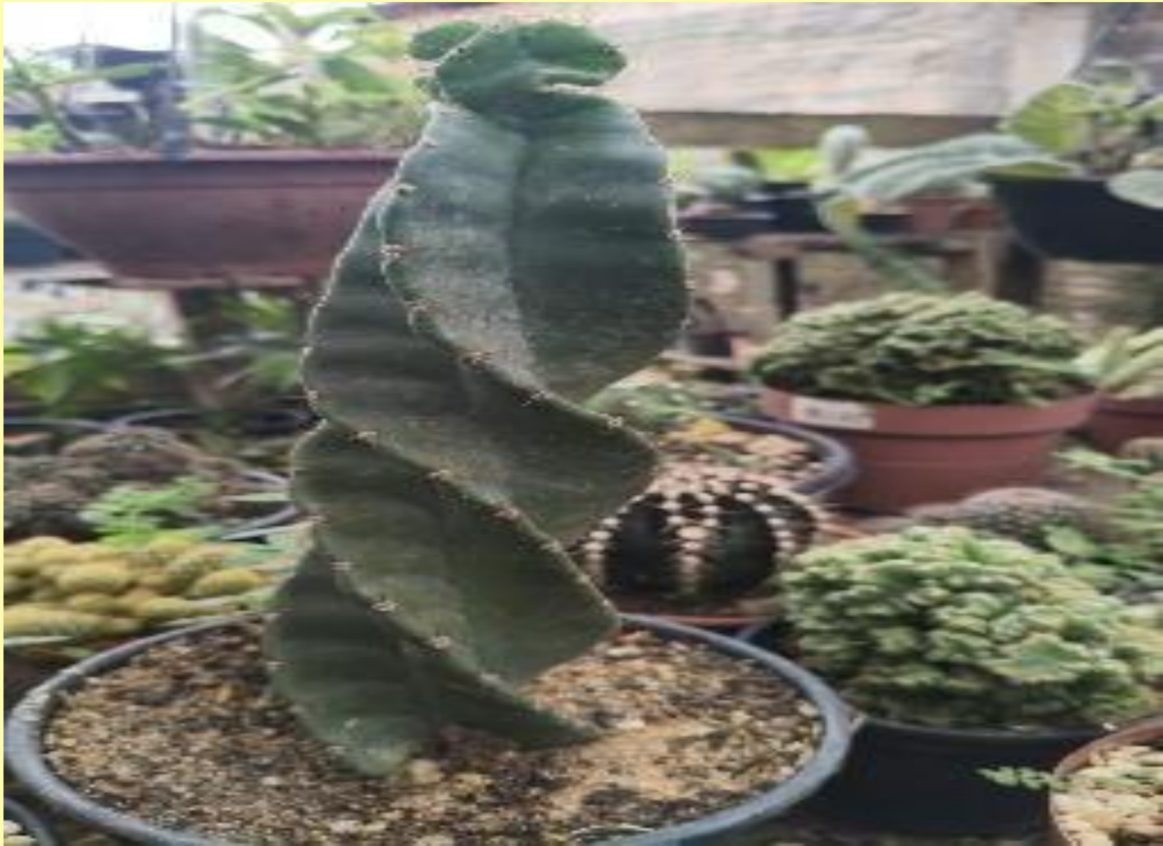
Cacto Parafuso Cereus forbesii C.F.Först.