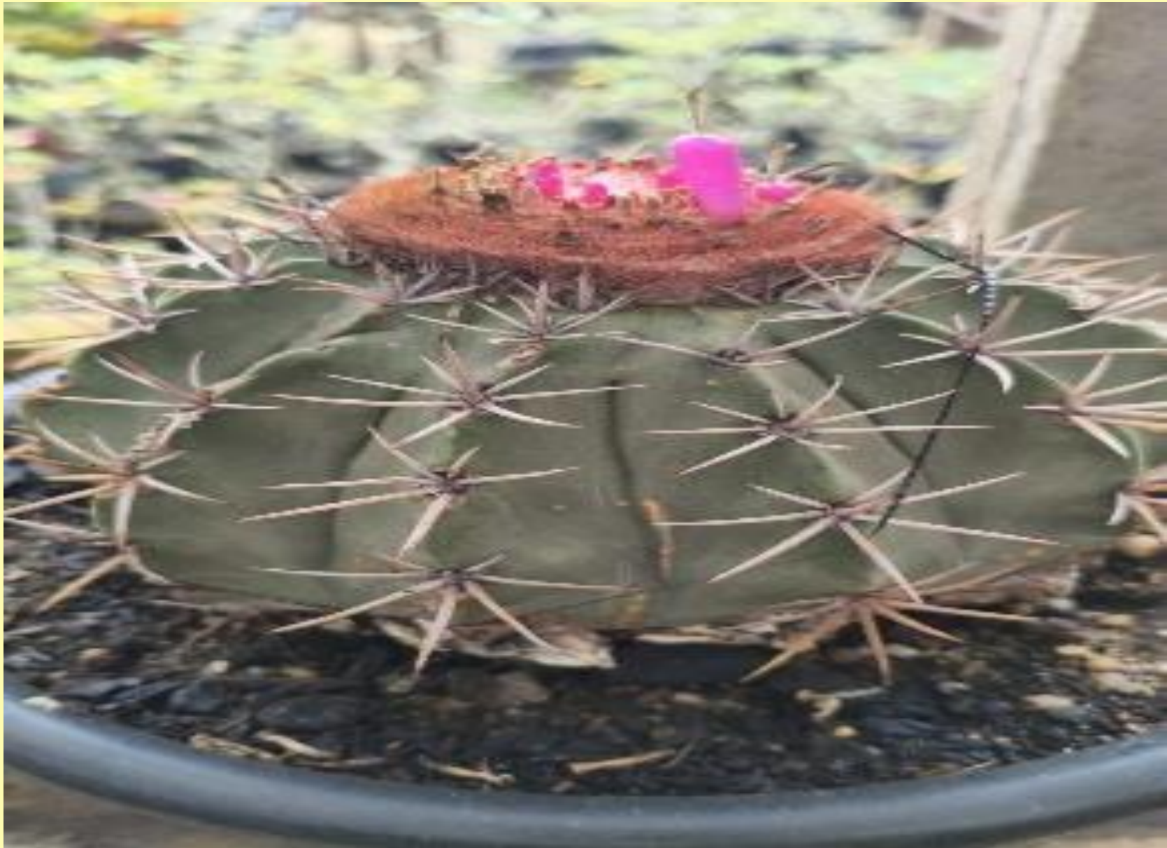
Cacto Coroa de Frade Melocactus bahiensis (Brongn.) Lem.