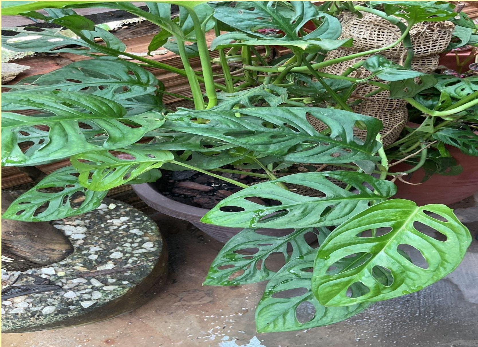
Jiboia Monstera Monstera adansonii Schott