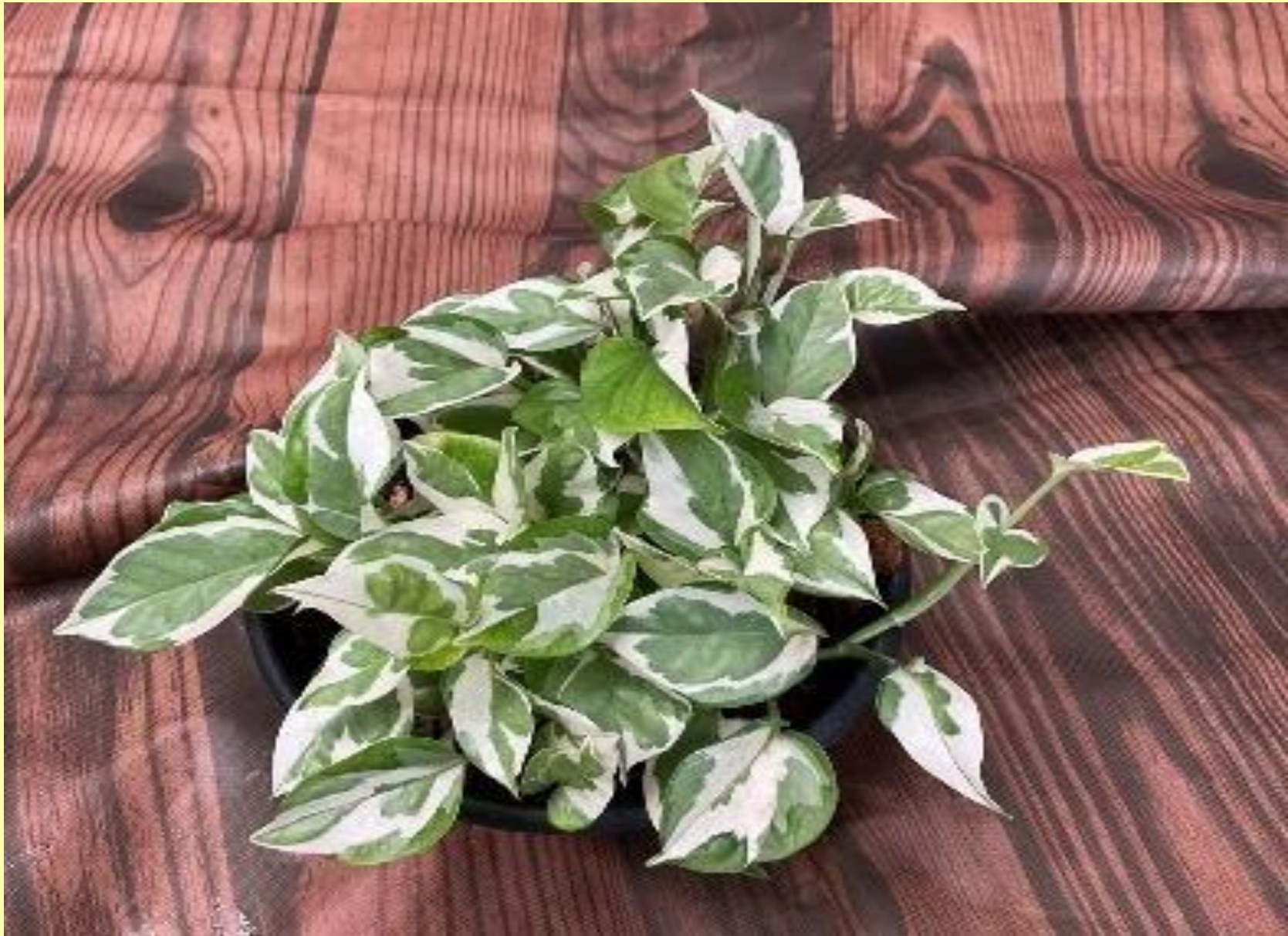
Jiboia Njoy Epipremnum aureum 'N'Joy'