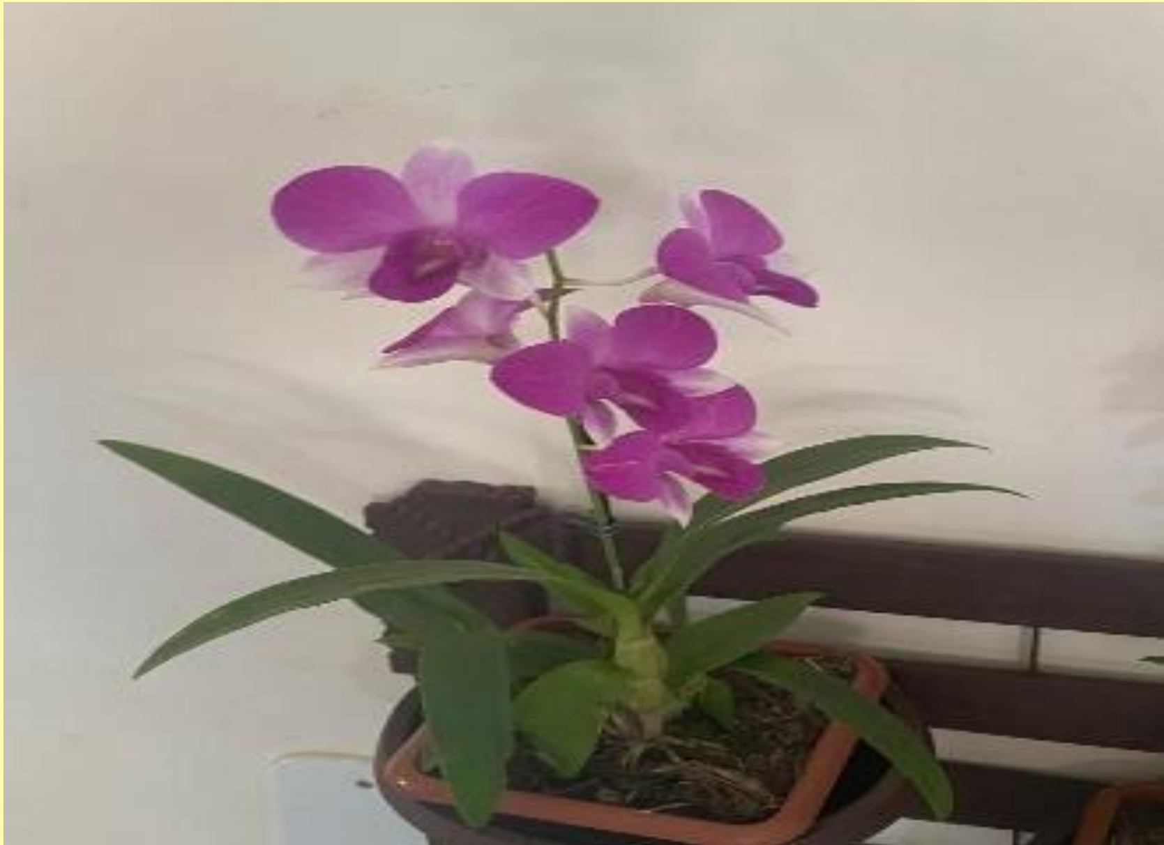
Orquidea Denphal Dendrobium bigibbum Lindl.