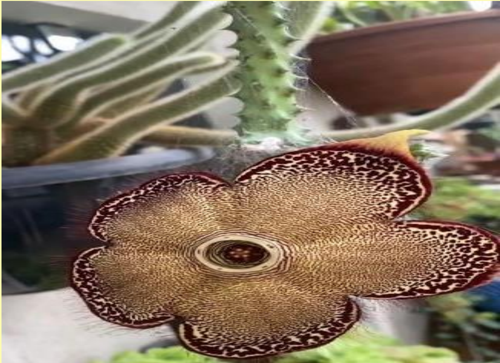
Tapete Persa Edithcolea grandis N.E.Br.