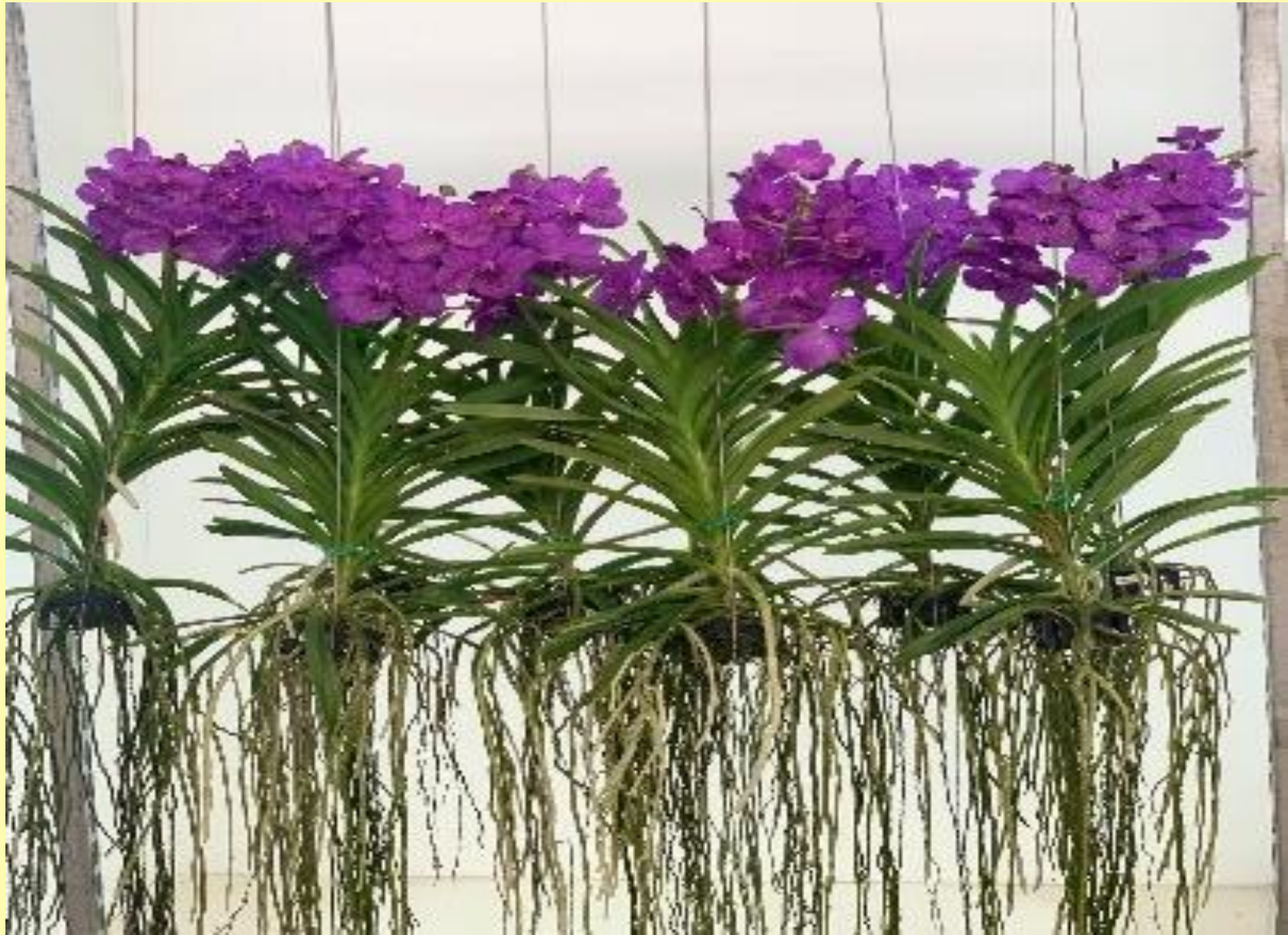
Orquidia Vanda Vanda spp.