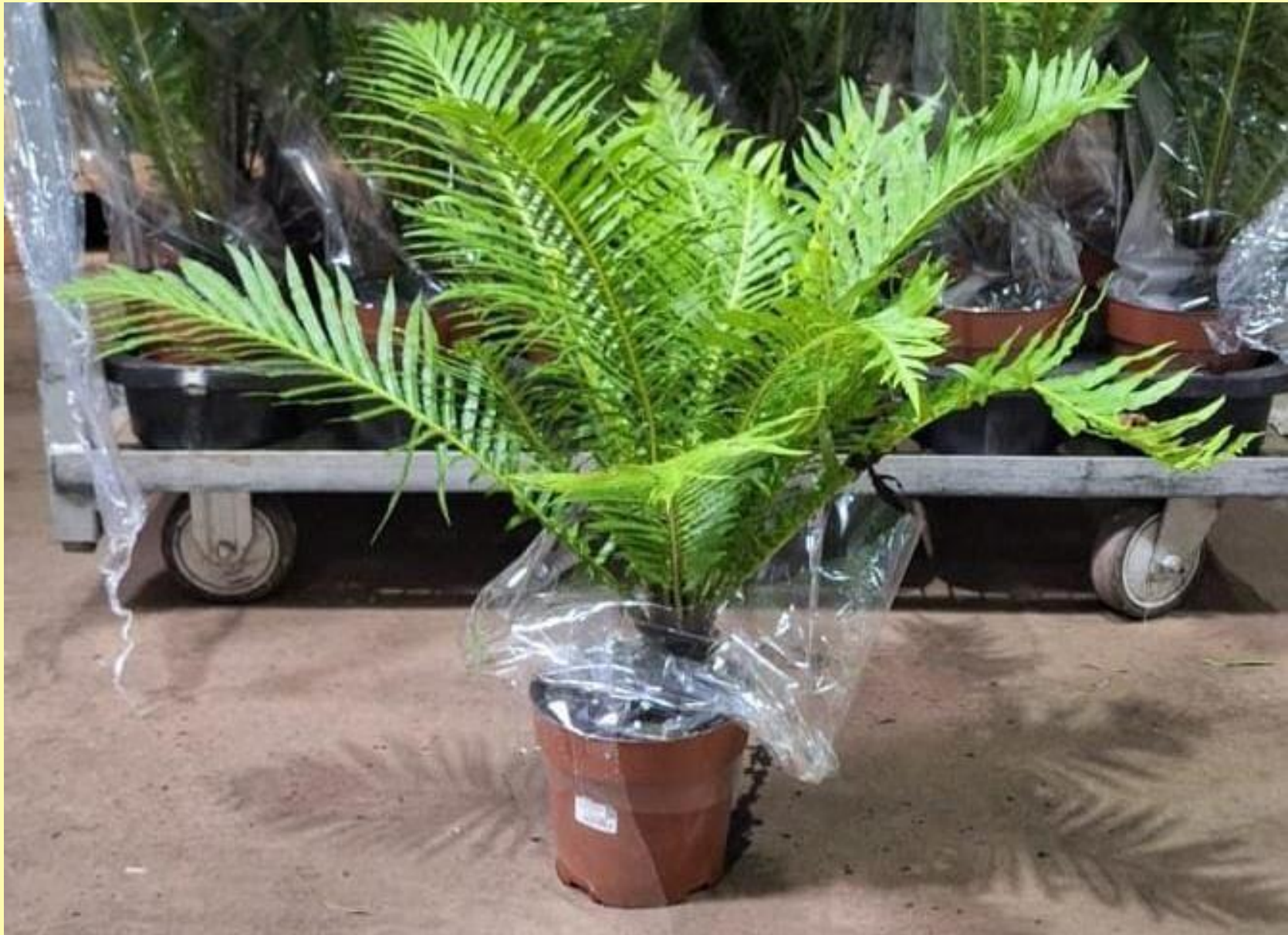
Samambaia Silver Lady Blechnum gibbum (Labill.) C.Presl 'Silver Lady'