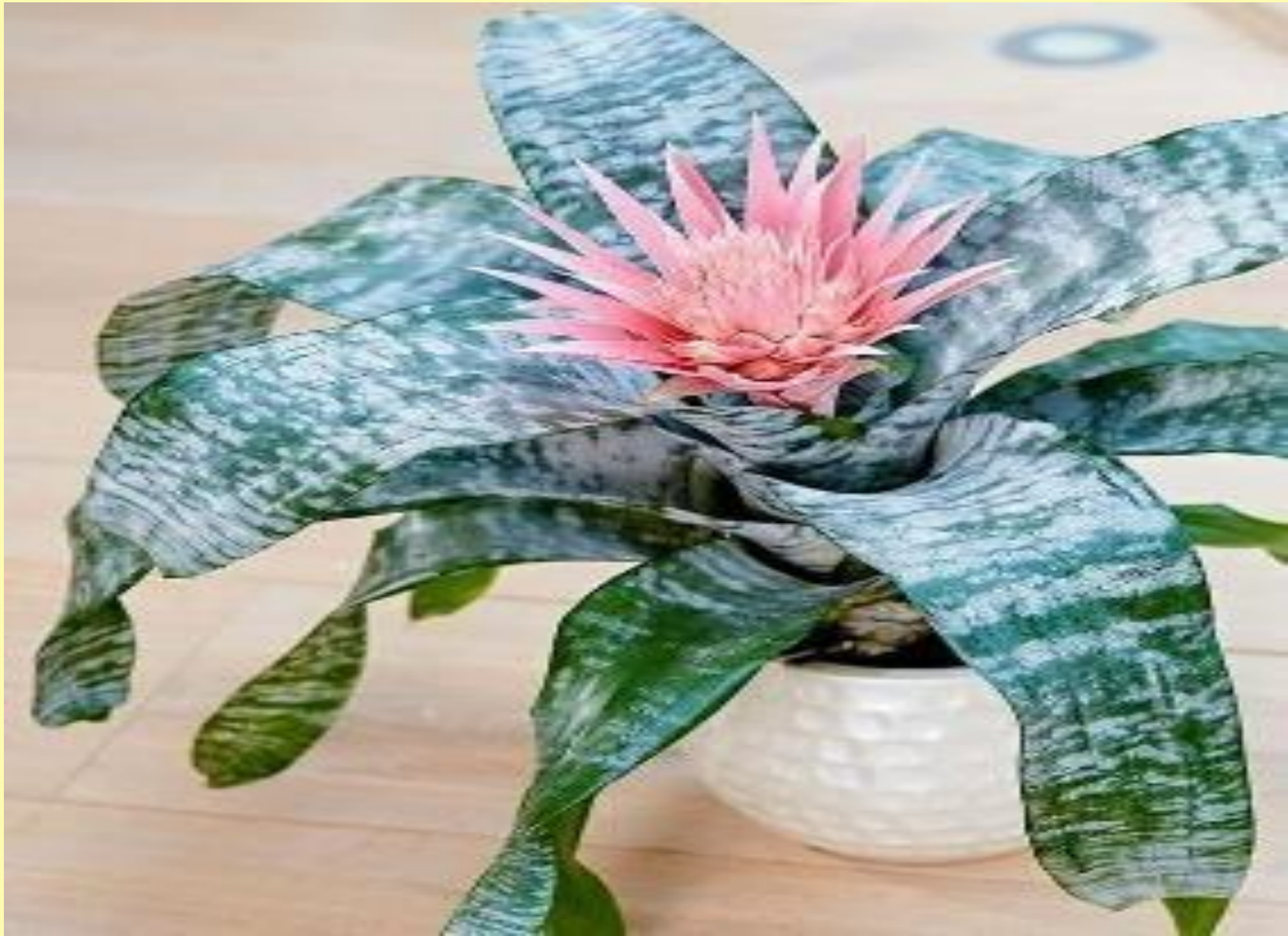
Bromelia Alquimea Aechmea fasciata (Lindl.) Baker