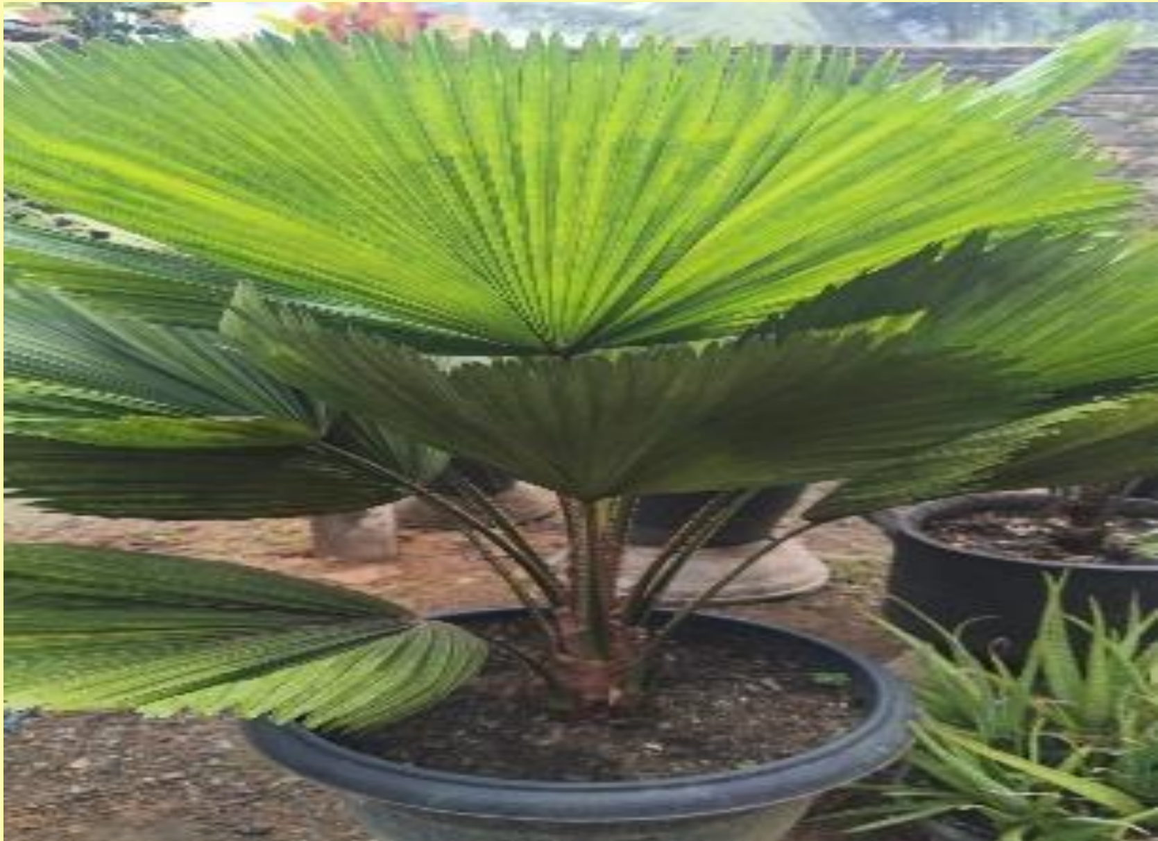
Palmeira Leque Licuala grandis H.Wendl.