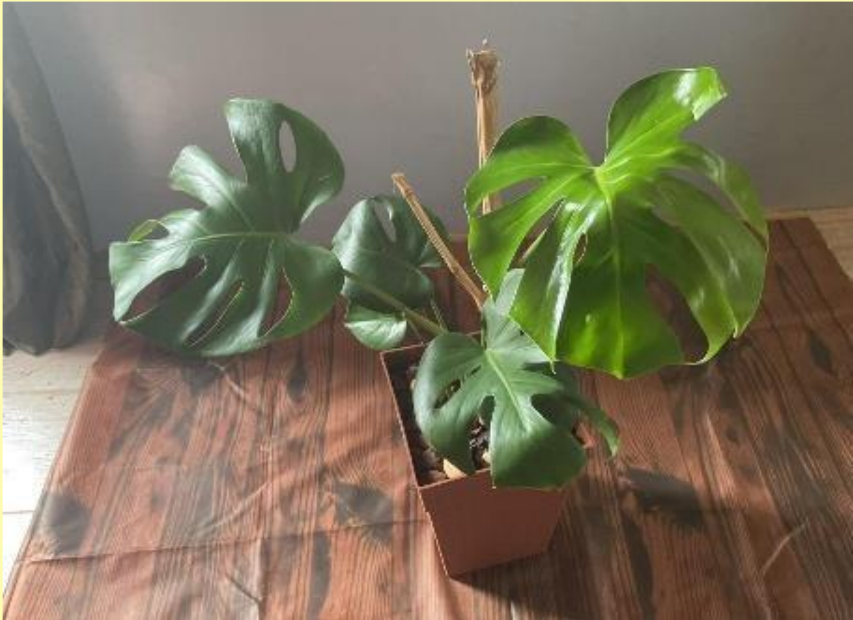
Costela de Adão Monstera deliciosa Liebm.