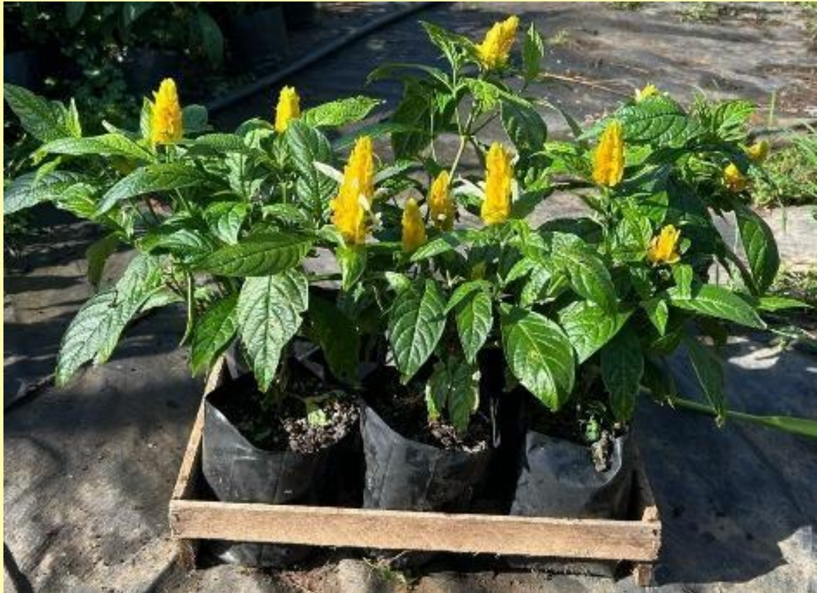
Camarão Amarelo Pachystachys lutea Nees