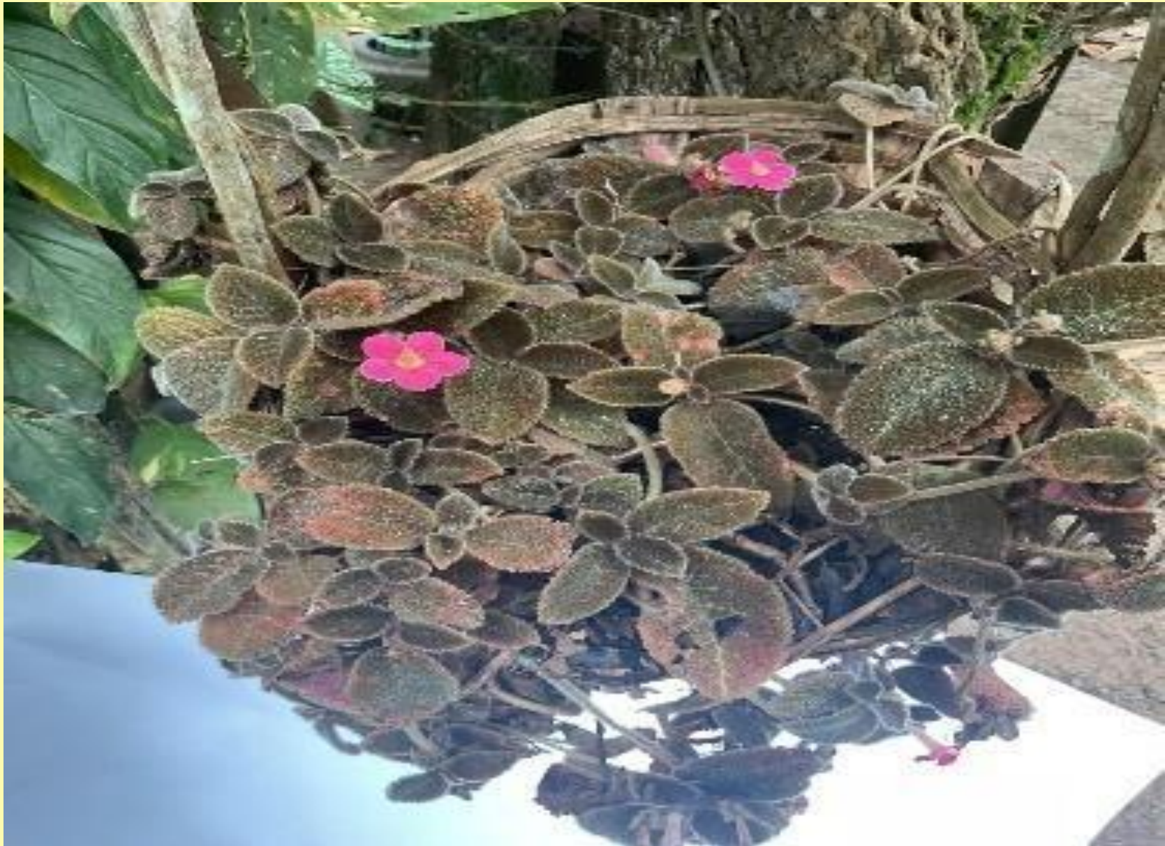
Tapete de Rainha Episcia cupreata (Hook.) Hanst.