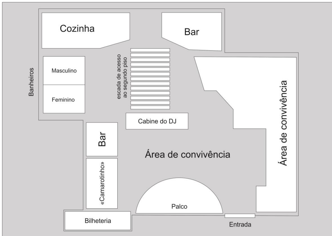
Imagem I: Morangos.