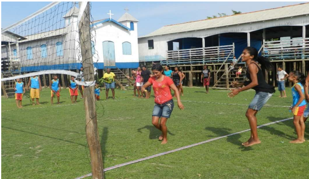
Figura 6 – Comemoração do dia das crianças na escola de Nossa Senhora das Graças.