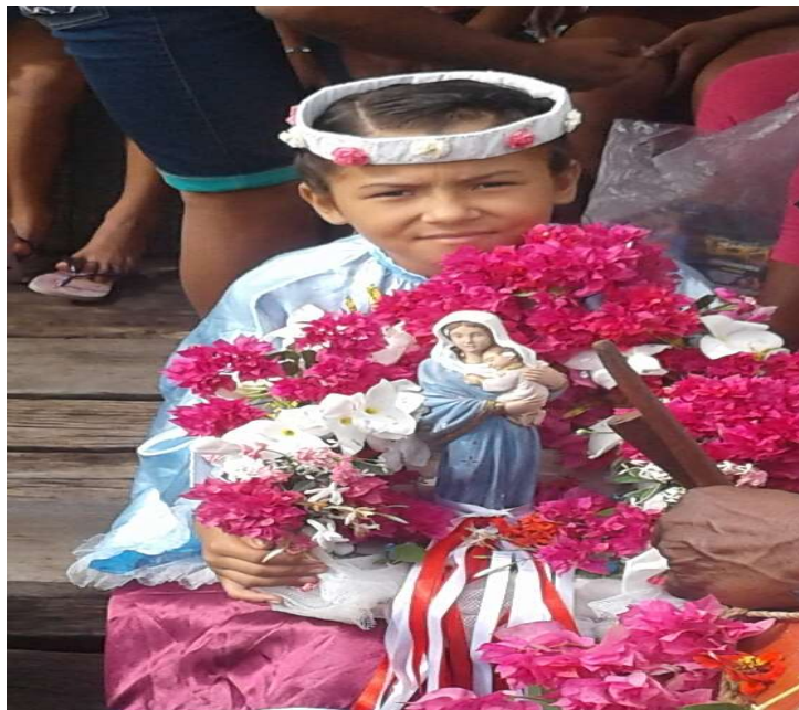
Figura 8 – Criança representando Santa Maria/2018.

Ribeiro (2017, p. 64) chama a atenção para o processo de silenciamento ao qual as mulheres têm sido submetidas ao longo da história, especialmente as mulheres negras. Possuir espaços de fala em que elas sejam de fato ouvidas é condição mínima que reverbera na efetivação do “direito à existência digna, à voz” feminina. A folia de Santa Maria coloca as mulheres em lugar privilegiado no processo de negociação na comunidade, pois lhes fornece argumentos e poder de negociação robustos, ao ponto de romper com a cultura machista impregnada na sociedade, que privilegia o espaço de fala dos homens em detrimento das mulheres.