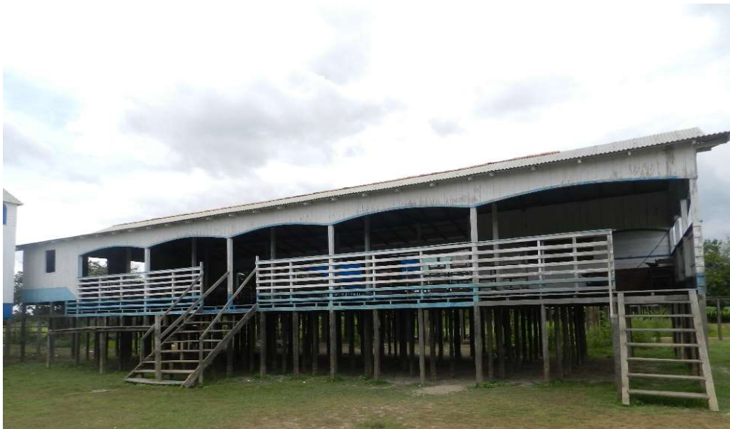
Figura 5 – Barracão comunitário que funciona como escola multisseriado.