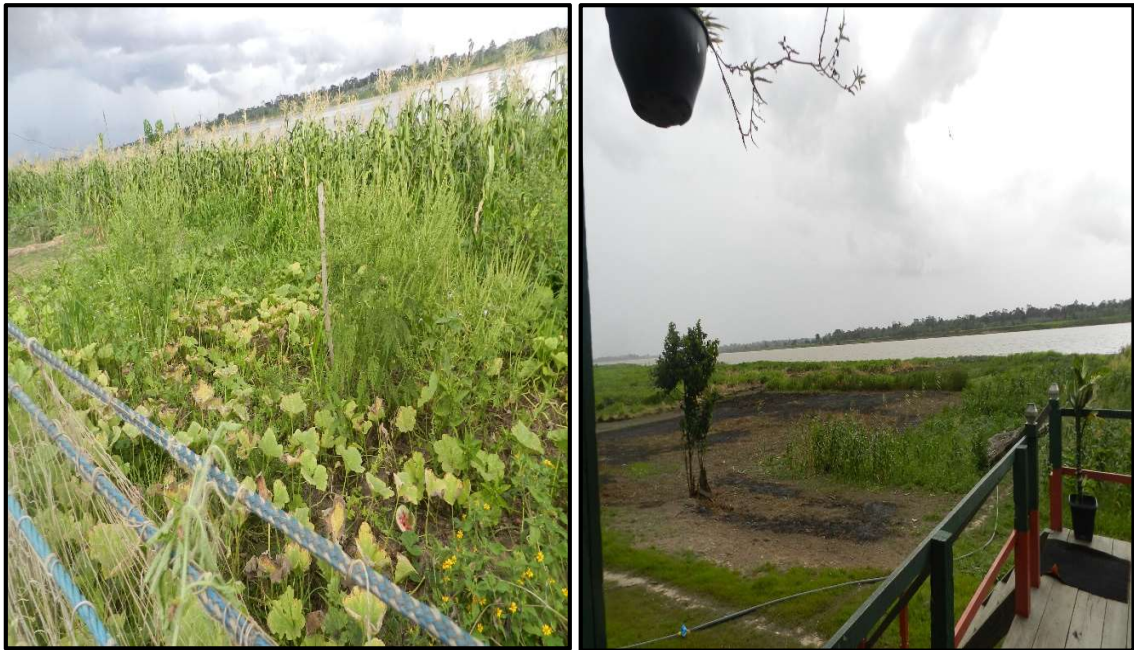
Figura 4 – Cultivo agrícola de culturas de ciclo curto, plantadas na frente das residências.

A partir da análise do cadastro das famílias realizado pelo Incra em 2016, se abstrai que 75% das mulheres exercem atividade de pesca, se declaram com pescadoras e são filiadas à colônia de pescadores sediada no município de Óbidos (Z-19). Ao mesmo tempo, tomam para si a responsabilidade de fazerem as plantações agrícolas que são realizadas no espaço compreendido entre as residências e o leito do rio, durante o período da vazante. A Figura 4 possibilita visualizar algumas plantações agrícola cultivadas na comunidade quilombola Nossa Senhora das Graças.