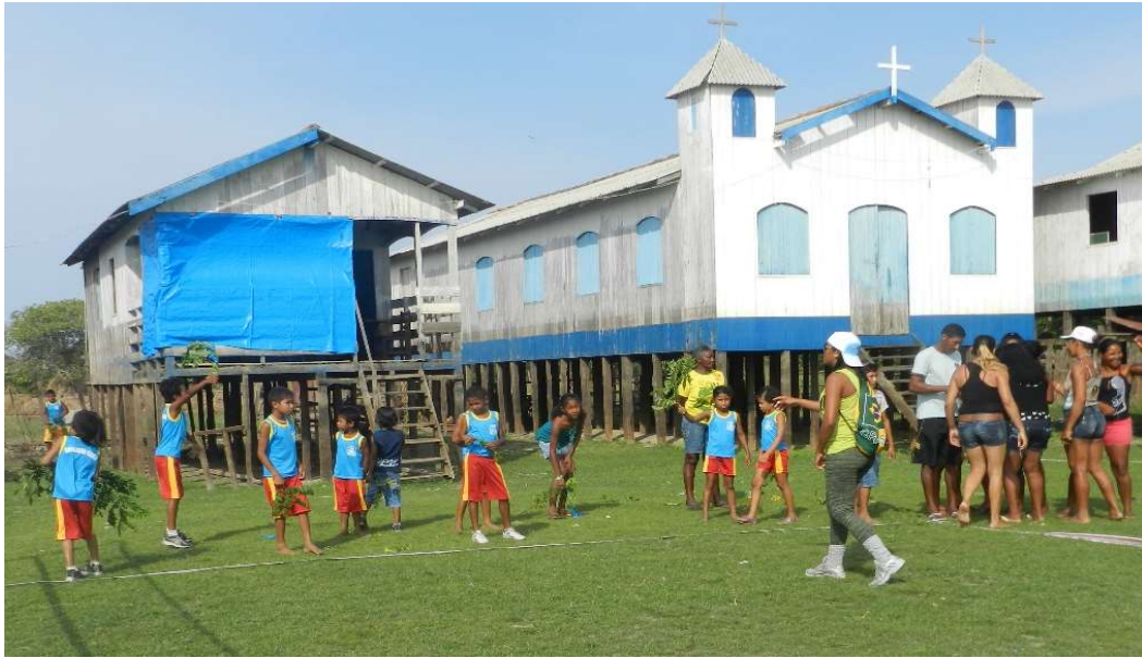
Figura 7 – Igreja de Nossa Senhora das Graça