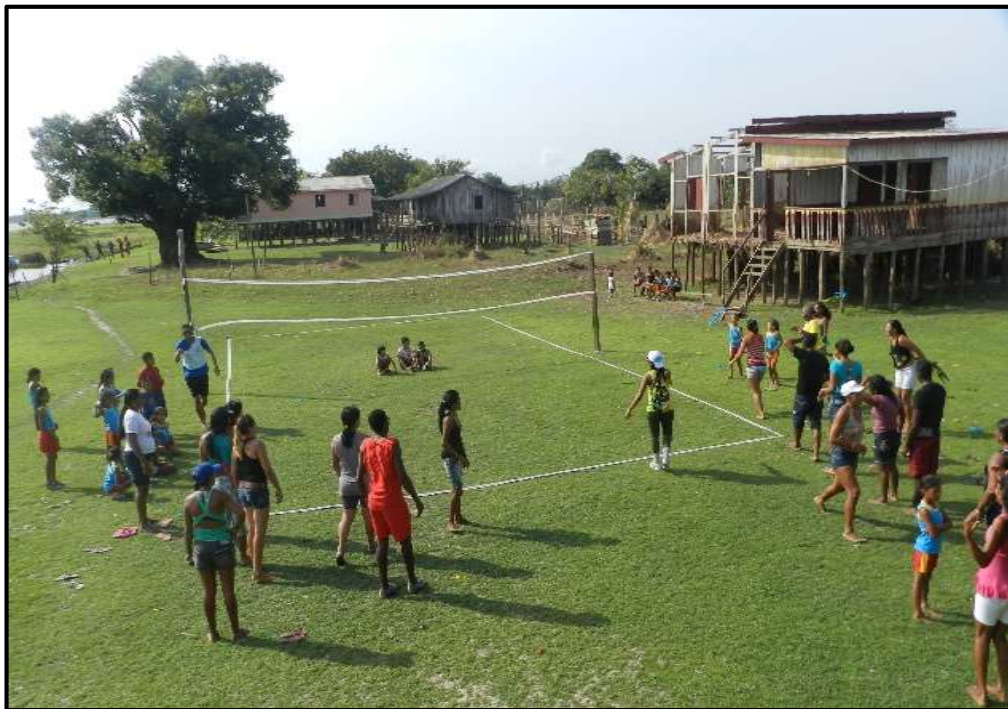
Figura 3: Recreação durante a vazante do rio em Nossa Senhora das Graças.

Na fase da vazante do rio, que se concretiza no segundo semestre de cada ano, a comunidade fica agitada: no final da tarde ocorrem as partidas de futebol, jogo de vôlei e brincadeiras variadas. A Figura 3 explicita um pouco da interação que ocorre quando solo da comunidade não está encoberto pelas águas.