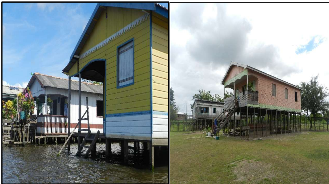
Figura 2: Fase da cheia e da vazante do rio em Nossa Senhora das Graças

Em 2018 foram empreendidas visitas a campo durante em duas fases marcantes da vida da comunidade, ilustradas na Figura 2: a cheia, quando o solo da comunidade fica totalmente imerso em águas, e no período da vazante, quando a água volta a se acomodar no leito do rio.