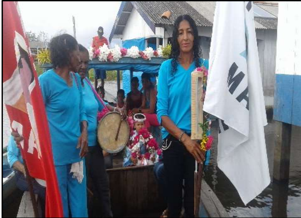
Figura 9 – Apresentação fluvial da Folia de Santa Maria/2018.

Algo pertinente de ser destacado na Figura 9 é a cor da roupa comum a todos as foliãs de Santa Maria: azul. Esta mesma cor está presente na maioria das residências das famílias e nos poucos espaços de uso coletivo existentes na comunidade: igreja, barracão comunitário e sede do Clube Novo Sucesso. De forma silenciosa e discreta, as diferentes gerações de mulheres que compõem a Folia de Santa Maria registram de forma material e espiritual a presença da folia por toda a extensão da comunidade.