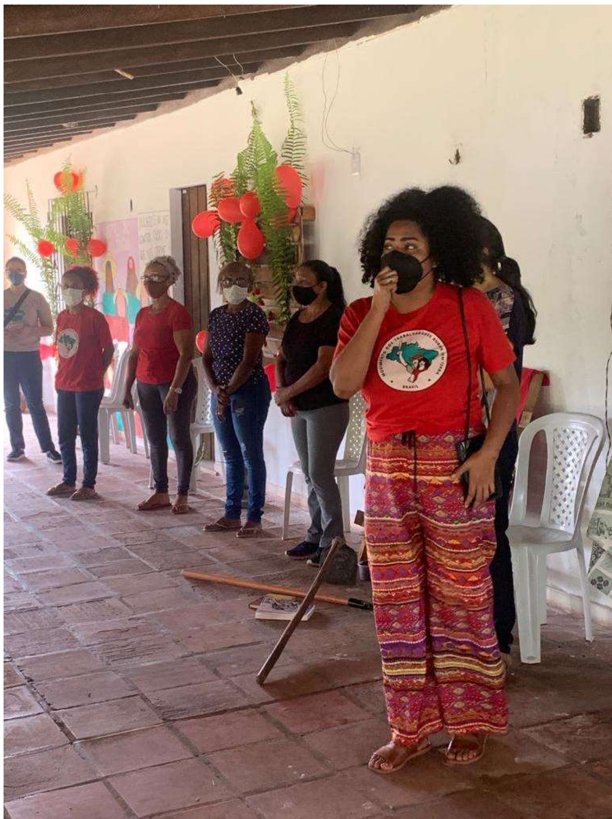
Imagem 02. Reunião de abertura da visita à área em disputa