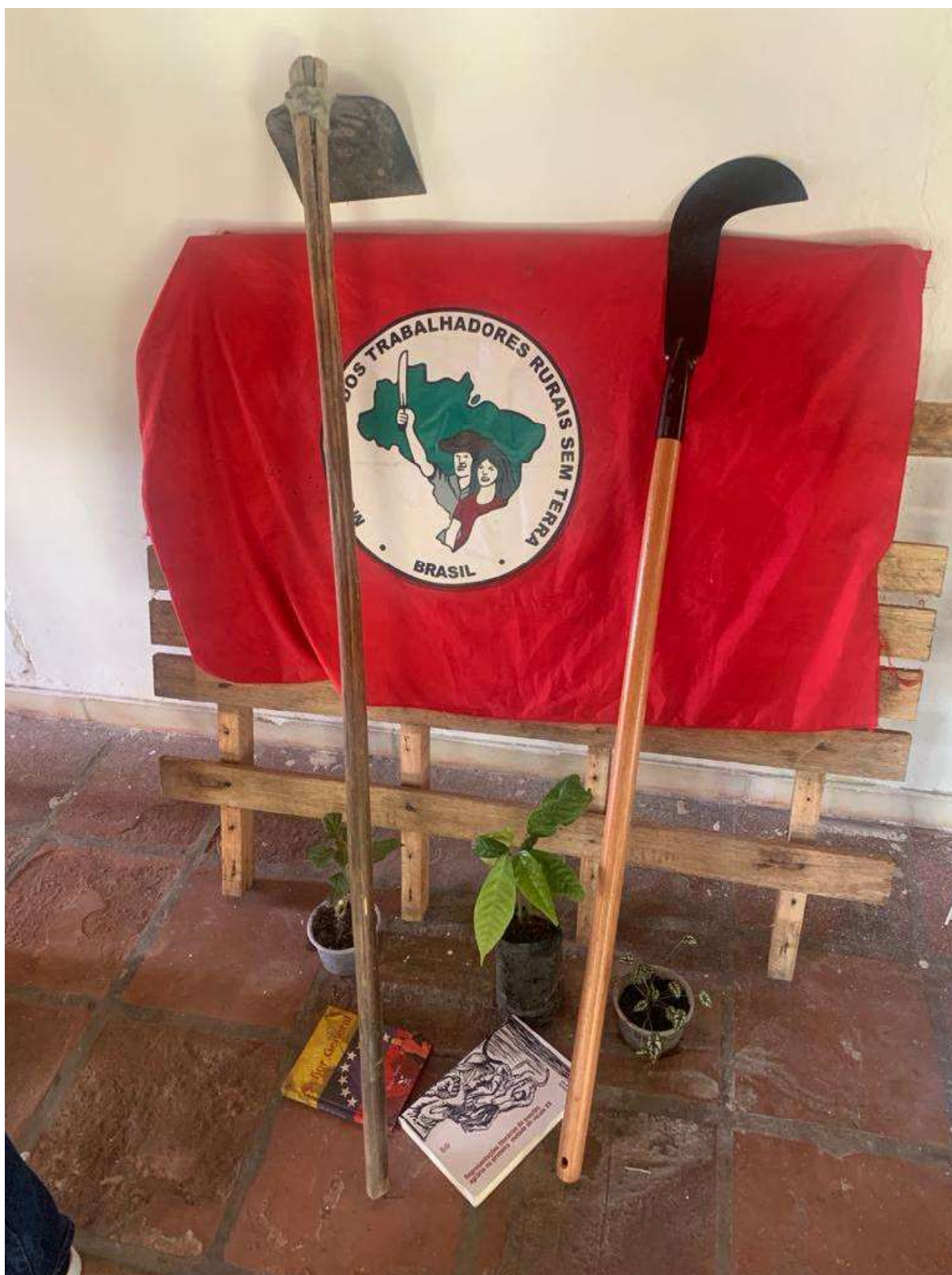
Imagem 01. Palet com ferramentas e bandeira do MST