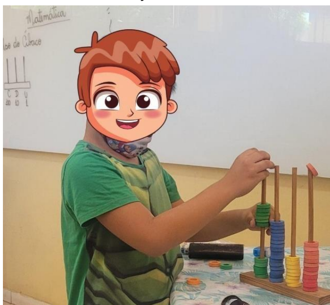
Figura 3: Aluno fazendo adição com o Material Concreto Ábaco