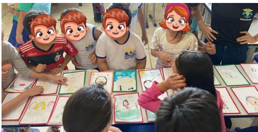
Figura 4: Amostra dos desenhos de rostos feitos pelos alunos