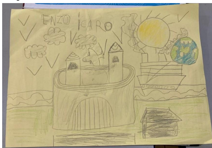
Figura 5: Desenho de um dos alunos com crítica social