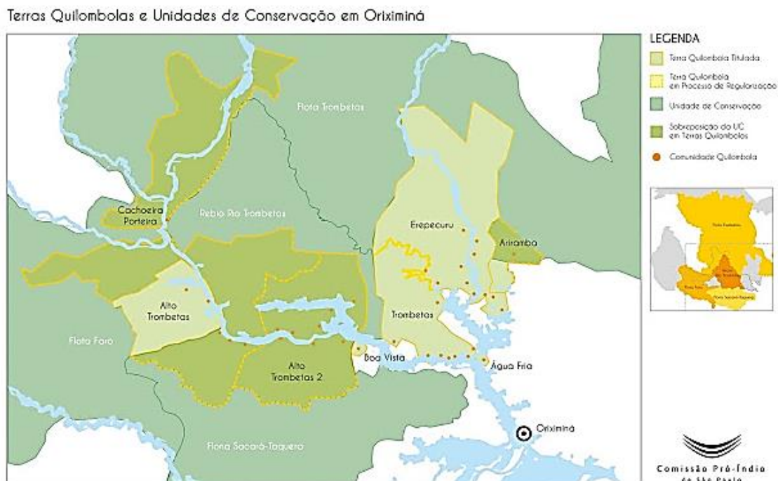
Figura 2: Mapa dos Territórios Quilombolas e Unidades de Conservação.