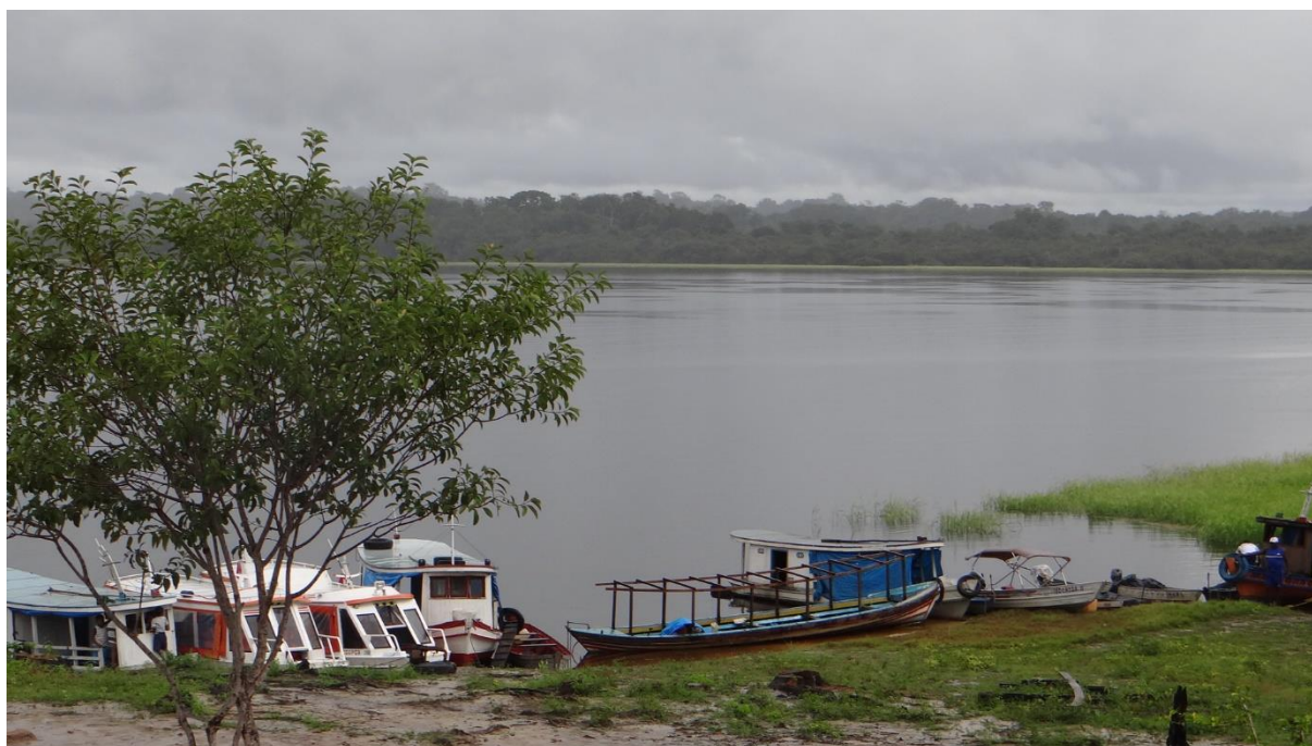
Figura 6: Lanchas, rabetas e barcos atracados em frente à comunidade de Curuçá.

órgão já foi outra durante a reunião no Moura, solicitaram o documento mas não deixaram claro se o RTID serviria como justificativa e se o pedido da associação seria deferido. UFF e Ecam, neste ponto, enfatizaram nas suas falas que os órgãos estavam na posição de negociação e chamaram atenção para a necessidade de mudança de posição com relação a esse tipo de direito da comunidade quilombola, destacando que os direitos das comunidades estavam sendo secundarizados. E por fim, cobraram maior predisposição do órgão ao diálogo e aos encaminhamentos solicitados pela associação quilombola. ICMBio informou que a resposta a essa solicitação viria no documento com as propostas do órgão para a resolução do conflito. Entre outras coisas, esses foram os principais pontos de discussão nesta reunião.