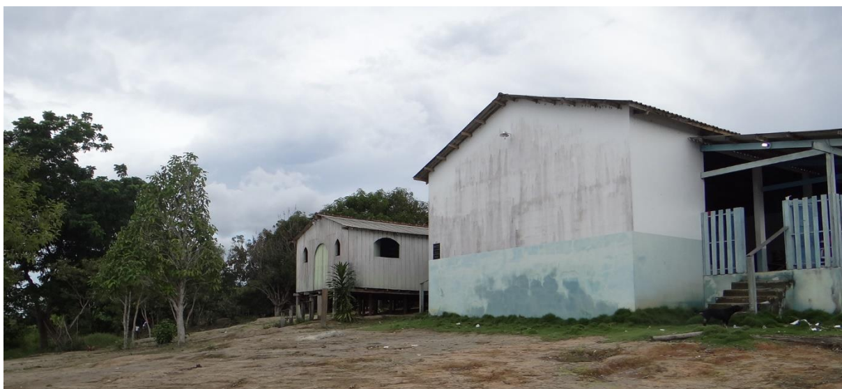
Figura 4: Barracão da comunidade de Curuçá.

A reunião em Curuçá teve início às 09:19 minutos, contou com a presença das comunidades de Juquizeiro, Juquiri Grande, Palhal e Jamari; e com representantes do MMA, ICMBio, SFB, Incra, Palmares, Ecam, UFF e Ufopa. Os líderes locais apresentaram as comunidades e em seguida os diretores e conselheiros da ACRQAT, explicando a finalidade da reunião que pretendia tratar sobre o processo de titulação do território. Após isto, a fala foi dada ao gestor do ICMBio em Trombetas, que se apresentou, reforçou a fala sobre a pauta e destacou que a reunião não tinha caráter deliberativo, era apenas informativa, que foi uma rodada de reuniões solicitadas para que explicassem para todo o território o andamento do processo e as possíveis soluções, mas que em outro momento as comunidades iriam deliberar sobre as propostas. E nessa mesma linha seguiu a fala dos outros representantes, que explicaram o papel do órgão na reunião, objetivos e expectativas.