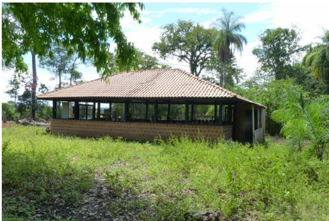
Figura 5: Vista lateral do galpão de exposição e armazenamento de cerâmicas da Comunidade Moura.