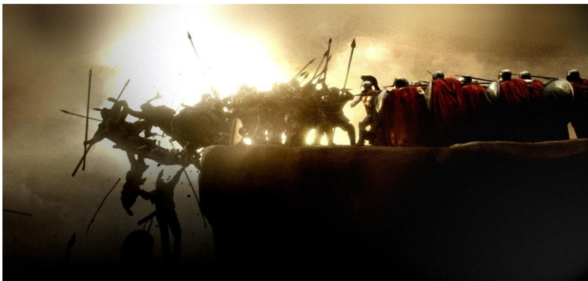
Figura 2 - Lêonidas e seus 300 derrotando persas em grande quantidade. ( 300 , Warner Bros, 2007).

O filme 300 apresenta personagens como Leônidas, Xerxes, a rainha Gorgo e Elfiades, os quais têm suas existências documentadas. No entanto, há personagens fictícios, alguns dos quais inspirados em figuras históricas reais. Dilios, por exemplo, foi baseado em Aristodemus, enquanto Stelios, em Dienece, que, confrontado com a ameaça dos persas de lançarem tantas flechas sobre os gregos que bloqueariam o sol, teria respondido que lutariam na sombra. Daxos, o guerreiro árcade, aparenta ter sido inspirado em Demófilo, embora no filme ele fuja das Termópilas para escapar do cerco persa. O capitão e seu filho Astinos são personagens fictícios, mas podem ter sido inspirados em dois irmãos, Alfeu e Marons. O vilão do filme, o conselheiro espartano Theron, é um personagem fictício (CAPARELLI, 2023, p. 10).