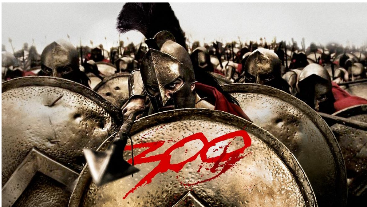
Figura 1 - Imagem de representação do exército do rei Leônidas na obra. (300, Warner Bros, 2007).

O filme 300 inicia com a narrativa de Dilios, um orador espartano que narra a história do rei Leônidas, desde sua infância rigorosa e disciplinada em Esparta até sua morte como rei durante a Batalha das Termópilas. Dilios relata que, durante o reinado de Leônidas, um mensageiro persa chegou a Esparta informando sobre os planos de Xerxes, rei dos persas, para dominar a região. Leônidas, indignado, mata o mensageiro e sua comitiva, e então organiza um exército de trezentos soldados para enfrentar os invasores persas (Figura 1). Ou seja, 300 mostra um dos episódios mais famosos das Guerras Médicas 1 , quando Leônidas, rei de Esparta, juntou 300 de seus melhores homens e reteve o maior exército de seu tempo os combatentes de Xerxes, rei da Pérsia, no estreito das Termópilas. O episódio, narrado nas Histórias , de Heródoto, no século V a.C. que foi tratado no Livro VII “Polímnia”, nos parágrafos de 193-238, na edição da editora UNB, tradução de Mário da Gama Cury, de 1988; especialmente, os parágrafos 203 (sobre Xerxes ser deus) e 211 (sobre os Imortais), e 223, 224 (sobre a morte de Leônidas) e 226 (sobre a sombra das flechas persas); e que se tornou uma excepcional lenda militar.