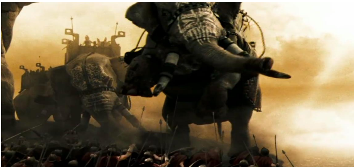
Figura 9 - Elefantes de batalha do exército persa (300, Warner Bros, 2007).

e, por outro lado, a ostentação óbvia, a extravagância excessiva, apresentada de forma quase caricatural, da qual o andrógino Xerxes é o exemplo paradigmático.