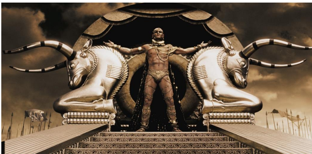
Figura 4 - Representação de Xerxes, o rei persa. (300, Warner Bros, 2007).

A representação imponente de Leônidas e dos espartanos é proeminente, destacando-se pela ênfase na força física através de anatomias robustas e vigorosas. Zack Snyder enfatiza, por meio da rudeza visual, uma característica essencial do guerreiro grego: o corpo viril como símbolo do inabalável espírito de um grupo de homens capazes de enfrentar e deter o maior exército do mundo, sacrificando-se em busca de uma glória imortal. Além de demonstrarem força, virilidade e aptidão física, os corpos de Leônidas e seus companheiros são retratados com uma beleza, perfeição e eficiência acentuadas. O filme utiliza diversos momentos de câmera lenta para convidar o espectador a contemplar o cenário e os corpos em ação, enquanto combatem seus inimigos. A ênfase na observação dos músculos e das veias em movimento cria uma atmosfera contemplativa e extática, sendo que tal êxtase parece menos pertencer ao espectador e mais ao próprio filme (SANTIAGO JÚNIOR, 2013, p. 120).