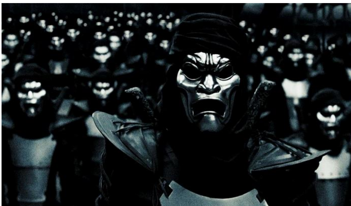
Figura 6 - Representação do exército dos Imortais persas (300, Warner Bros, 2007).

do contingente grego, além de serem retratados negativamente. Enquanto os espartanos estão visivelmente armados, expondo seus corpos e rostos, com suas identidades, nomes e histórias considerados relevantes e memoráveis, os Imortais, por outro lado, escondem sua humanidade sob vestes negras, representando a ausência de identidade individual (Figura 6). Essa uniformidade é reforçada pela máscara que usam, anulando qualquer traço distintivo de suas personalidades (DIAZ PLATA, 2011, p. 345).