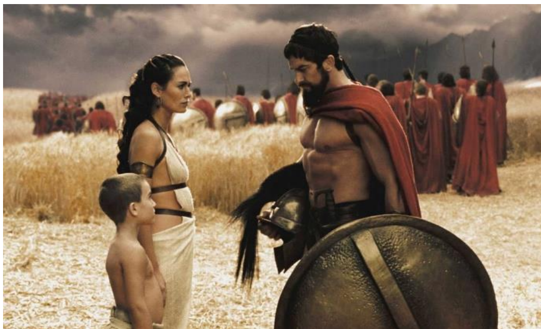
Figura 7 - Rei Leônidas demonstrando calma (300, Warner Bros, 2007).

momentos de vitória e mesmo diante do inevitável desfecho da batalha, Leônidas mantém-se imperturbável, sem se deixar levar por emoções excessivas. (MAIA; COELHO, 2018, p. 489).