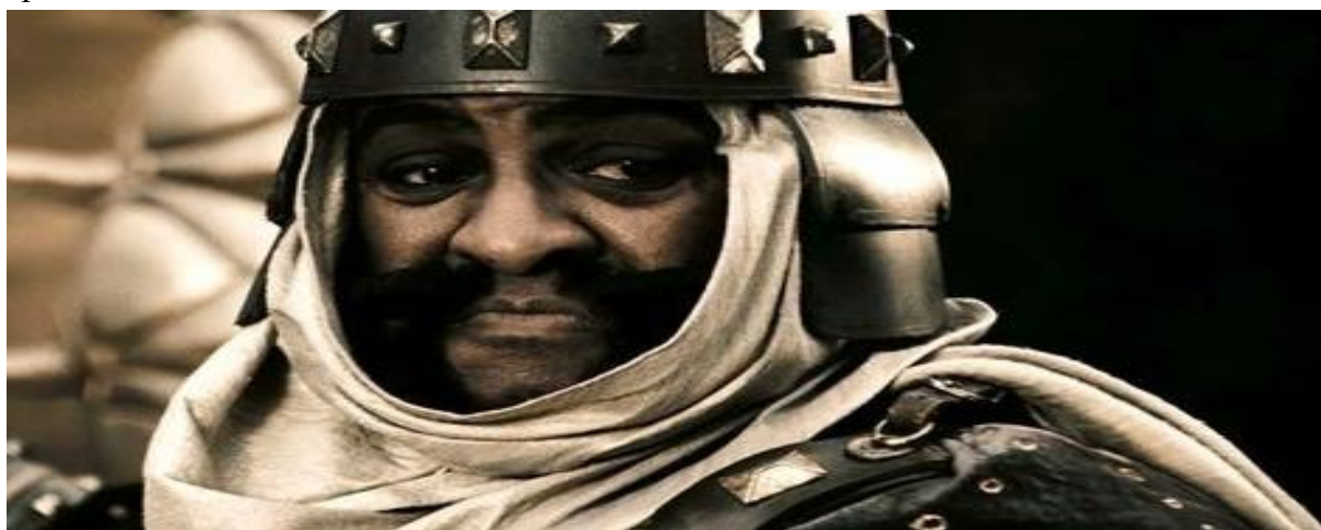
Figura 10 - Emissário persa (300, Warner Bros, 2007).

Para Diaz Plata (2011), a representação dos persas pelos gregos enfatizava fortemente o uso do ouro como um elemento essencial na sua caracterização. No entanto, a controvérsia em torno dessa caracterização exagerada revela-se infundada, visto que ela é mais uma reelaboração estilizada do estereótipo do persa na ficção ocidental. Uma representação potencialmente mais problemática é a descrição dos persas como predominantemente de pele escura (Figura 10). Isso pode ser interpretado como uma estratégia para destacar a diferença cultural dos persas, contrastando-os com os "arianos" espartanos. O exagero presente na representação dos persas como uma horda demoníaca bizarra serve para intensificar o caráter épico da narrativa.