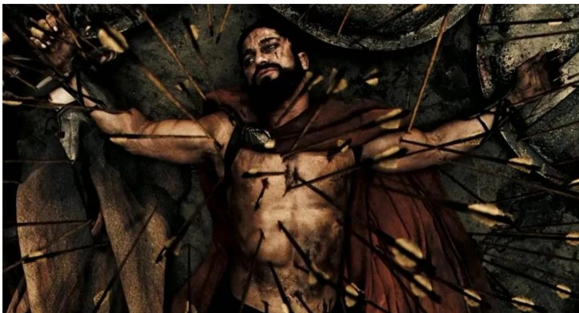
Figura 8 - Rei Leônidas em seu último momento da batalha contra os Persas. (300, Warner Bros, 2007).

derrotá-lo em combate corpo a corpo. Leônidas não sucumbe às mãos de um homem, mas sim às flechas de todo um império, que obscurecem a luz do sol. Todas essas nuances evidenciam a importância da abordagem imagética e visual em 300 e como essa narrativa está repleta de simbolismos que podem passar despercebidos pelo espectador (MAIA; COELHO, 2018, p. 491-492).