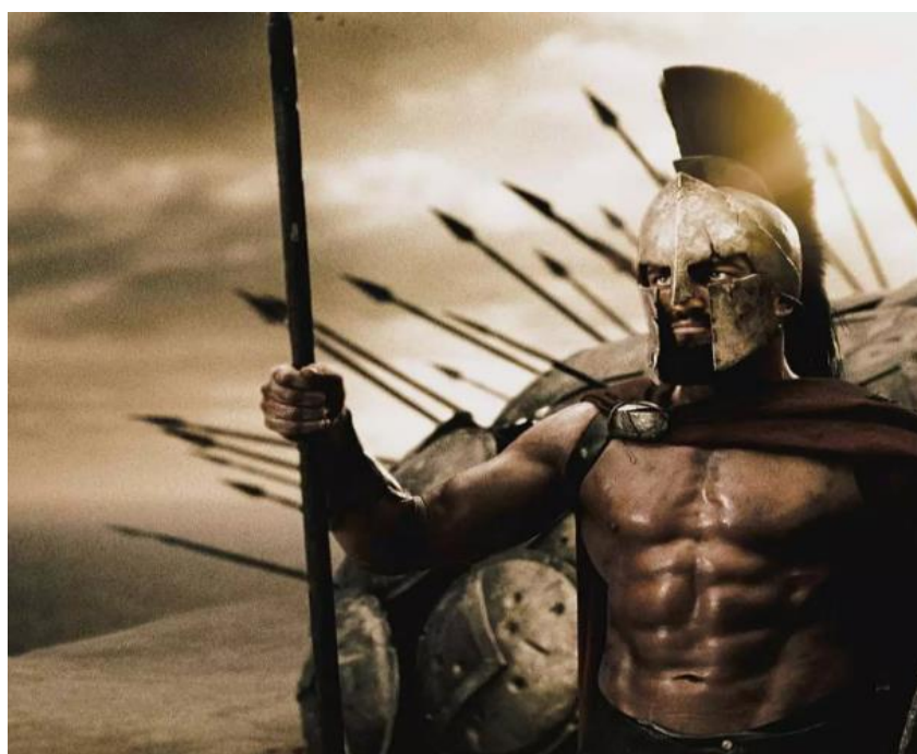
Figura 3 - Representação do Rei Leônidas (300, Warner Bros, 2007).

Em determinado momento do filme, após um ataque por uma grande quantidade de persas, Leônidas e seus trezentos espartanos encontram-se em uma situação de significativa desvantagem numérica. Leônidas, ao observar o ambiente ao seu redor, identifica a presença de um penhasco. Reconhecendo a oportunidade estratégica, ele instrui seus soldados a direcionarem os inimigos em direção ao penhasco. O desfecho resulta em uma derrota devastadora para os persas, que são lançados ao mar (Figura 2). Demonstrando assim que o filme emana a imagem da liberdade dos gregos antigos e de como era importante a união e a garra, para que um pequeno exército de trezentos homens pudesse enfrentar dezenas de milhares de guerreiros do Império Persa (CASTRO; JOSÉ; NÓBREGA; REINALDO, 2011, p. 2).