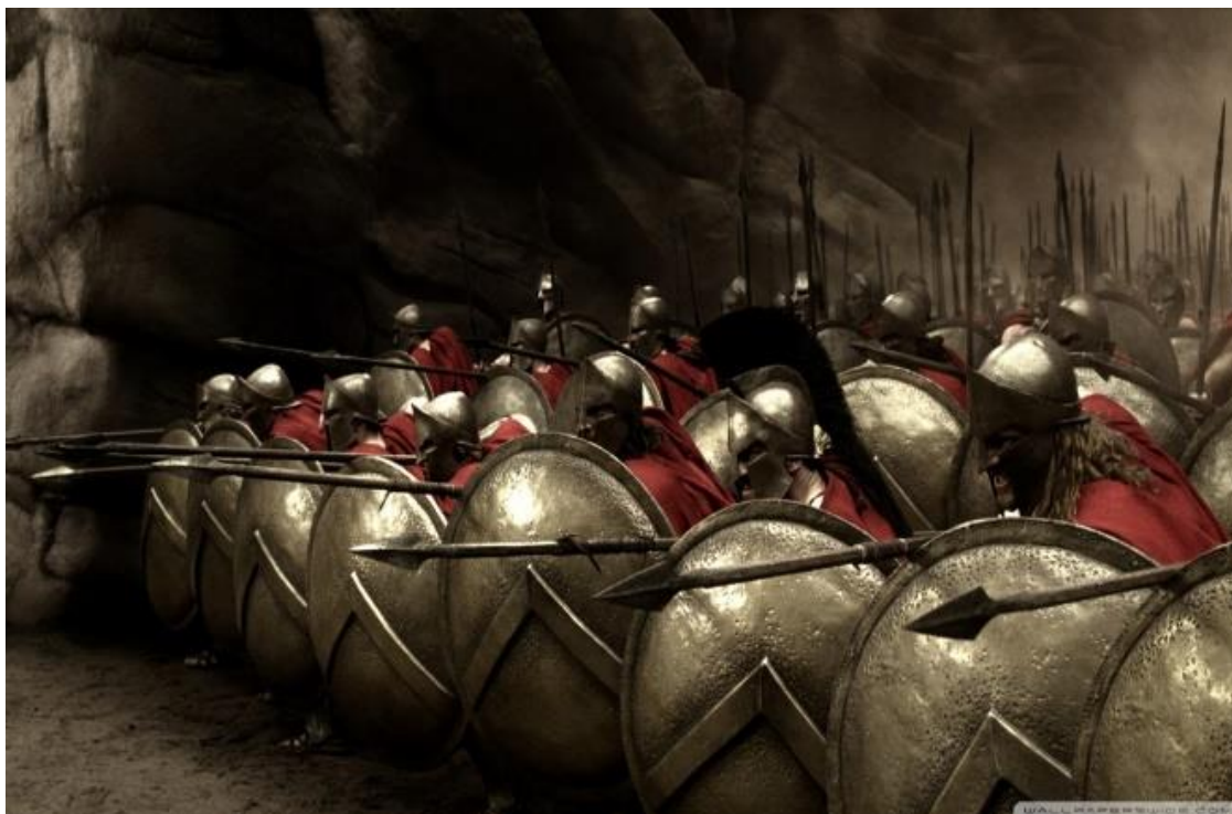
Figura 5 - Representação do exército espartano (300, Warner Bros, 2007).

interpretados como valores adaptados aos da sociedade atual, em favor de uma tirania despótica. A figura de Xerxes, portanto, assume um papel emblemático, personificando não apenas a ameaça militar persa, mas também uma encarnação dos excessos e da opressão despótica. Sua autoproclamada divindade, associada a uma extravagância luxuriosa, serve como uma representação visual e simbólica dos vícios e das falhas morais que os gregos atribuíam aos persas (MACIEL, 2009, p. 54).