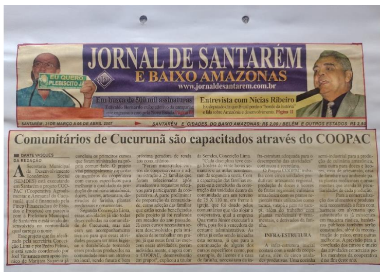
FIGURA 4: CAPACITAÇÕES EXECUTADAS PELA COOPAC.