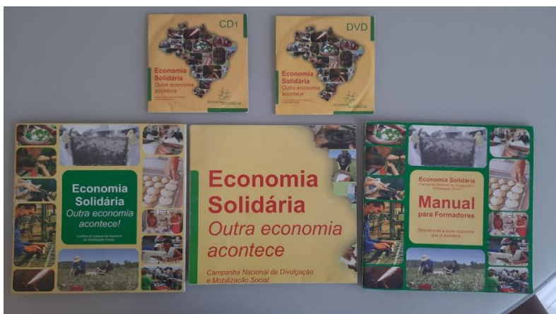
FIGURA 6: CARTILHAS, MANUAL E CD-ROM ECONOMIA SOLIDÁRIA