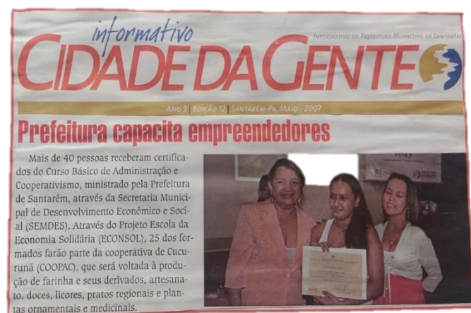
FIGURA 3: CAPACITAÇÕES EFETUADAS PELA PREFEITURA.