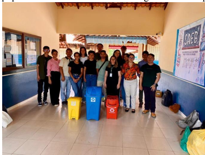
Figura 11 - Equipe da atividade de extensão entregando lixeiras para a escola