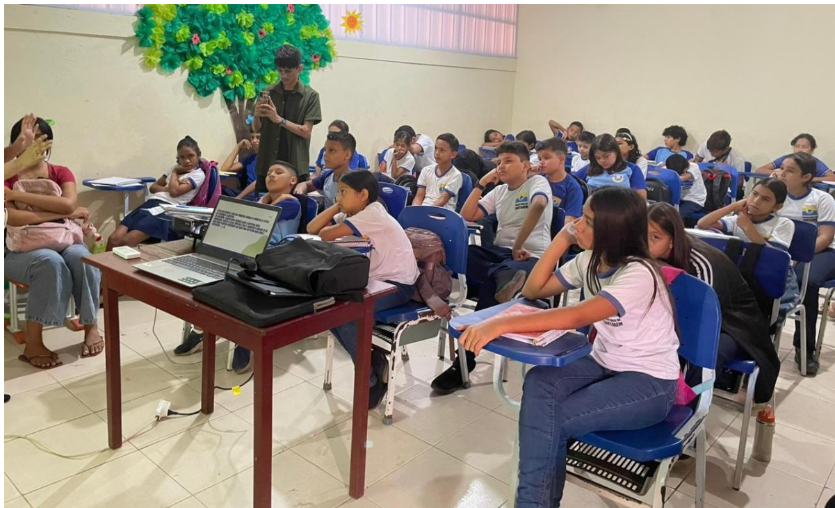
Figura 6 - Apresentação sobre Reflorestamento para os alunos do 5º ano da E.M.E.F Boaventura Queiroz