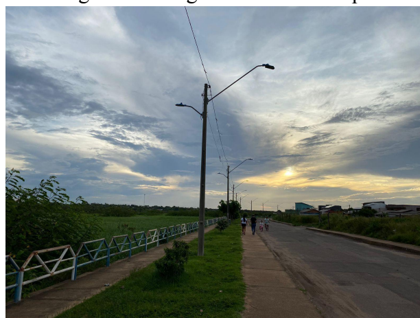
Figura 3 - Imagem da orla do Mapiri

Os que mais sofrem são as crianças e os idosos com o calor intenso e falta de sombras ao saírem na rua (Figura 3), segundo dados da Organização das Nações Unidas (ONU) apesar de estarmos na maior floresta tropical do mundo, as cidades da Amazônia são as que mais sofrem com as mudanças climáticas e até 2050 será a região com as cidades mais quentes. Outrossim, a arborização deve ser levada em consideração, mas não apenas a arborização, a preservação e a conservação são pilares essenciais para que essa situação mude.