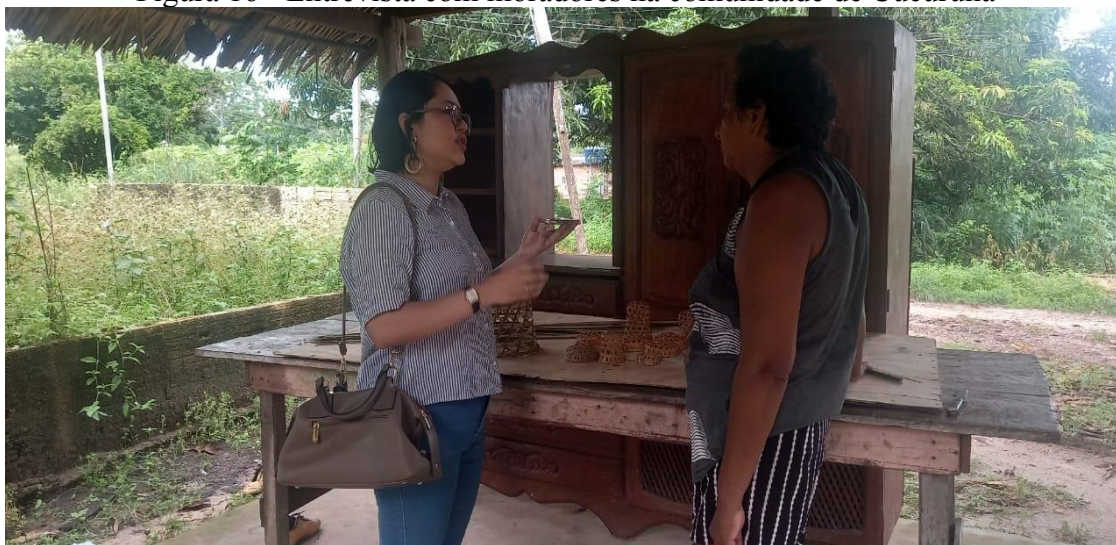
Figura 16 - Entrevista com moradores na comunidade de Cucurunã

condições financeiras fica sem acesso ou enfrenta uma dificuldade dobrada”, disse o líder comunitário (Figura 16). Desta forma, o diagnóstico situacional realizado na comunidade Cucurunã revelou que a falta de documentação básica é um problema recorrente e que causa forte impacto sobre a população, principalmente sobre aqueles que vivem em vulnerabilidade social e econômica.