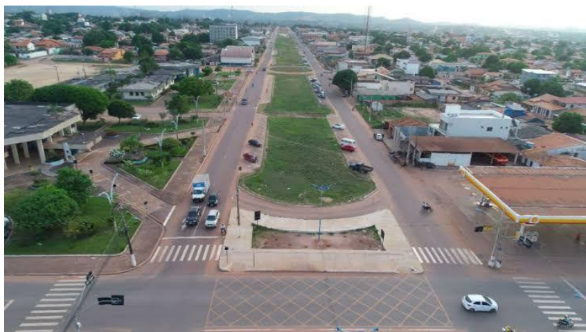
Figura 1 - Imagem panorâmica da área estudada na Av. Anísio Chaves