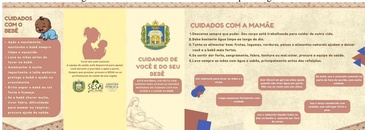
Figura 14 - Folder educativo confeccionado para as gestantes

Sesai (Figura 14). Ao final das entregas, a equipe discente foi parabenizada pela ação e valorizado o esforço para aquisição dos materiais doados, logo, a parceria com a SESAI foi considerada efetiva, garantindo que a ação fosse realizada de acordo com as necessidades reais das gestantes e fortalecendo os vínculos entre universidade e comunidade.