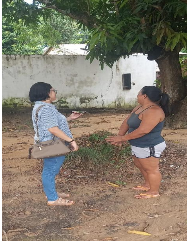
Figura 17 - Entrevista com moradores na comunidade de Cucurunã