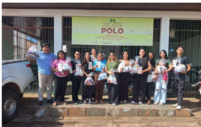
Figura 13 - Equipe do projeto com a coordenação da SESAI entregando os kits

Cada kit continha sabonete, escova e pasta dental, absorventes, fraldas descartáveis, lenços umedecidos, gazes e folder educativo com orientações simples sobre autocuidado e cuidados com o bebê. Dessa forma, todos os kits foram entregues à equipe gestora da SESAI no dia 05 de dezembro pelo turno da manhã, beneficiando diretamente 15 gestantes indígenas atendidas pelo polo, que receberão os kits posteriormente pela equipe da Sesai (Figura 13).