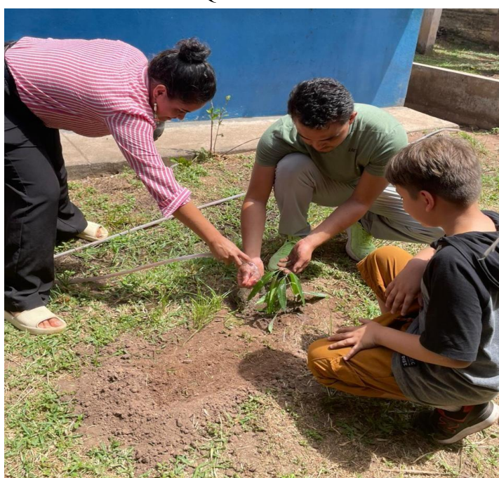
Figura 5 - Atividade Prática de Plantio com os alunos da E.M.E.F Boaventura Queiroz

As crianças demonstraram grande interesse, participando com perguntas e relatos do cotidiano. Em seguida, foi realizada a atividade de plantio, onde as turmas participaram do plantio de algumas mudas selecionadas, reforçando de maneira prática a mensagem de cuidado com o meio ambiente e valorização da arborização (Figura 5). Os alunos acompanharam o processo de preparo do solo, plantio e rega, vivenciando uma experiência significativa e pedagógica. Ao final das atividades, realizamos um momento de integração e confraternização com a distribuição de lanche para todas as turmas.