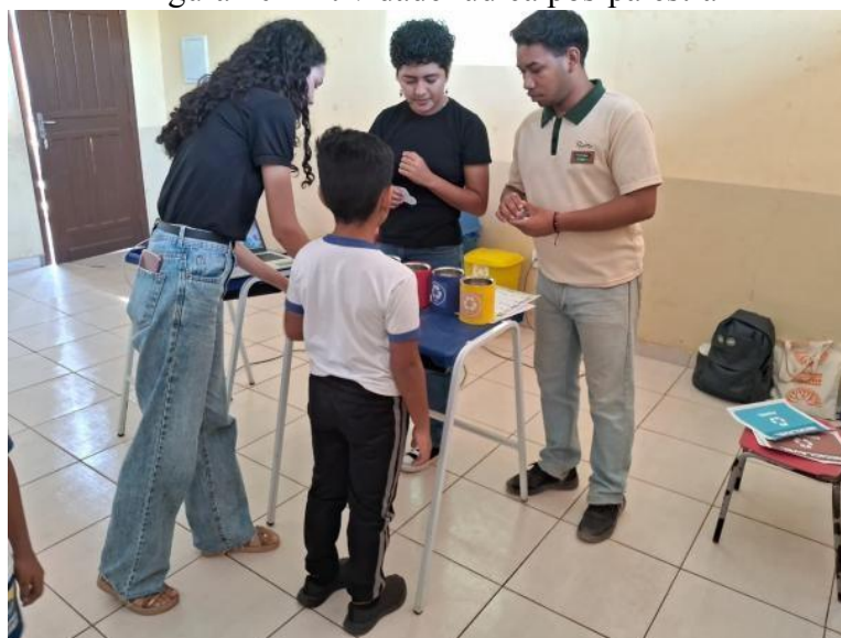
Figura 10 - Atividade lúdica pós-palestra