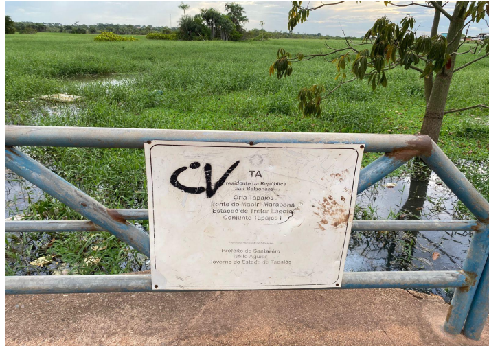
Figura 2 - Imagem da orla do Mapiri, com a placa vandalizada

pavimentação e meio-fio). Tais índices evidenciam o atraso do município nas questões ambientais. Portanto, faz-se necessário políticas públicas nessa região que se voltem para o meio ambiente e o bem estar das pessoas que residem nessas localidades.