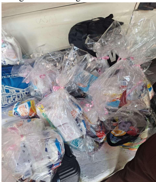
Figura 12 - Entrega dos kits à SESAI