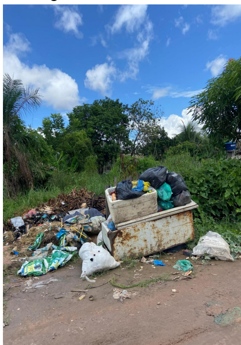
Figura 7 - Lixo a céu aberto

A falta de consciência sobre o descarte correto do lixo é um problema grave, principalmente em bairros recém-formados que ainda estão em processo de urbanização. Um exemplo é o bairro Vista Alegre do Juá, na zona urbana, onde a coleta de lixo não é bem organizada (Figura 7). Os caminhões passam apenas pela rua principal, deixando muitas vias sem atendimento. Com isso, o acúmulo de lixo no chão é significativo. É comum ver pessoas, especialmente crianças voltando da escola, jogando sacolas de salgadinhos, garrafas PET, canudos e outros resíduos no chão. Quando chove, a água carrega esse lixo para as casas mais baixas e, como as ruas levam ao rio Tapajós, todo esse material acaba poluindo suas águas.