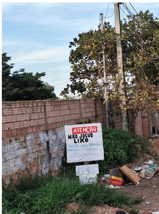
Figura 8 - Placa de conscientização