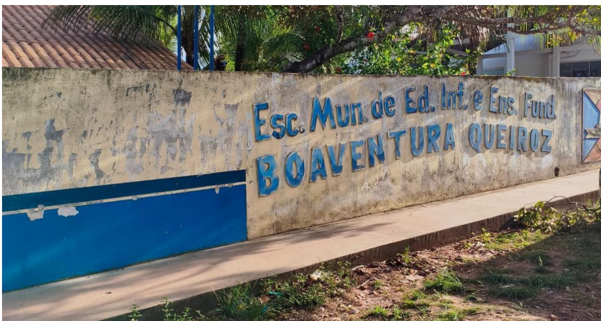
Figura 4 - Fachada do muro da E.M.E.F Boaventura Queiroz, localizada na Comunidade de São Braz, do Município de Santarém/PA

A execução do projeto ocorreu na Escola Boa Ventura Queiroz, na comunidade de São Braz (Figura 4), contemplando três turmas: 1º, 3º e 5º ano. Ao todo, aproximadamente 186 crianças foram atendidas pelas atividades dos dois projetos integrados: Descarte e Reflorestamento. Para garantir melhor aproveitamento do tempo e organização pedagógica, o horário foi dividido entre os grupos, permitindo que cada turma participasse das duas ações de forma equilibrada. As atividades iniciaram com palestras educativas, adaptadas à faixa etária das turmas, abordando a importância do descarte correto dos resíduos sólidos, os impactos do lixo na natureza e a relevância do reflorestamento para o equilíbrio ambiental.