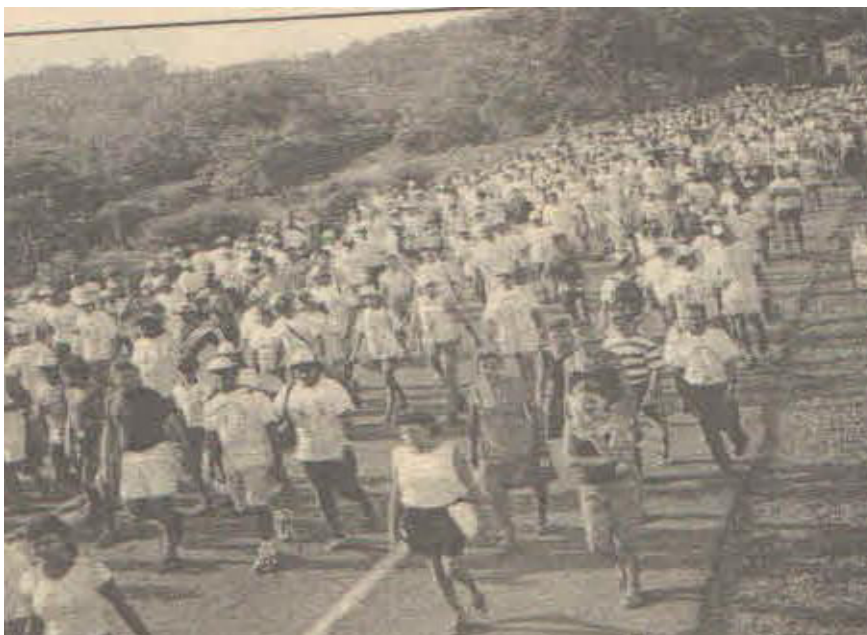
Figura 9: Participantes da Caminhada de Fé com Maria saída do Tabocal.

Belterra e Mojui e, principalmente, por ser um ponto estratégico, devido estar em ótimas condições de trafegabilidade até Santarém, atraindo inclusive fieis de comunidades que ficavam mais próximas e, conseqüentemente, poderiam fazer o percurso menos longo.