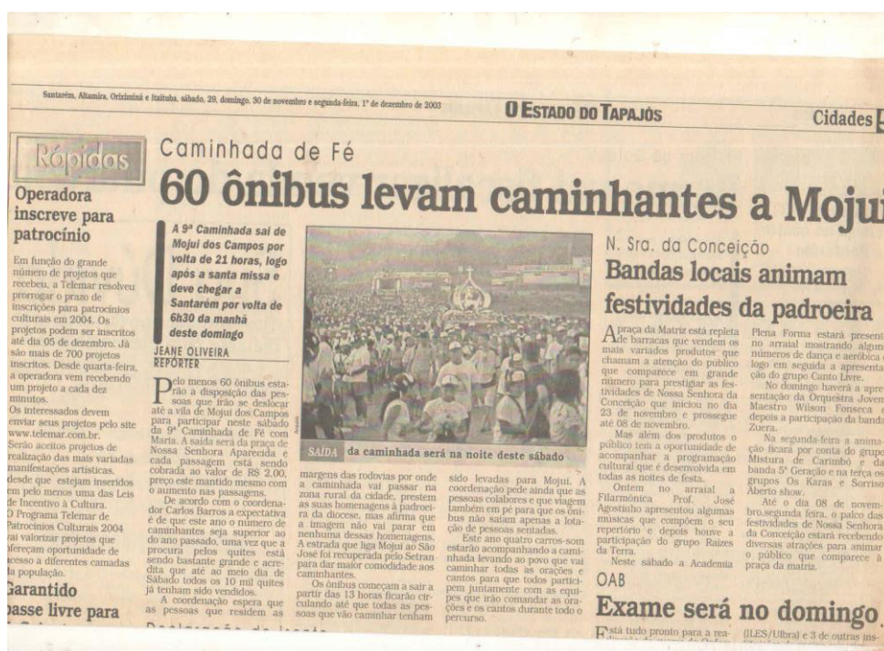
Figura 8: Reportagem acerca da Caminhada de Fé com Maria no jornal.

Vale ressaltar, também, que muitas empresas de ônibus se beneficiam da caminhada devido ao imenso fluxo de fiéis que se dirigem à cidade de Mojuí dos Campos, conforme citado no jornal O Impacto (2003), “cerca de 60 ônibus devem sair de Santarém transportando pessoas até a cidade de Mojuí, esse número sendo aumentado a cada caminhada, devido ao aumento consecutivo de fiéis”.