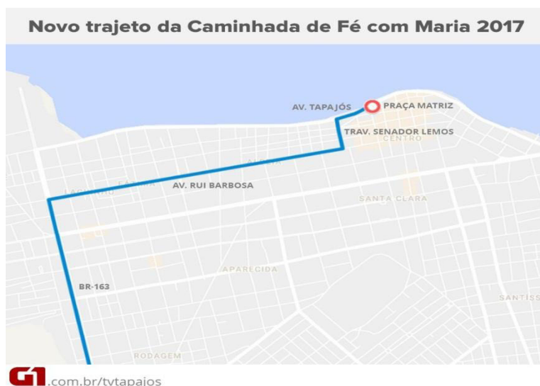
Figura 2: mudança do trajeto da 23ª caminhada