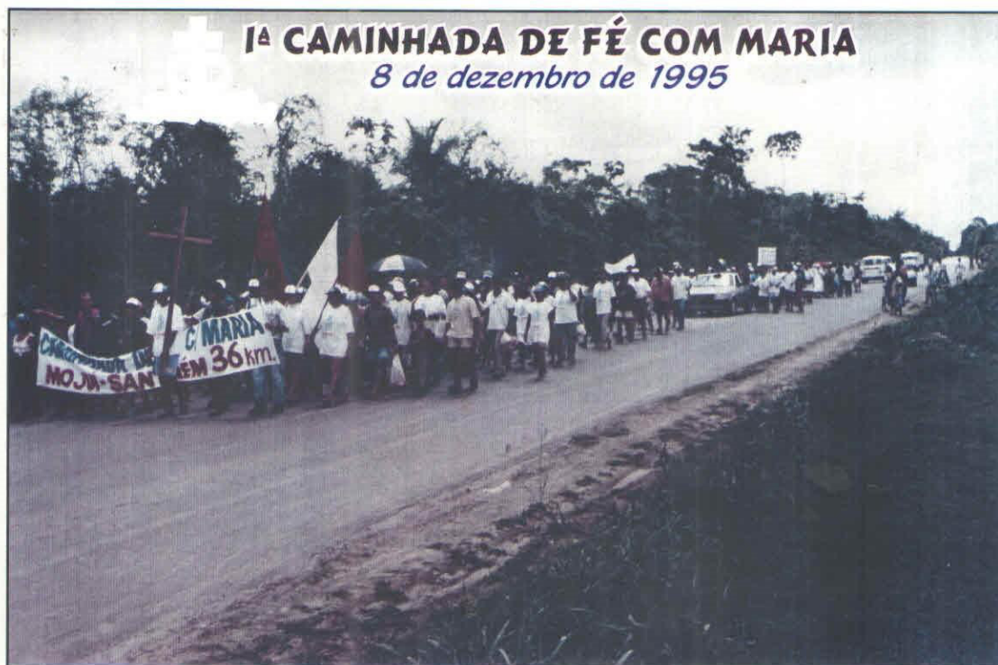
Figuras 1: Participantes da Caminhada de Fé com Maria Ano: 1995.

A organização primária, formada para realizar a manifestação religiosa, muitas vezes ultrapassa os próprios limites e expectativas originais de sua produção, estendendo-se por outros campos de ação, especialmente nas grandes metrópoles, onde a experiência do agrupamento e da associação pode construir laços afetivos, relações diretas e personificadas e reforçar a capacidade de ação (AMARAL, 2003). É nessa lógica que insere a Caminhada de Fé com Maria , manifestação de fé tradicional no município de Mojuí dos Campos (PA).