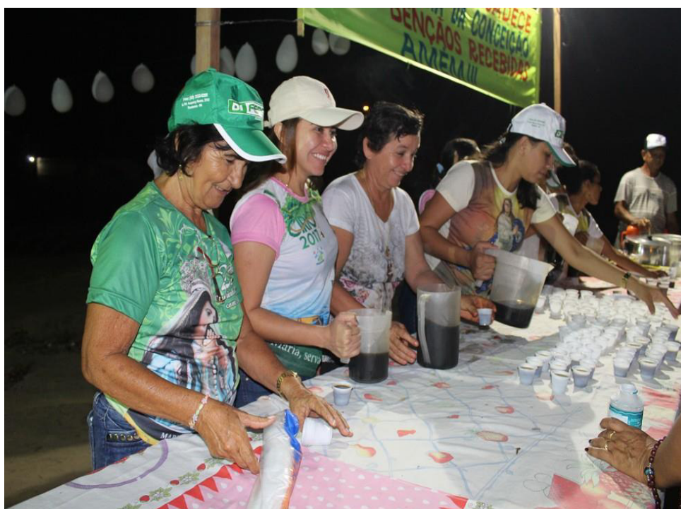
Figura 3: Distribuição de lanches ao longo do percurso.

Ressaltando-se que, ao longo do trajeto, comunidades adjacentes preocupam-se em fazer doações de água, sopas, cafés, frutas, como forma de agradecimento, ajudando os caminhantes sem pedir nada em troca, apenas bênçãos de Nossa Senhora, além de prestarem homenagens à Padroeira, durante seu percurso. A distribuição de comida e bebida nas festas e o investimento em espetáculos, conforme Amaral (1998, p. 85), “podem ser entendidos como concentração e redistribuição de bens, o que também acontecia (através do critério da participação dos mais diversos agentes sociais), com os bens simbólicos, permitindo a inclusão, na cultura da festa brasileira, de diversas visões de mundo”.