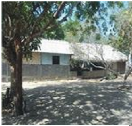
Figura 02: – Santarém-PA, 22 de novembro de 2012.