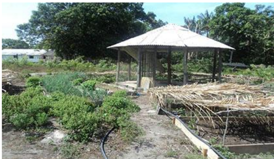
Figura 7: O Projeto Mandalla na comunidade de Santa Maria. Fonte: Arquivo Pessoal – Santarém-PA, 22 de novembro de 2012.

No caso da comunidade de Santa Maria, esse sistema sob a forma de mandalla já vem sendo implantado, conforme pode ser observado na figura que segue: