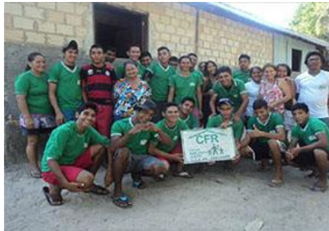
Figura 01: Alunos da CFR da comunidade de Santa Maria (Santarém-PA), 22/11/2012

Hospedada desde 16 de julho de 2012, na comunidade de Santa Maria, região do Eixo-forte, em Santarém, no Pará, seu objetivo ao chegar à comunidade era encontrar uma área de terra onde pudesse ser construída uma mínima estrutura que servisse de abrigo aos alunos durante as semanas de alternâncias (Figura 1).