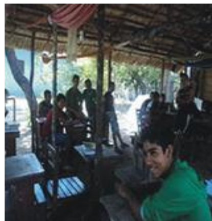
Figura 03: Arquivo Pessoal – Santarém-PA, 22 de novembro de 2012.

As árvores exercem função especial (figura 02), oferecem abrigo e sombreamento durante o dia para o descanso após o almoço, como sala de aula e trabalhos em grupo, e também, na estação do verão, para atar redes durante a noite (Figura 3).