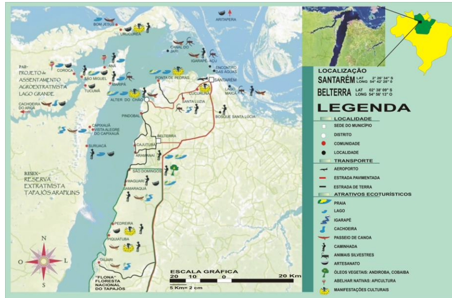
Figura 04:

uma noção bastante objetiva da região de abrangência do município de Santarém, pode-se observar o mapa que segue.