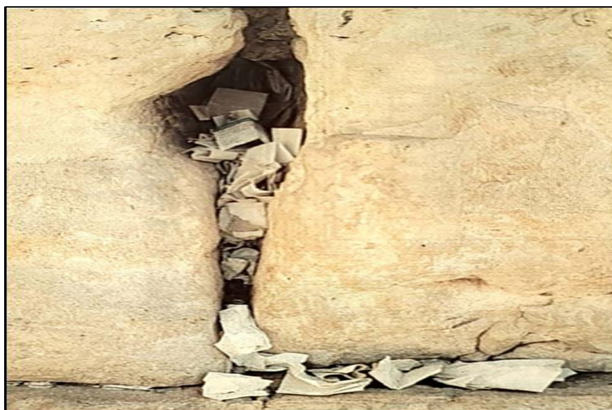
Figura 5: Papéis com pedidos de oração ainda são colocados entre as grandes pedras do Muro das Lamentações.