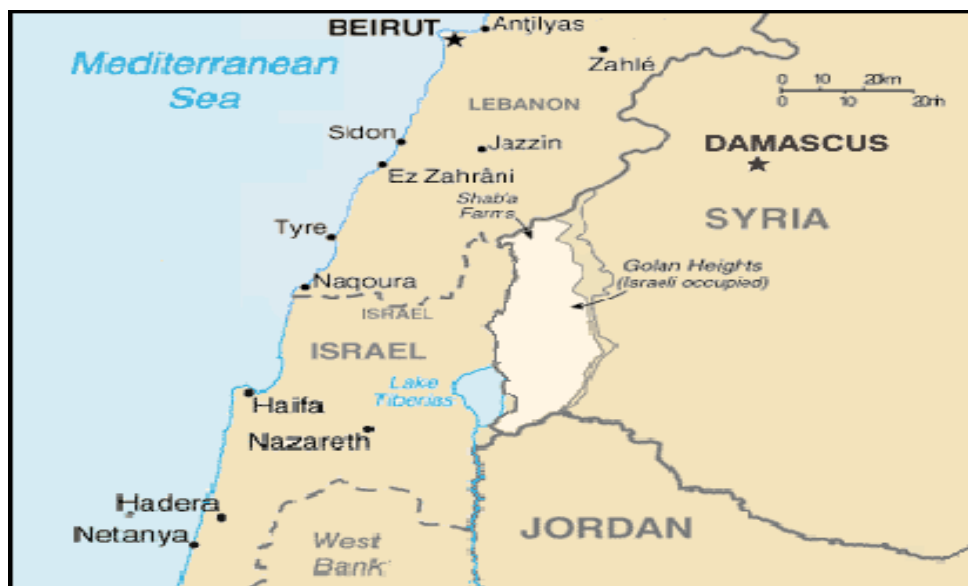
Figura 8: Localização das Colinas de Golã / Golan.

Apesar de ser conhecida como um território sírio, pois não foi considerada pela ONU como parte de Israel, o território das Colinas de Golã é ocupado e administrado por Israel desde 1967, conforme a figura 8.