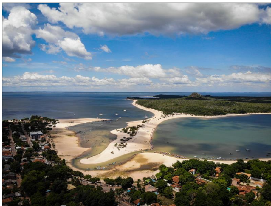
FIGURA 2: Vila de Alter do Chão.

O entendimento acerca do pensamento de Carlos (2007) e Sturza (2020) encaminha para o exemplo que pode ser aqui citado: a vila de Alter do Chão, figura 2. É um lugar cheios de símbolos culturais da região oeste do Pará, que preserva na memória dos seus moradores e visitantes, lembranças desse lugar, então isso, faz sentir – se como parte dele.