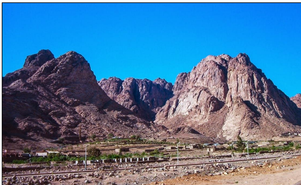
Figura 4: Monte Sinai, o monte de Deus.