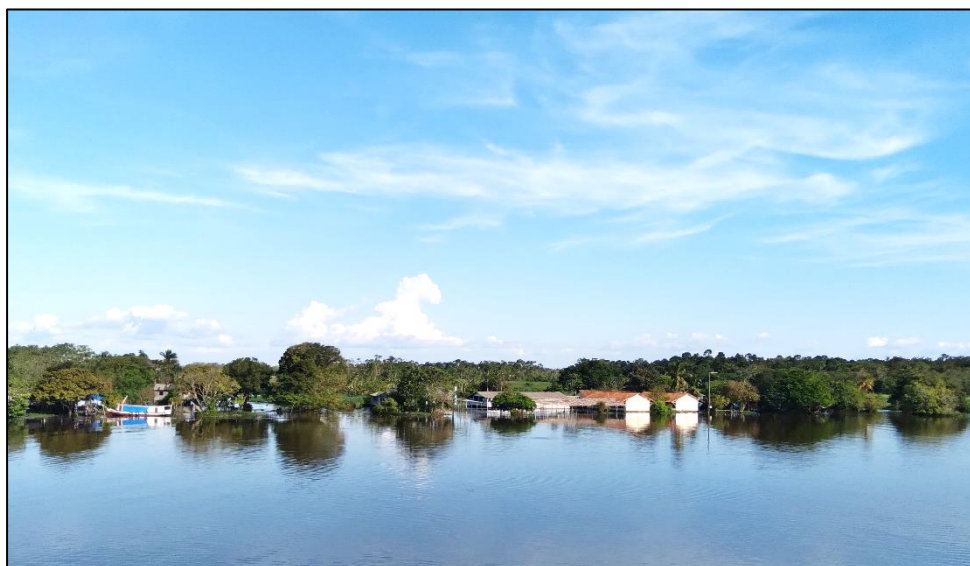
FIGURA 1: Comunidade Ribeirinha.