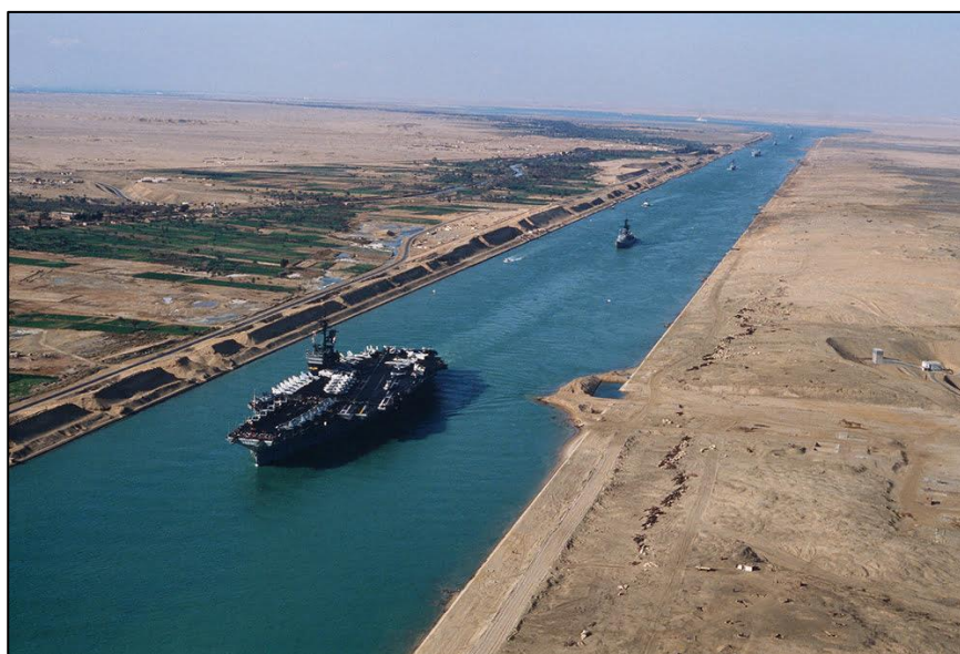
Figura 7: Navio porta aviões passando pelo canal de Suez.

Segundo Carvalho (2021), o canal de Suez é um canal artificial que foi criado para diminuir o tempo de viagem dos grandes navios de carga, facilitando trajeto da Ásia para a Europa, sem ter que contornar a África. O canal tem hoje em dia cerca de 193,30 km de comprimento, com 24 metros de profundidade e 205 metros de largura o tempo de travessia do canal dura entre 11 e 16 horas, (Figura 7), transportando todo tipo de mercadorias, promovendo um fluxo de embarcações.