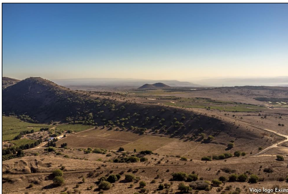
Figura 9: Colinas de Golã / Golan.

primeiro por ser um lugar montanhoso, e em segundo por conta dos diversos conflitos que persistem em acontecer. Contudo de acordo com Andrade (1987, S/P), a maior relevância em relação as Colinas de Golã ocorre porque: “as terras do Basã, por causa de sua fertilidade, constituem-se um celeiro para Síria e o Estado de Israel”, e, por conta disso permanece como sendo uma área que continua muito disputada entre os países.