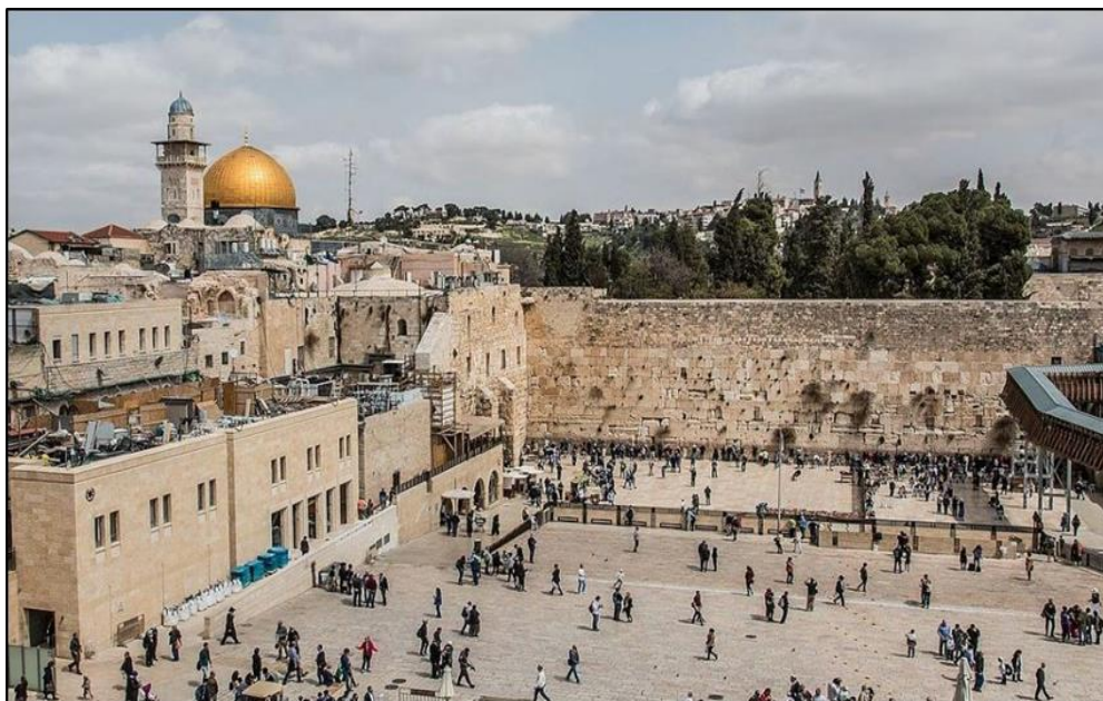
Figura 6: Praça principal de Jerusalém, e parte do Muro das Lamentações.