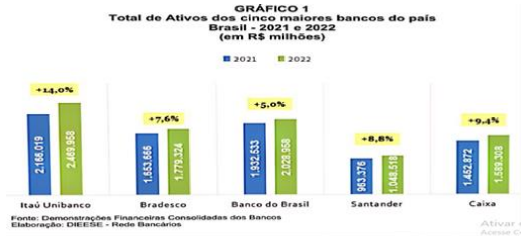
Figura 01 – Total de Ativos dos Cinco Maiores Bancos do País Brasil – 2021 e 2022 (em R$ milhões)

despesas operacionais e inadimplência. Dos bancos em questão, lidera o ranking o Itaú Unibanco que teve uma aumento percentual de 14 %, e o Banco do Brasil foi o que teve o resultado pior em relação ao demais com uma alta de 5,0%, já o Bradesco que teve um crescimento de 7,6% em seus ativos a Caixa Econômica 9,4% no período e Santander, por sua vez 8,8%.