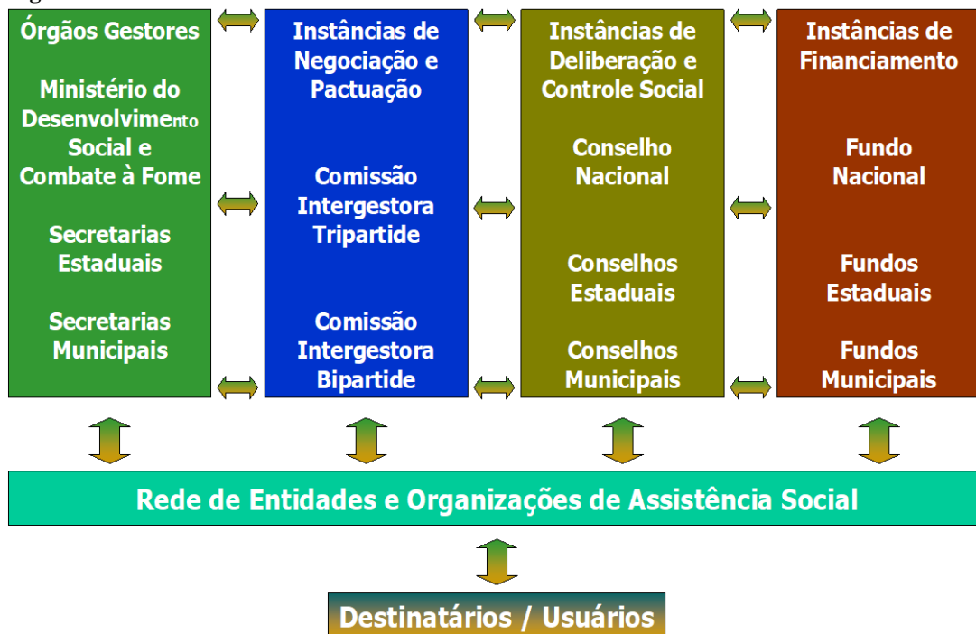
Figura 2: Estrutura do Sistema Único de Assistência Social