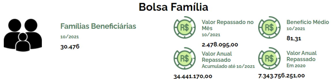
Figura 1: Dados cadastrais do Bolsa Família em Santarém

do Núcleo do SUAS, o Bolsa Família que segundo o CECAD, em Santarém até no início do último trimestre do ano passado (2021) eram no total de 30.476 famílias beneficiadas.