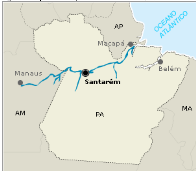
Figura 1 – Mapa de localização da cidade de Santarém (PA)