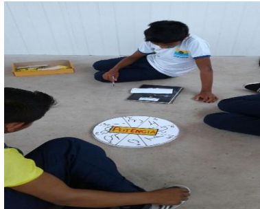
Figura 4 compreensão do jogo