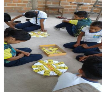
Figura 5 alunos jogando