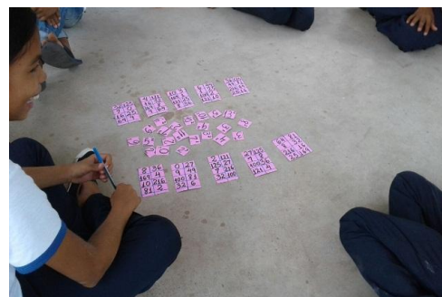
figura 7 jogo do dominó

Este jogo do bingo é muito bom para fixar os conceitos da potenciação, que são frequentemente confundidos com a multiplicação da base pelo expoente.