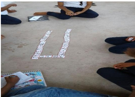
Figura 1 peças de dominó

Percebeu-se que o jogo representou um desafio para os alunos, envolvendo-os com a interação e cooperação grupal, servindo assim como fonte de aprendizagem.