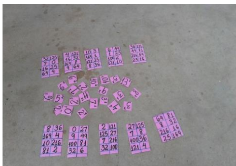
Figura 6 peças do bingo