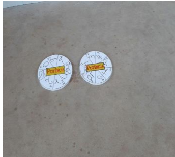
Figura 3 roda de potenciação

Este jogo facilitou a compreensão e fixação dos conteúdos de forma divertida e prazerosa. Verificou-se que os alunos se sentiram desafiadores com a proposta do jogo de utilizar conceitos já estudados.