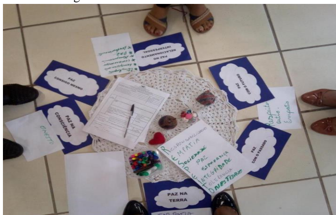
Figura 2. Encontro Círculo de Conflito

No círculo restaurativo de conflito, estava presente a vítima e o agressor, a facilitadora e eu acadêmica de direito, durante o círculo fora feitas as apresentações, uma dinâmica de escrever os valores que iriam, estão presentes naquele momento, a facilitadora colocou num papel a palavra respeito e com cada letra, cada um colocava uma palavra. Após essas introduções a facilitadora entrou no teor do conflito, em que entregava o objeto da palavra para cada um, ambos tinham seu momento de falar e a vítima em todo momento chorava bastante, era evidente a necessidade de que o agressor escutasse tudo que ela estava sentida e que ele reconhecesse que errou com ela. Como participante foi forte aquela situação tinha momentos que queria chorar e abraçar aquela mulher para consolar, mas me mantive firme durante todo o círculo mesmo com essa vontade interior. Após o círculo terminar ambas as partes foram para sala do setor psicossocial para lavrar o acordo entre eles.