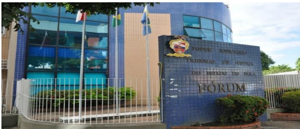
Figura 1 - Fórum Des. Ernesto Adolfo de V. Chaves — Av. Mendonça Furtado, s/n. — Bairro Liberdade.

A coleta de dados para a composição dessa pesquisa foi realizada no Fórum de Santarém na vara de violência doméstica e familiar, município de Santarém – Pará, que fica localizada — Fórum Des. Ernesto Adolfo de V. Chaves — Av. Mendonça Furtado, s/n. — Bairro Liberdade.