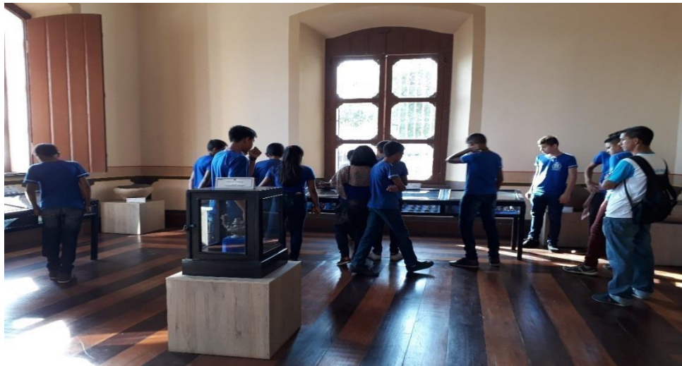
Imagem 03 - Observação do acervo cultural.