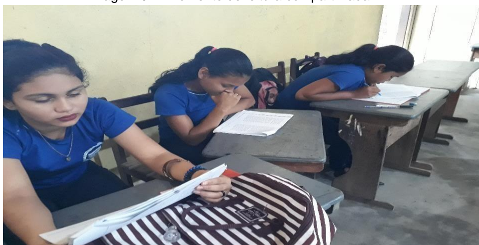
Imagem 04 - Momento de leitura compartilhada.

Diante deste fato compreende -se que a leitura literária nos permite debater temas do cotidiano em uma perspectiva construtivista de aprendizagem cultural e social.