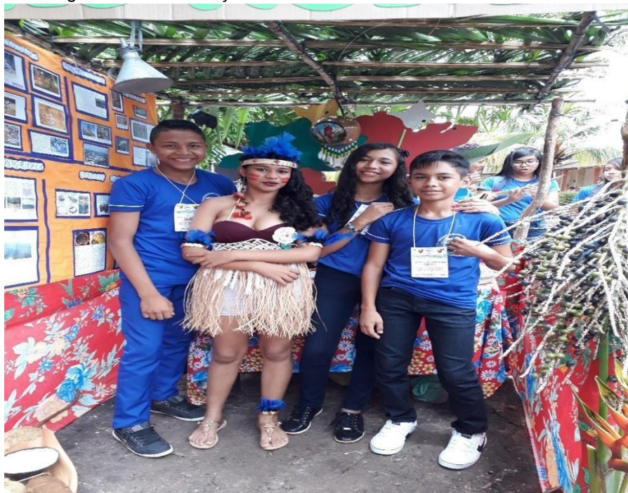
Imagem 07 - Socialização dos contos na feira do conhecimento.