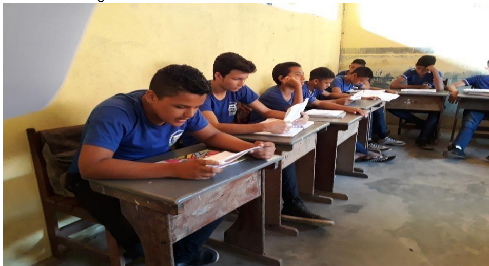
Imagem 01 – Alunos em contato com o texto literário.

manauara, dando a ideia de ampliação dos limites partindo do âmbito local para o regional.