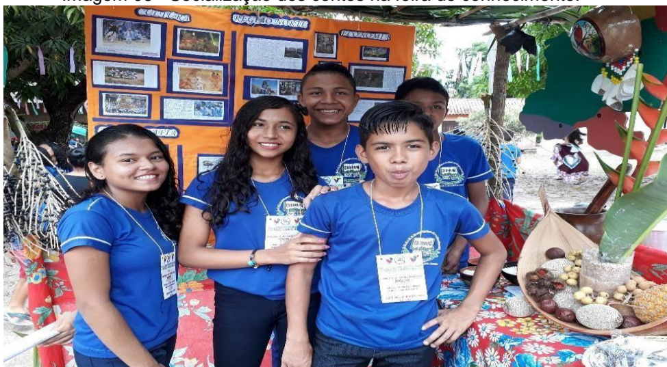
Imagem 06 - Socialização dos contos na feira do conhecimento.

Nesta apresentação ao público, um grupo de 6 alunos, foi escolhido para socializar à comunidade escolar o conhecimento adquirido em sala de aula. Neste evento, além do texto literário, os alunos puderam falar também, sobre outros temas que envolvem a Amazônia como a culinária e a economia, através dos ciclos exploratório, descrito aqui, em capítulos iniciais. Era enorme a satisfação dos expositores em falar sobre a Literatura Brasileira e de Expressão Amazônica, principalmente no que diz respeito as narrativas e suas peculiaridades como a descrição do local onde os contos se passam.