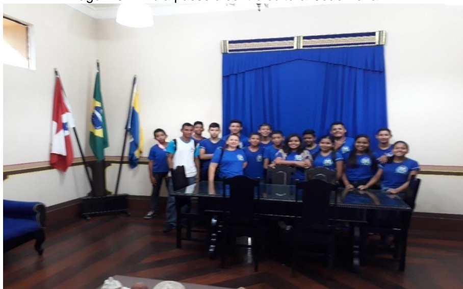
Imagem 02 - Aula passeio centro cultural João Fona.

reflexão acerca da realidade amazônica. Desta forma, comprovamos que práticas de leitura, como esta podem ajudar na formação de sujeitos críticos e reflexivos e que tem a oportunidade de ver na literatura uma diversidade de sentido que lhe edificam a vida. O diálogo com outra disciplina, do currículo escolar, oportunizou vivenciar situações da vida real de maneira diferenciada, aproximando as experiências descritas no texto literário com experiências cotidianas, promovendo uma interação na busca da construção dos sentidos do texto.